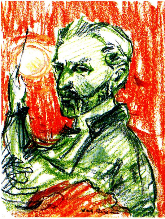
Interpretation von van Gogh. Die Umrisse entsprechen den Landesgrenzen von Holland. Oelkreide, um 1975.