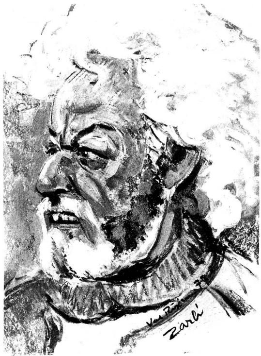
Der Schauspieler Zarli Carigiet. Oel, 1977.

risches bricht durch. «Du bist ja der geborene Buchillustrator. Hast Du noch nie versucht, Texte mit dem Zeichenstift zu begleiten?» – «Doch, einige belanglose Kalender habe ich illustriert. Lang ist's her.» – Nach einer Pause. «Wenn es Dich interessiert, will ich Dir die jüngsten Versuche zeigen.» – Schon hat er einen grossformatigen Block geöffnet und blättert durch. Ätherische Gebilde scheinen auf wie Rauchschwaden. – «Zufallsgeschöpfe?» frage ich scherzhaft. – «Ja, bis zu einem gewissen Grad, aber ich kann mit grober synthetischer Kohle auch Gegenständliches zeichnen, sogar Porträts.»