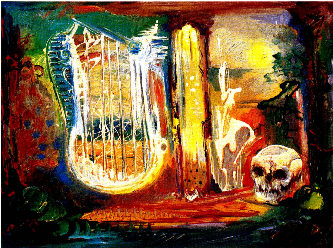
«Die Toten sterben nicht». Allegorisches Oelbild, 1975.