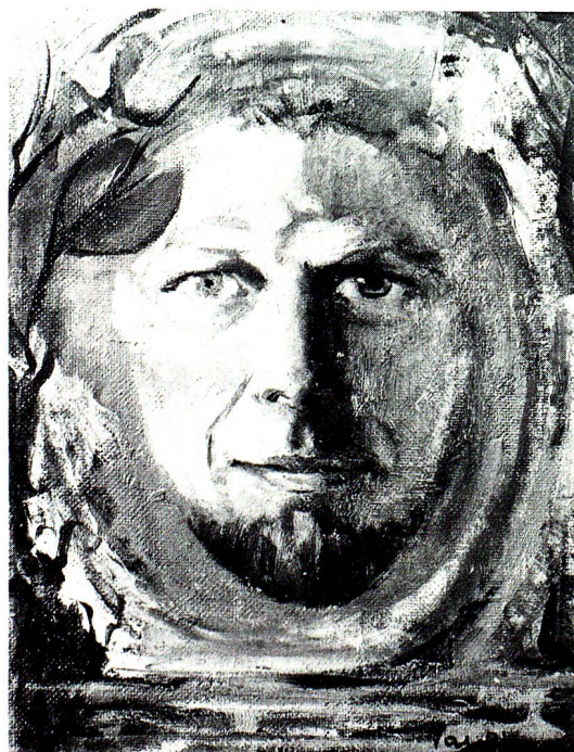
Selbstportrait in Zürich. Oel, 1961.