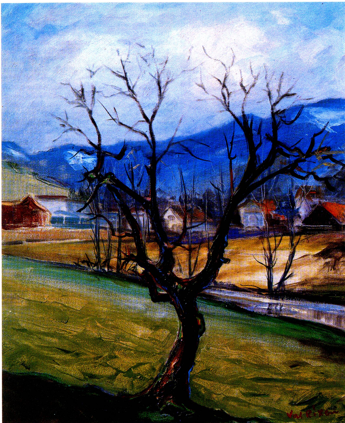
Herbststimmung am Necker bei Brunnadern. Oel, 1978.

besuchte nebenbei die Kunstgewerbeschule. Vom Militär war ich wegen meines kleinen Wuchses dispensiert.