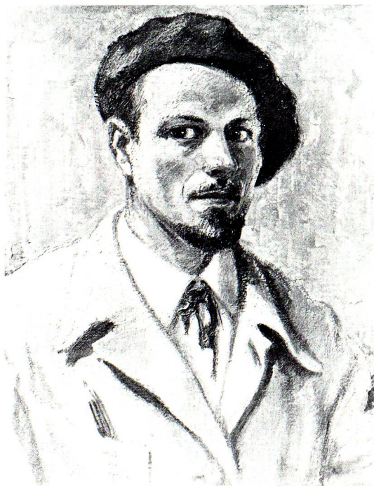
Selbstportrait in Zürich. Oel, 1950.