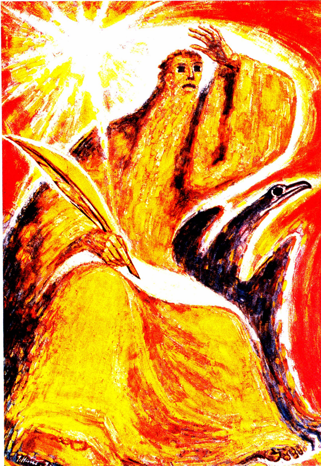
Apokalypse: Johannes der Seher, Oel auf Holz, 1973, 84 x 121 cm.