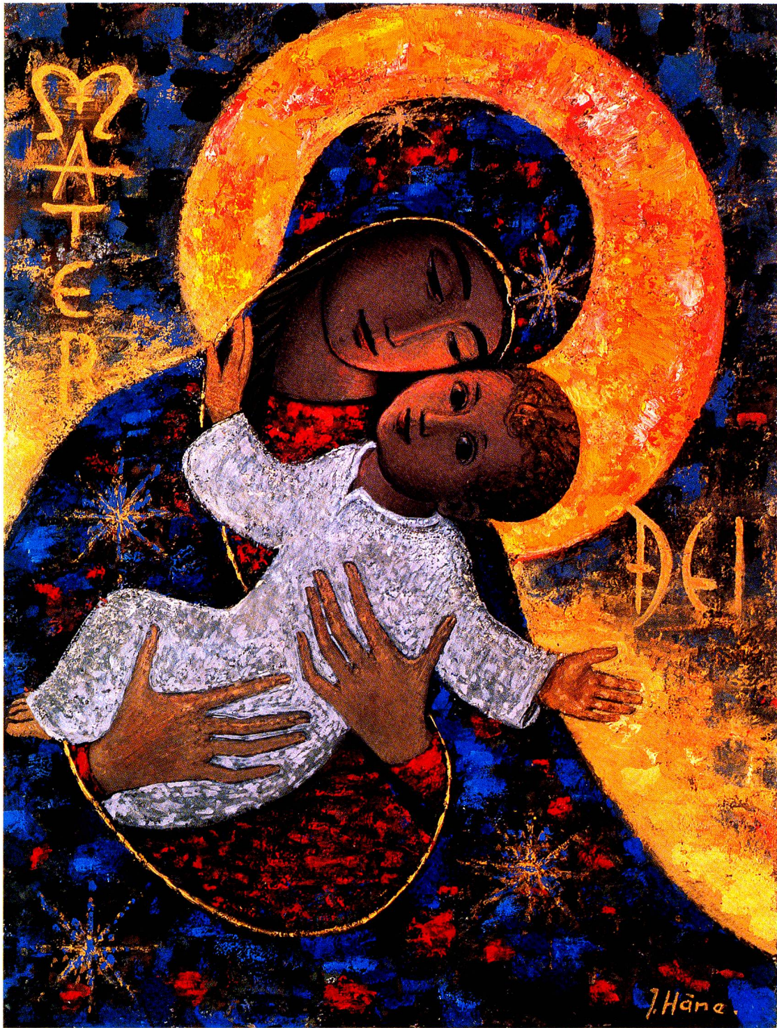
Madonna, Oel auf Hartfaserplatte, undatiert, 38 x 50 cm.

er fortan als lichtdurchflutetes Atelier benützte. Immer zahlreichere Aufträge trafen bei ihm ein: 1942 für Glasfenster des Seminars La Salette in Fribourg, 1943 für die Bilder des Hochaltars und der Seitenaltäre sowie der Taufkapelle der katholischen Pfarrkirche St. Michael in Ebnat-Kappel, für ein Fresco im Priesterheim Weesen, 1944 für weitere Wandmalereien im Iddaheim Lütisburg, 1945 für die Ausmalung einer Hauskapelle in Henau und für ein «Christophorus-Sgraf-