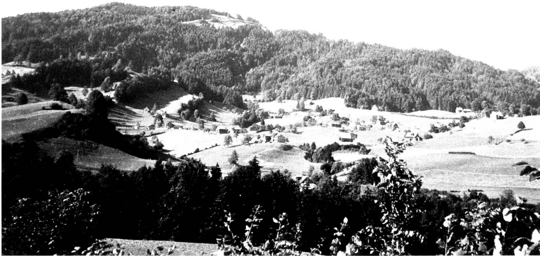
Ansicht zum Tanzboden