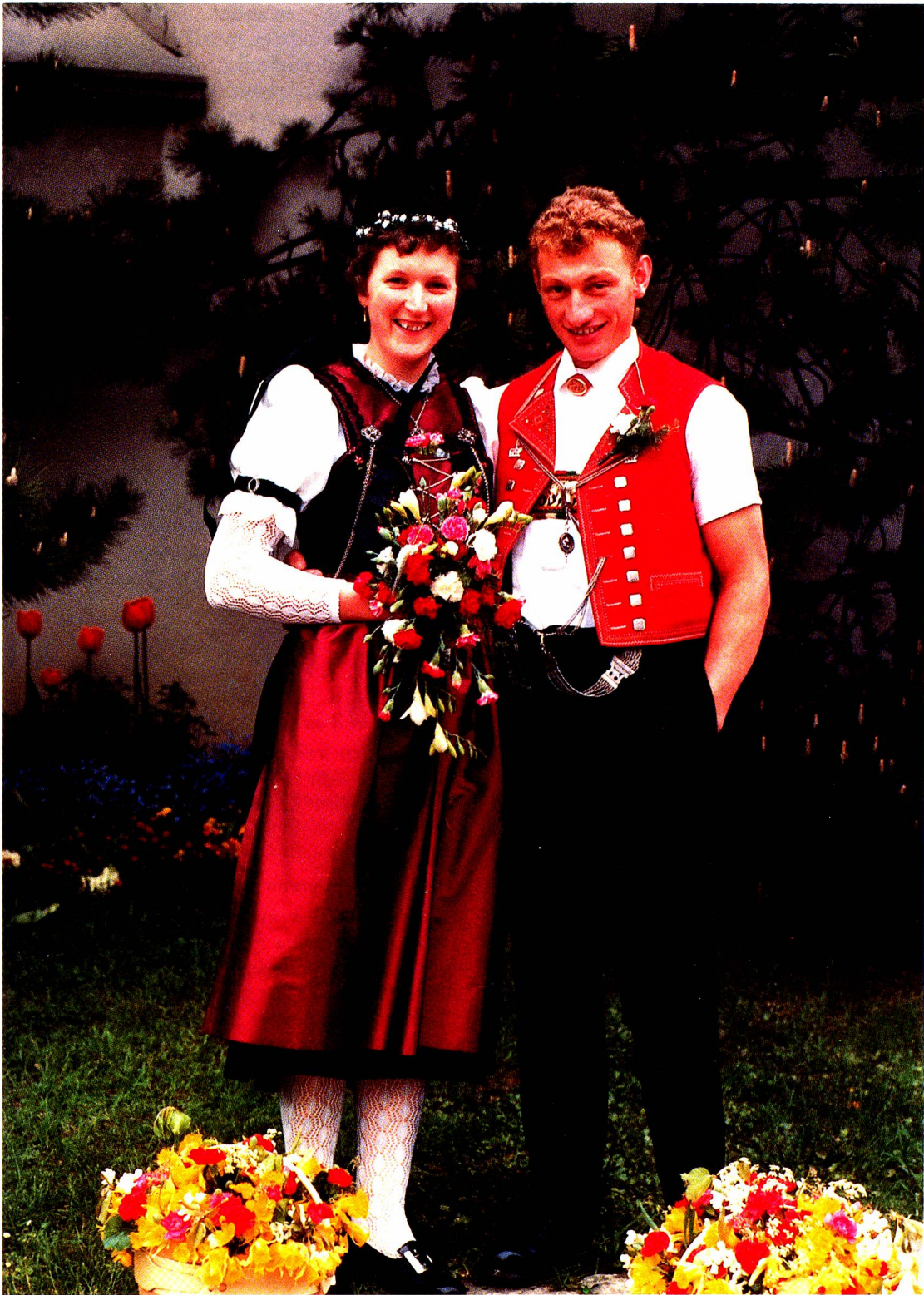
Toggenburger Hochzeitspaar