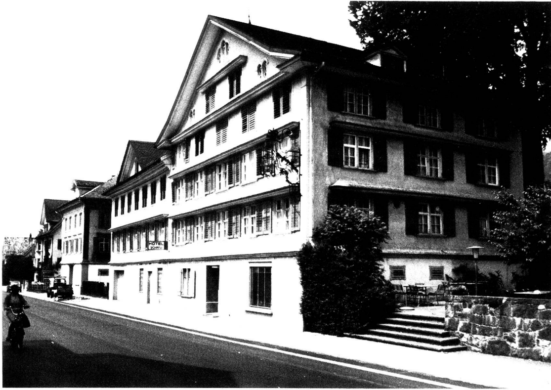
Neu St. Johann, Gasthaus «Schäfli», Haupt- und Nebengebäude, um- oder neugebaut im mittleren 19. Jahrhundert.

Zu Bekräftigung dessen Wir Ihme dann gegenwärtigen Concessionsschein mit unserm Abbatial Secret-Insigil Corroborierten zu stellen lassen, so beschehen, Stüfft St. Gallen den 17.ten January 1776.