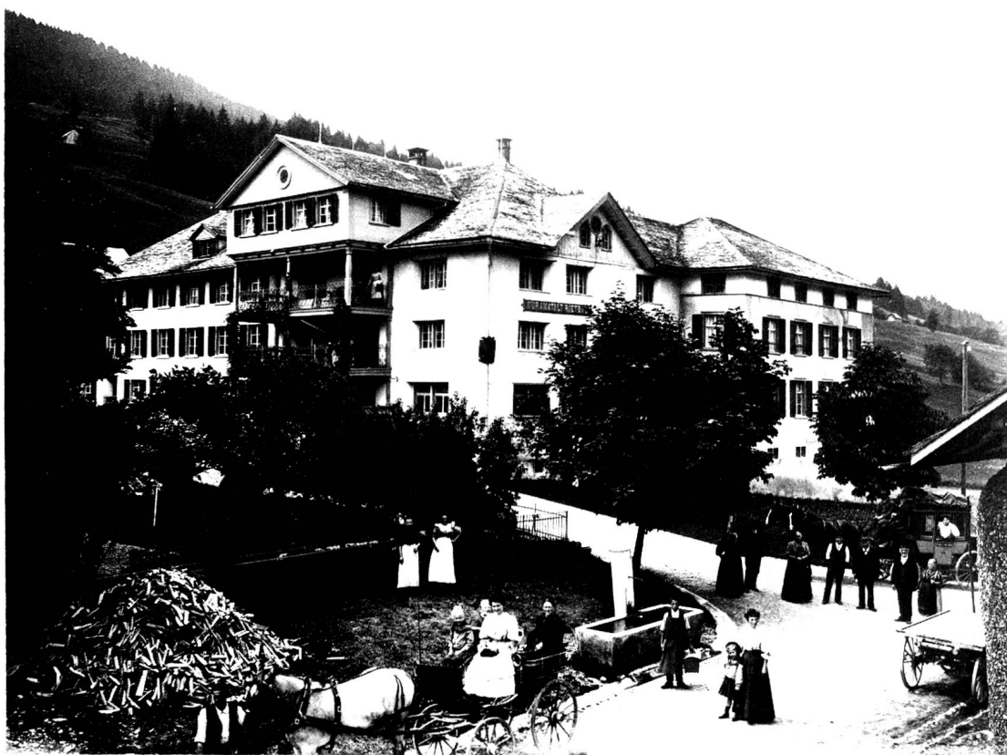
Ennetbühl, Badhotel «Rietbad» um 1900.