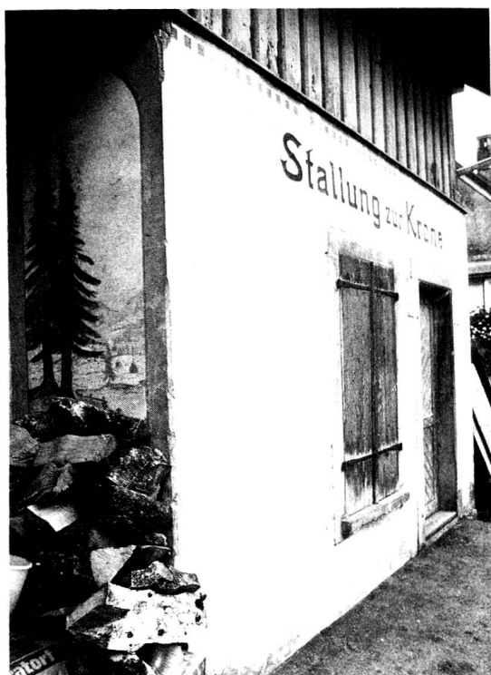
Ennetbühl, Stallung der «Krone».

faches Giebelhaus erkennen. Seither ist ihm zur Kirche hin ein Saalanbau erwachsen, und der Dachvorsprung und der Quergiebel über dem Eingang tragen Zierrat aus der Jahrhun-