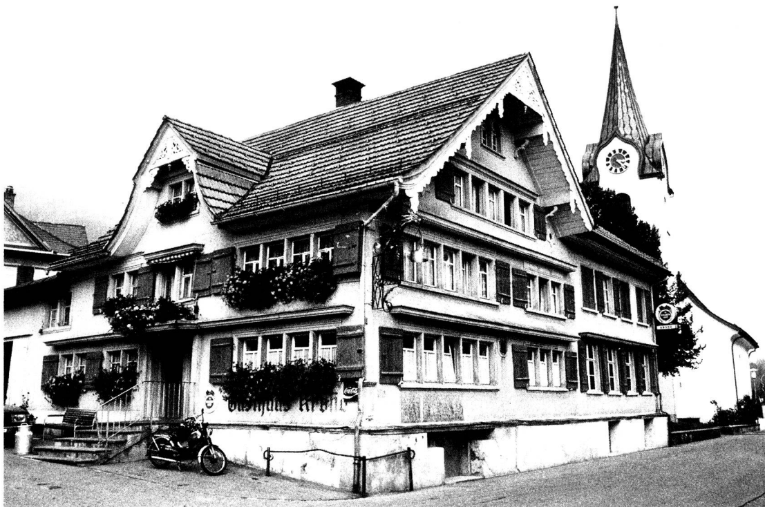
Ennetbühl, Gasthaus «Krone» und ref. Kirche.

Zentraler als Kirche und Pfarrhaus, direkt an der Kreuzung im Dörfchen, präsentiert sich die «Krone». In der einzigen alten innerörtlichen Darstellung von Johann Baptist Isenring um 1830 kann man den Gasthof als ein-