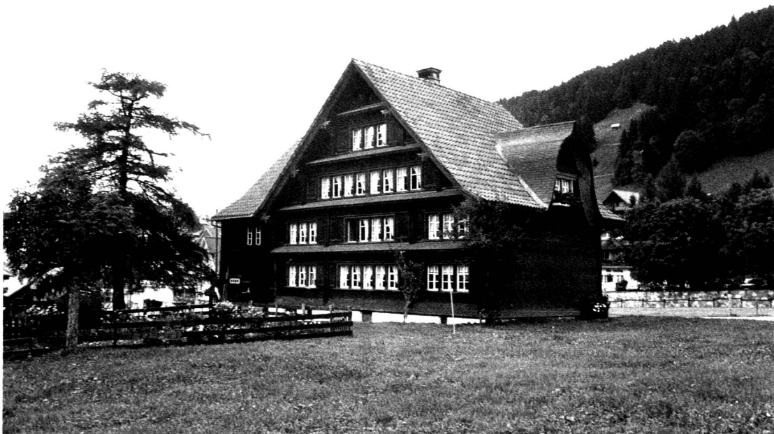
Wildhaus, ehemalige Taverne «Löwen» oder «Tanzhaus».

Sorgfältig gehütet werden zwei hölzerne Wirtshausschilder «All hier zum Löwen». Das ältere datiert von 1781. Es zeigt rechts oben das gevierte Wappen, des damaligen Landesherrn, des Abtes Beda Angehrn. Das jüngere Wirtshausschild von 1808 kommt