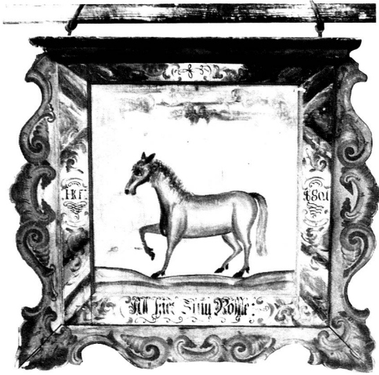
Wildhaus, «Rössli», Wirtshausschild von 1801.