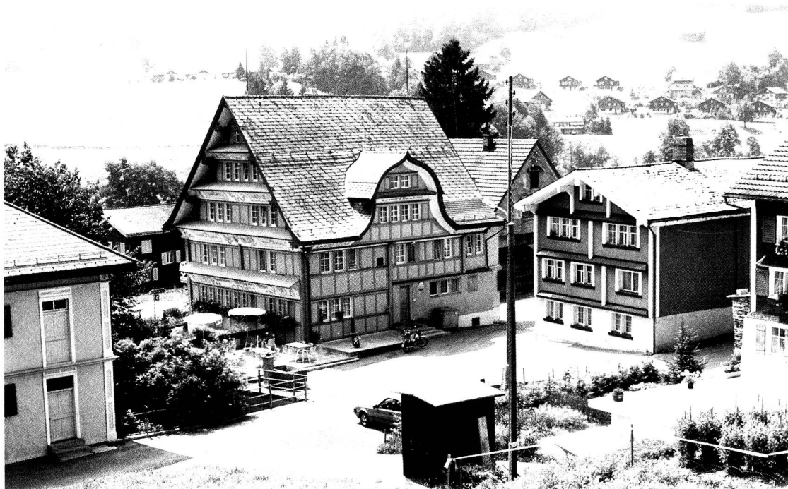
Krummenau, Gasthaus «Adler» am Dorfplatz.

das Gebäude mit einem schmalen Barockgiebel zum Tal und einem weiter ausladenden Pendant zum Dorfplatz hin den Reisenden.