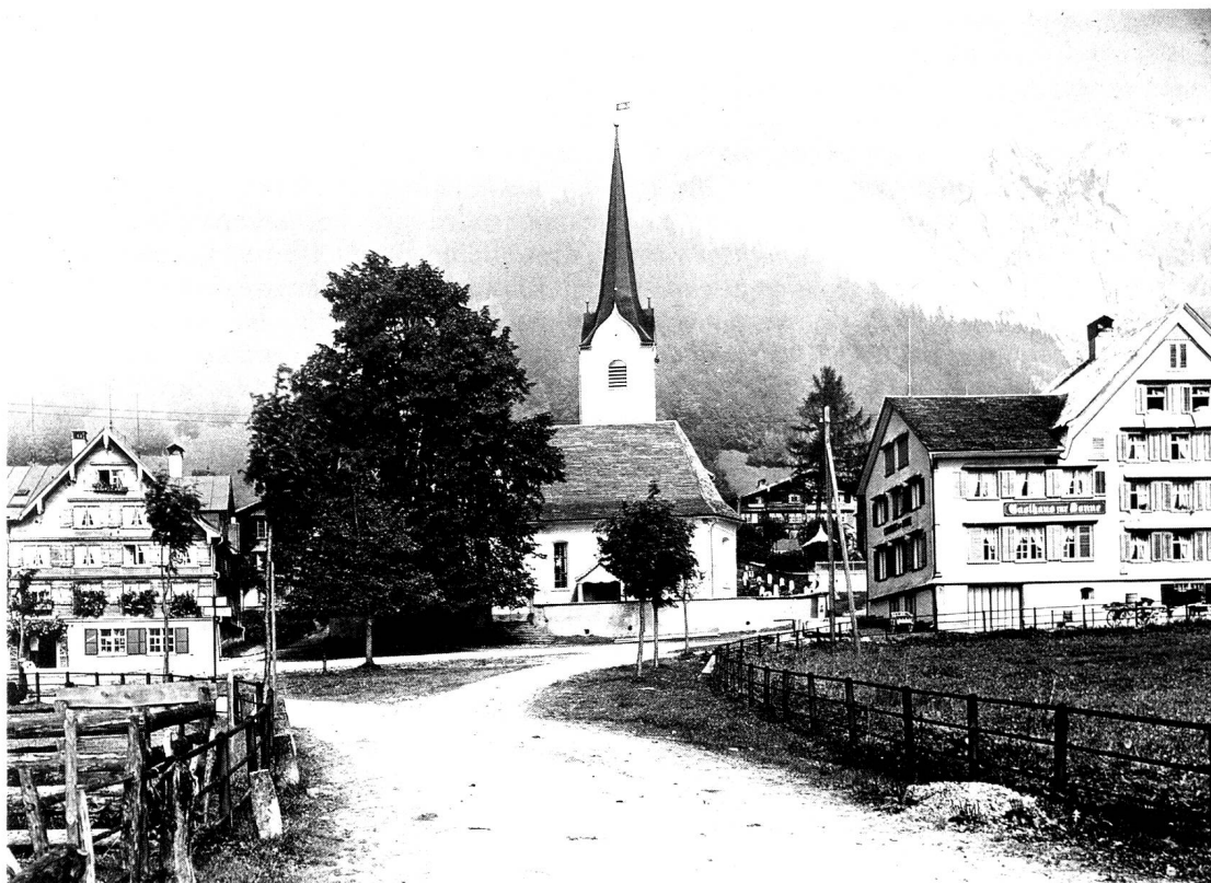
Wildhaus, Kirchplatz um 1900. Links Gasthaus «Hirschen», rechts «Sonne».

Trotzdem sei im folgenden versucht, einiges wenigens über die Verhältnisse am Ende des Ancien Régime, genauer gesagt zu Beginn des neuen Kantons St.Gallen, mitzuteilen. Dazu sind wir deshalb in der Lage, weil eine Quelle von 1804 uns genau darüber Auskunft gibt und so einen Überblick über die tatsächlichen Verhältnisse im Kanton St.Gallen erlaubt.