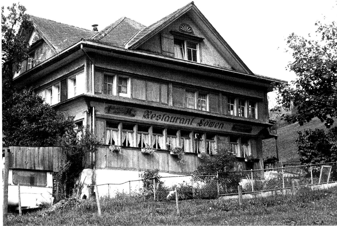
Stein, Restaurant «Löwen», erbaut Anfang 19. Jahrhundert.