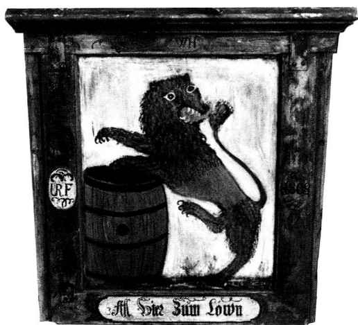
Wildhaus, ehemalige Taverne «Löwen». Wirtshausbilder 1781 und 1808.