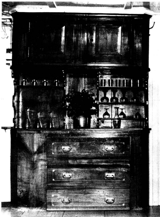
Stubenbuffet, anfangs 19. Jahrhundert, als Schmuckstück in der heutigen Wirtschaft.