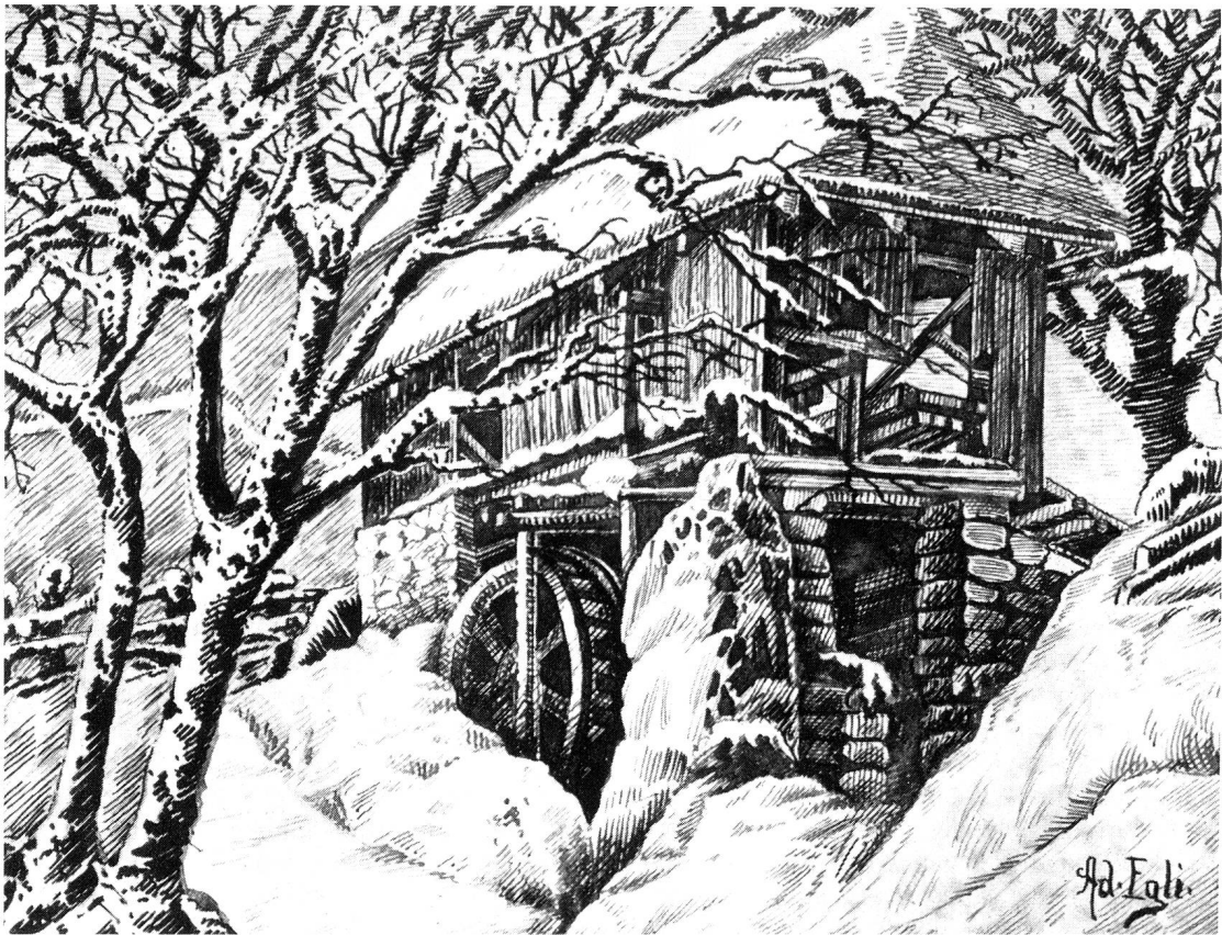
Die Säge in Winklen, Zeichnung von Adolf Egli, 1875–1952, Oberuzwil. Aus «Toggenburger Heimat-Jahrbuch» 1950, Seite 123.

sicht so aufschlussreich, dass er verdient, hier zum grössten Teil wörtlich wiedergegeben zu werden: 11) )