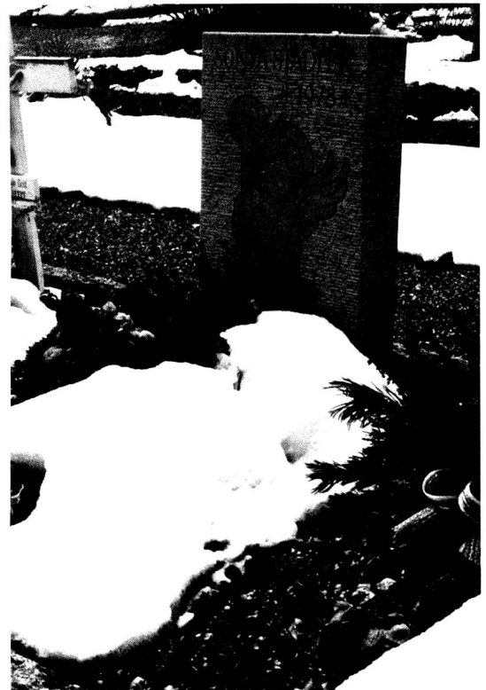
Engeldarstellungen auf Kindergräbern