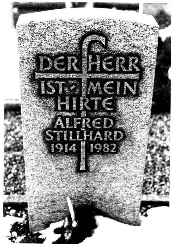
Eine vertraute Inschrift: «Der gute Hirt»

handlung in Geistesverwirrung, starb in Fesseln. Obgleich der Seelsorger gewarnt hatte, war von der zuständigen Behörde nichts geschehen. – Notwendigkeit der Asyle!