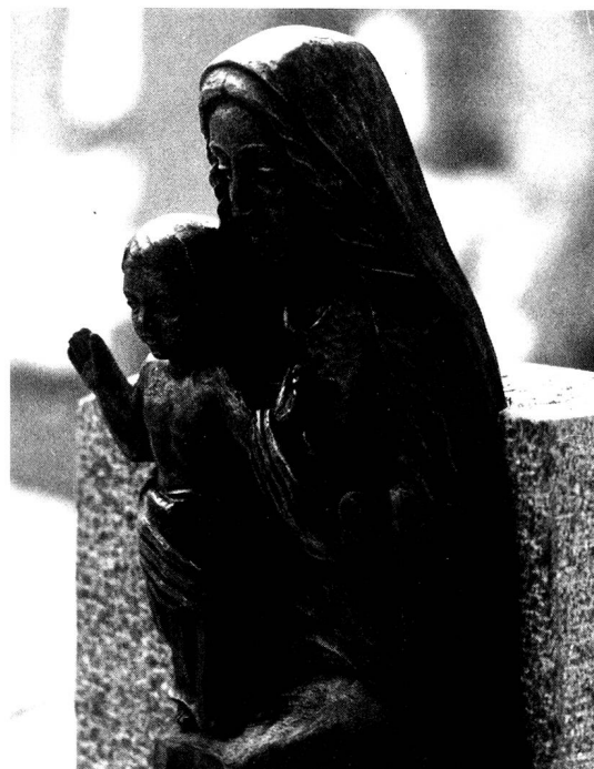
Die Madonna auf dem Friedhof

«Der Herr wird mich auferwecken zum ewigen Leben.»