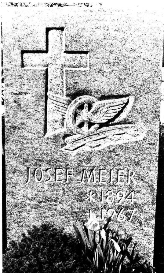
Hier ruht ein Spetter

Die Menschen aller Zeiten und Kulturen haben sich mit dem Sterben auseinandergesetzt. Sie haben sich gefragt, in welchem Verhältnis die Lebenden zu jenen stehen, die ihnen vorausgegangen sind. Sie haben Bin-