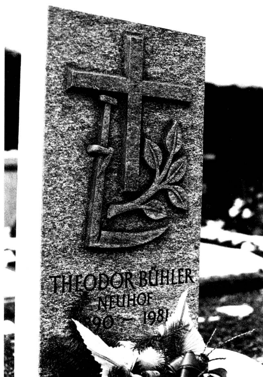
Darstellungen aus dem bäuerlichen Leben