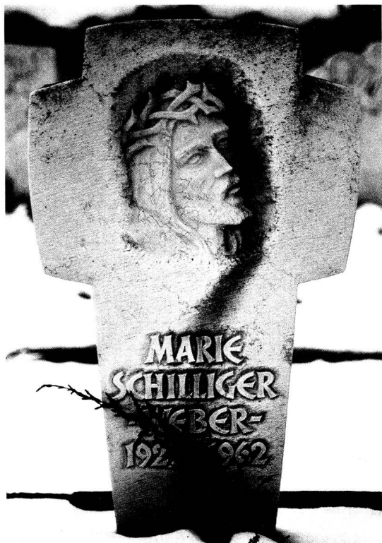
Christus mit der Dornenkrone

Hier, in der geweihten Erde neben der Kirche träumt man keine Träume mehr. Man stirbt im Sommer und Winter, im Frühling und Herbst – und nimmt alle Geheimnisse mit. Keine Briefe werden mehr geschrieben, keine Geschäfte mehr abgeschlossen. Die Zahlen