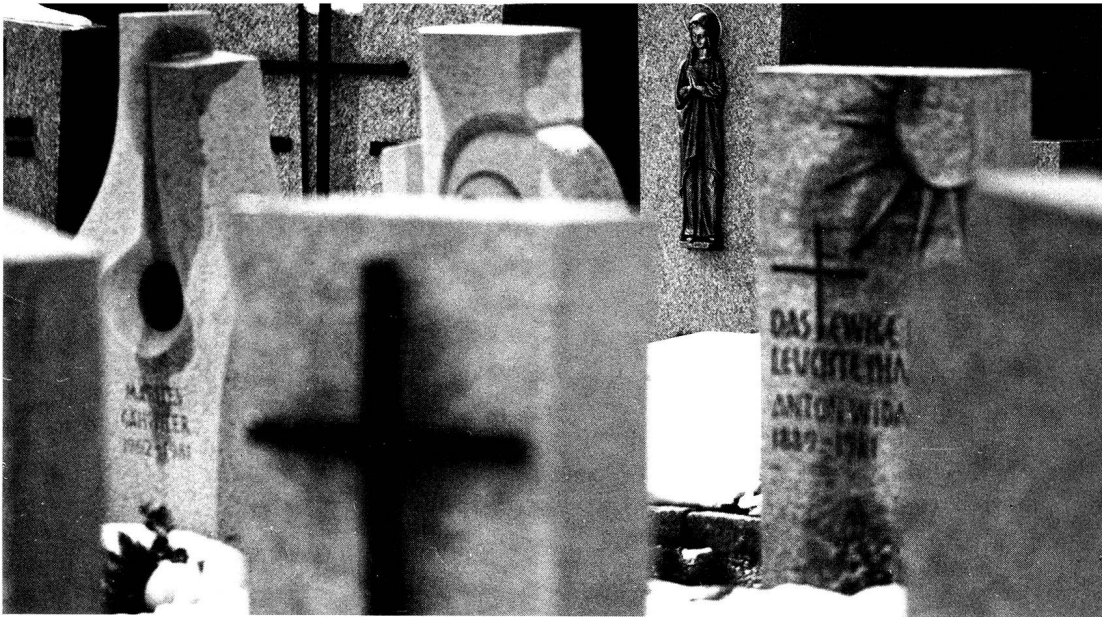
Friedlich schlafen hier Seite an Seite, die Stand und Leben trennte.