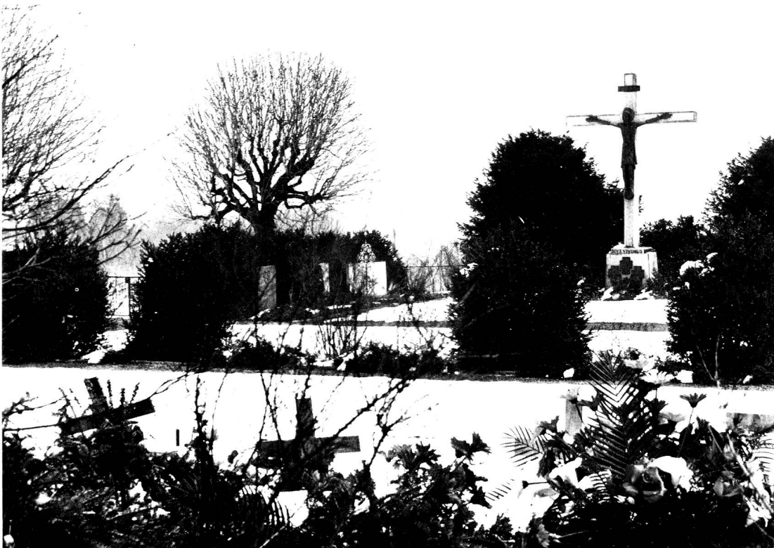
Unübersehbar, das Kreuz

Da und dort findet man auf Grabsteinen auch Tier-Darstellungen. Der Hirsch ist ein Bild der Seele, die nach dem lebendigen Gott wie ein Hirsch nach frischem Wasser dürstet. Auch der biblische gute Hirt, der die Lämmer weidet und sich des verlorenen Schafes erbarmt, ist verbreitet. Andere bekannte Christus-Symbole sind der Fisch, der Pelikan, der Phönix und andere. Von hohem Sinngehalt sind auch folgende Zeichen: der Leuchter, der das Licht des Lebens in die Nacht des Todes trägt; der Anker, ein Sinnbild des Glaubens, der festen Grund gefunden, ferner das