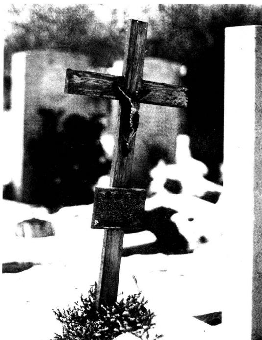
Das einsame Holzkreuz