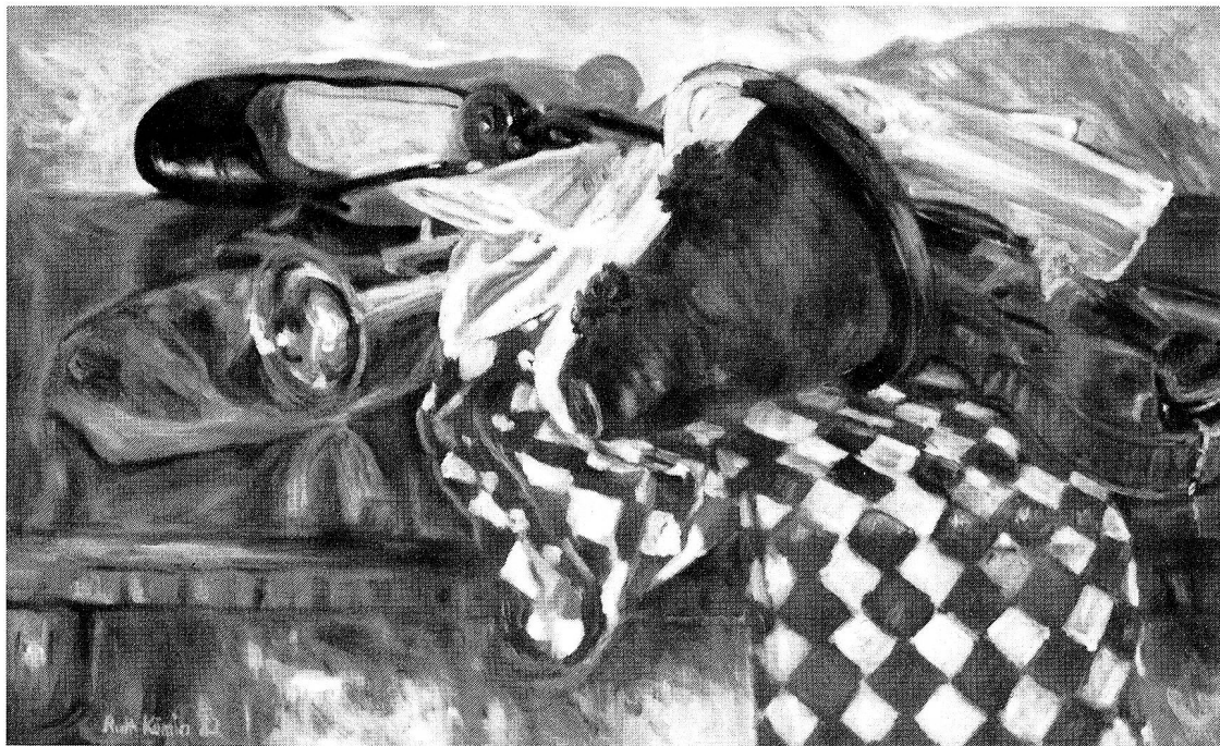
Fasnacht. Oel, 70x45 cm. 1982.

«rationalen» Tätigkeit gibt es Überraschungen und Umwege, die einen Freiraum bieten für Kreativität, für irrationales, eben für Künstlerisches. Gewiss ist nur, dass dahinter ein ernsthaftes Streben steckt, das die Kirchberger Künstlerin immer wieder anspornen wird, sich zu neuen Ufern vorzuwagen.