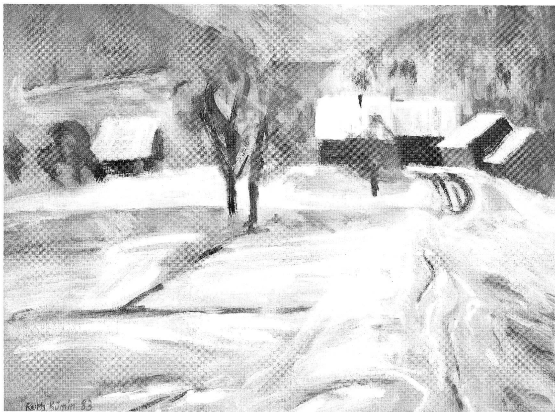
Tiefprüti, Gemeinde Kirchberg. Oel, 54x43 cm. 1983. Privatbesitz.

Überschaut man das Werk von Ruth Kümin, stossen zwei Motive ins Auge, die beide zu den klassischen Themen der bildenen Kunst gehören: zum einen ist es die menschliche Figur, zum anderen die Landschaft. In allen Epochen haben sich Künstler mit dem Menschen auseinandergesetzt. Das Thema reicht von kultischen Darstellungen aus prähistorischer Zeit, mittelalterlichen Heiligenbildern, Selbstporträts seit dem 15. Jahrhundert bis zu den auf den Kopf gestellten Menschen eines