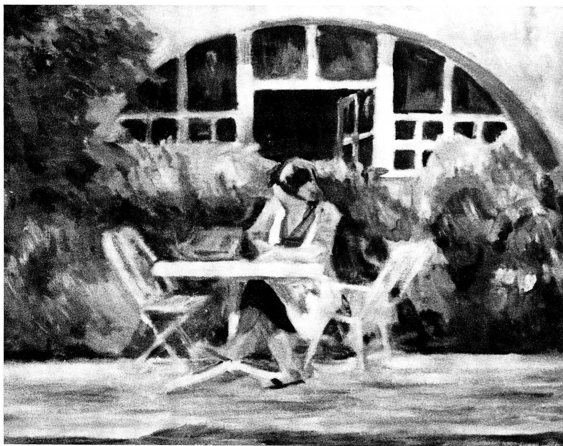
Im Garten. Oel, 50x40 cm. 1982. Privatbesitz.