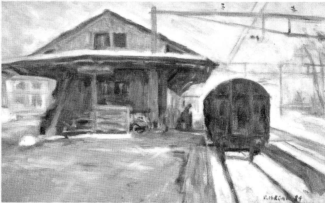
Bahnhof Ebnet-Kappel. Oel, 49x32 cm. 1984. Privatbesitz.