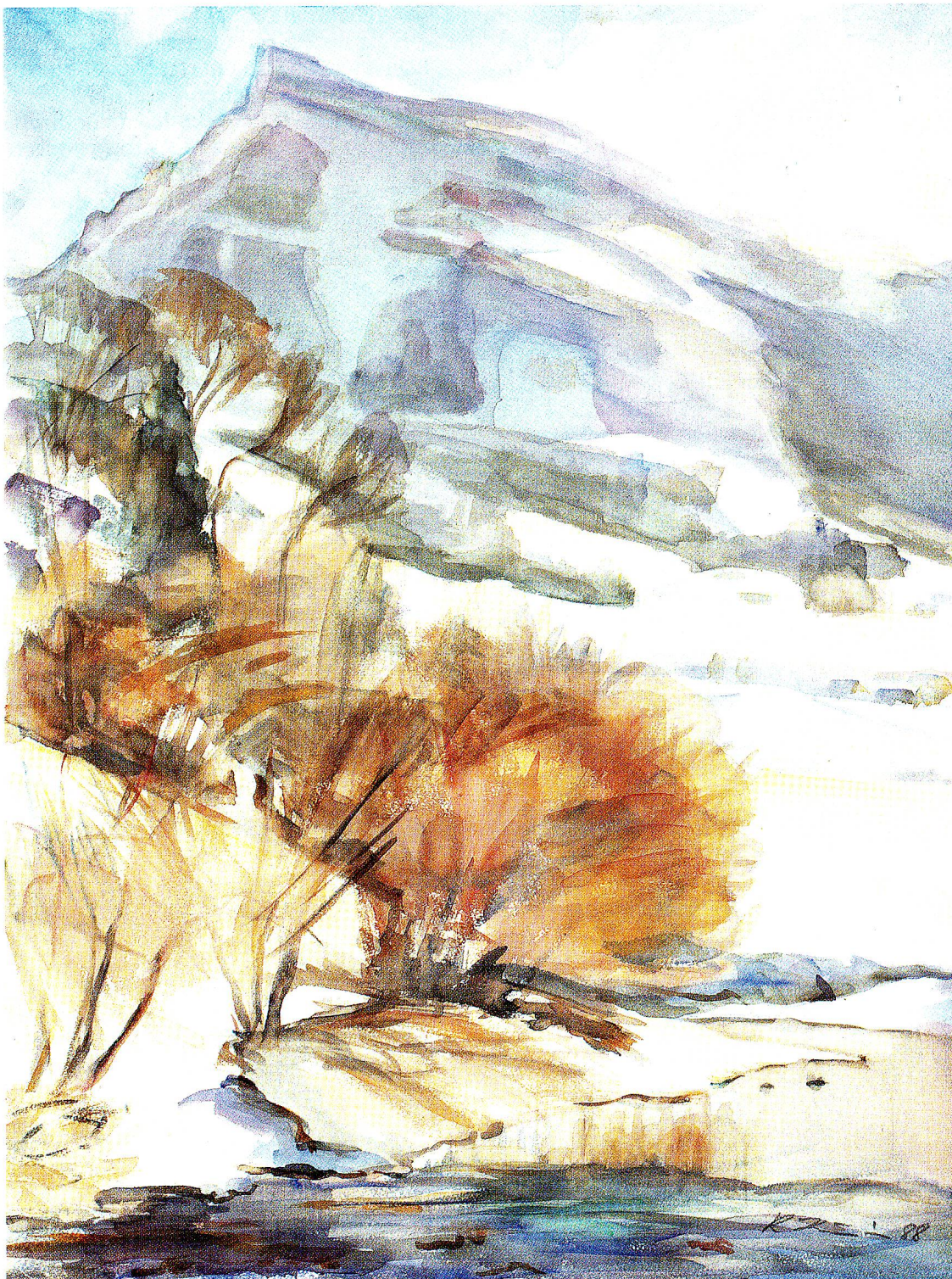
Die vier Farbbilder in unserem Beitrag zum Werk der Kirchberger Künstlerin Ruth Kümin zeigen Ausschnitte aus dem ungefähr 50 Aquarelle umfassenden Zyklus «Thurlandschaften». 1988.