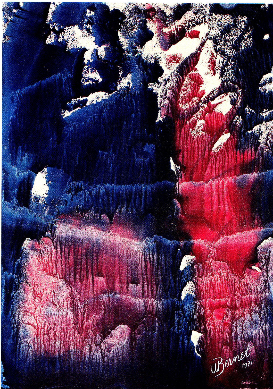
Wasserfälle im nächtlichen Farbenlicht, Monotypie, 35x50 cm, 1971.

Gouachetechnik auf Glas, mit seinen über Papier und Klatsch weiterentwickelten komplexen Umsetzungen – vier Arbeitsphasen – bis zur Mono-Lithographie, die ihm, endlich «auf den Stein gekommen», erlaubt, auch kleine Serien herzustellen, nachdem die eigentliche Monotypie immer ein Unikat blieb. Aber, so glaube ich, es war nicht einmal Berners Hunger nach der Serie, die ihn