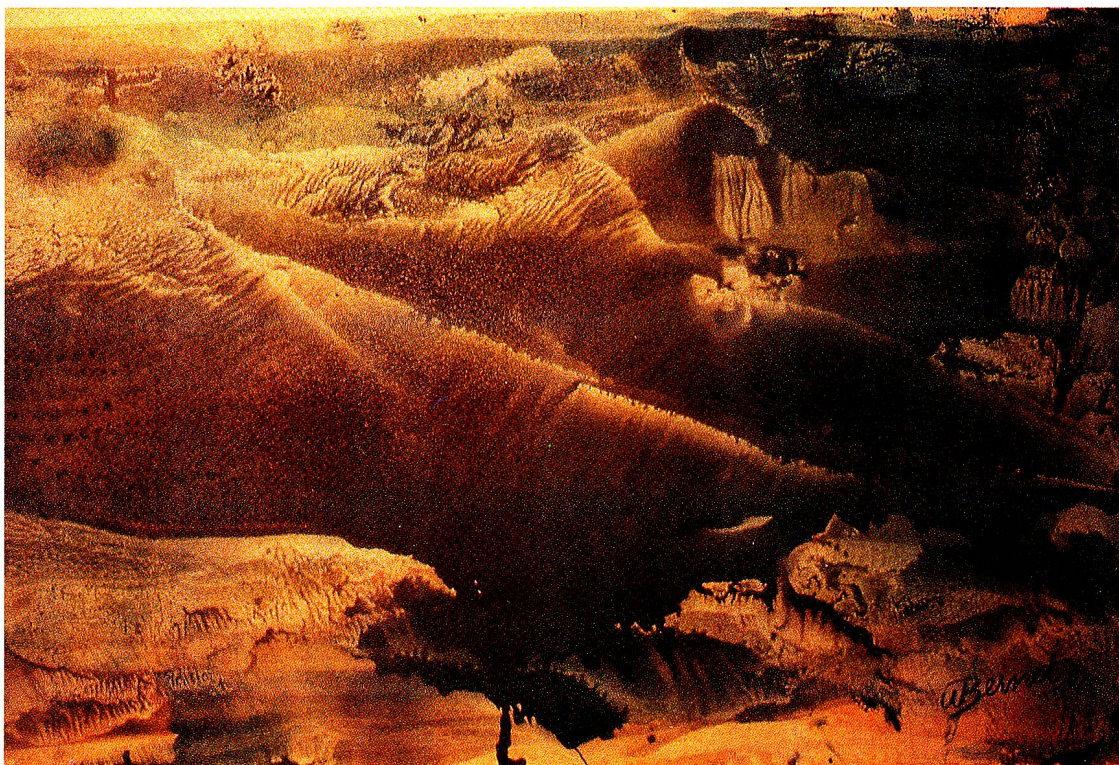
Wunder der Natur, Monotypie, 70x50 cm, 1975.

Jahr Welschlandaufenthalt in Neuchâtel zur Perfektionierung der französischen Sprache. Im Frühjahr 1950 Bestehung der Eignungsprüfung zum Typographen und anschliessend Eintritt in die Berufslehre als Schriftsetzer in die Buchdruckerei der Wiler Zeitung in Wil. Während der vierjährigen Ausbildung Besuch der Graphischen Fachschule in St.Gallen. Nach erfolgreicher Bestehung der Berufsabschlussprüfung begann seine Berufslaufbahn als Typograph in Zürich. Nebst der neuen Berufserfahrung besuchte er die Kunstgewerbeschule der Stadt Zürich in den Fächern Zeichnen, Typographie und Grafik. In namhaften Druckereien Zürichs anvertraute man ihm den Posten als typographischer Gestalter und als Lehrlingsausbildner. Im Jahre 1955 verheiratete er sich mit einer gebürtigen Friaulerin. Aus seiner Ehe spro-