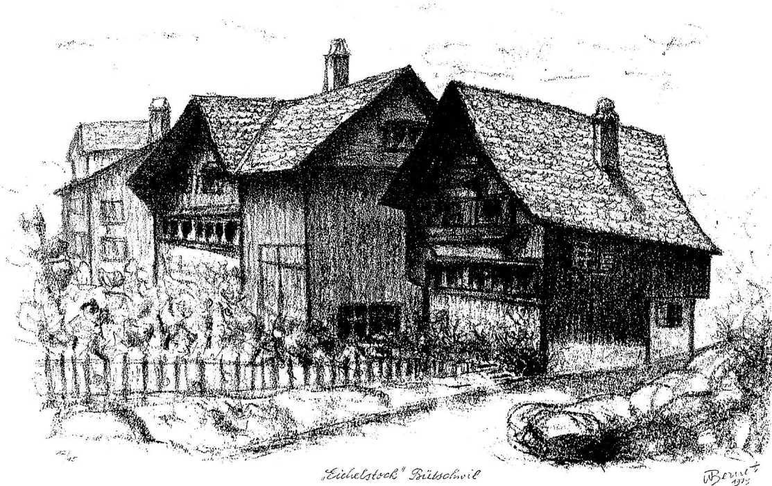
Ortsmuseum Eichelstock in Bütschwil, Kreidelithographie auf Stein, 50x35 cm, 1979.