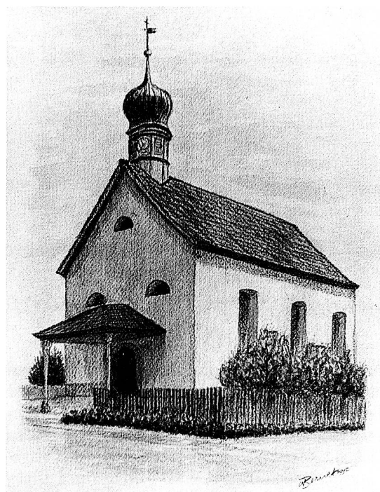
St. Laurentius-Kapelle in Unterbazenheid, Kreide und Aquarell, 50x70 cm, 1992.

«Meine Monotypien unterscheiden sich von den beschriebenen darin, dass ich dazu Gouachefarben verwende und diese auf der Glasplatte vermische, oder auch die von mir bestimmten Grundfarben in verschiedenen