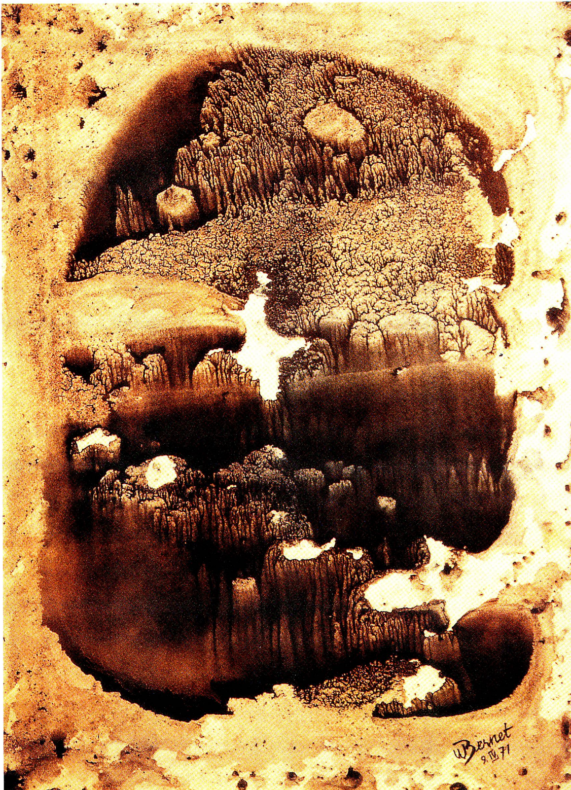
Höhlensee mit Tuffstein (Eindrücke in den Grotten von Toirano, Ligurien), Monotypie, 35 x 50 cm, 1971.

Arbeitsgängen auf die Glasplatte male und dann auf das Papier übertrage. Durch letztere Technik erreiche ich optimale Reinheit, Leuchtkraft und Tiefenwirkung der Farben. Dabei spielen meine aufeinander abgestimmten Grundfarben Gelb, Rot und Blau, die Konsistenz der Farben, das geeignete Papier sowie die schöpferische Stimmung eine entscheidende Rolle.