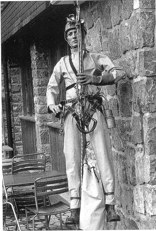
Bei heutigen «Höhlenbewohnern» – demonstriert an einer Puppe – ersetzt viel bergmännisches Rüstzeug das einstige Bärenfell.

Seilwinden, Leitern und so manches Zubehör wird zum Teil selber hergestellt, um den Höhlengeheimnissen auf die Spur zu kommen. So wurde im Kalttal festgestellt, dass in 300 Metern Tiefe eine Schicht besteht, die zwar wasserdurchlässig, aber für Menschen unüberwindlich ist. Solche Rückschläge hinderten die Höhlenforscher indes nicht, ihre Entdeckungen mit Kompass, Neigungsmesser und Messband zu erfassen und zu kartographieren. Bei der Köbelishöhle gelang es, bis in 550 Meter Tiefe vorzudringen, damals eine der tiefsten