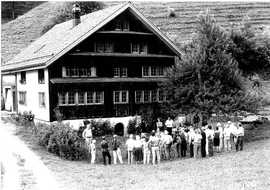
Das stattliche, flach geneigt bedachte Bürgerhaus von 1687 auf dem Krinäuli ist Zeuge eines frühen Handelsverkehrs über die Krinne, aber auch Vorläufer der Krinauer Schul- und Industriegeschichte.

Wohnhaus Kliebens, Krinäuli, öffnete seine Türen vom einstigen Käsekeller bis hinauf zur Firstkammer. Rokkokoalerei-Fragmente im oberen Gang und die geräumigen Stuben zeugen vom hablichen Bauherrn des 1687 datierten Gebäudes. Um 1724, zur Zeit des Kirchenbaues, war ein Christian Blatter der gewichtigste Geldgeber. Aus den Tagebüchern des Landrates Fridolin Anton Grob von Spilhusen (vis-à-vis Lütisburg) erfahren wir, dass er, schon 20jährig, beim «Zittlemacher Christian Platter auf dem Krinäuli in 2 mal 2 und 3 Tagen die 5 Species ohne und mit Bruch, die Heü-Rechnung und die Würfel aus Quadrat und Cubic» (also Grundbegriffe der Geometrie) erlernte. Von Blatter stammte 1764 die erste Turmuhr der Kirche Brunnadern. Aus anderen Quellen ist ersichtlich, dass von zwei Söhnen, Josef und Heinrich, der ältere es bis zum Hofuhrmacher in Berlin brachte, der jüngere ein universaler Mechanikus wurde, der Elektrisier- und Rechenmaschinen konstruierte, besonders leistungsfähige Feuerspritzen baute und bei der Einrichtung der ersten mechanischen Baumwollfabriken in der Schweiz leitend beteiligt war. Dass dieses Gebäude in Zeiten vor dem motorisierten Verkehr nicht so abgeschieden dastand wie es heute scheint, lässt sich erahnen, wenn man der Krinne und den entsprechenden Oertlichkeiten: Krinau – Krinäuli – Mosnang – Krinnberg weiter gegen