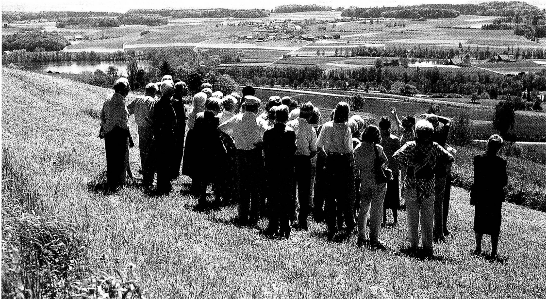
Ausblick von der Seitenmoräne des Stammheimertales auf das einzigartige Zungenbecken mit den drei lieblichen Seen.

Zwischenlager. Mehrere Töpferöfen im Umkreis zeugen von damals florierendem Handwerk. Erst mit der Rückverlegung des Limes an den Rhein entstanden auf der Höhe des heutigen Stein am Rhein, anfänglich aus Holz, in der Endphase gemauerte befestigte Brückenköpfe und zwischen ihnen wohl bereits eine steinerne Brücke, die nun in einem Zug den Fluss querte. Im 7. Jahrhundert errichtete eine germanische Adelsfamilie über den linksrheinischen Ruinen als Grabbau eine monumentale Apsiskirche. Mit dem Aufschwung des Fernhandels seit dem 12. Jahrhundert hat sich die Siedlungskonzentration auf dem rechtsrheinischen Brückenkopf zum Städtchen Stein am Rhein verdichtet. 1457 erhielt es die Reichsfreiheit, 1484 erfolgte die Ablösung von Oesterreich und der Anschluss an Zürich. Mit grossem Engagement beteiligte es sich am Bau der Nationalbahn. Nach deren Konkurs 1878, sowie der Pleite seiner Sparkasse 1919, trug die Stadt jahrzehntelang an der Schuldenlast. Als grössere historische Fabrikanlage entstand ausserhalb der Stadt aus der einstigen Mühle eine Nudelfabrik, deren Räume später die Schuhfabrik Henke in Anspruch nahm. Im Zentrum des rautenförmigen linksrheinischen Kastells erhebt sich heute als Nachfolgebau der Apsiskirche die St.Johannes-Kirche, deren Chorraum einen einzigartigen mittelalterlichen Freskenzyklus u.a. aus dem Leben Jesu säumt. Gestiftet wurden die Bildgeschichten 1420