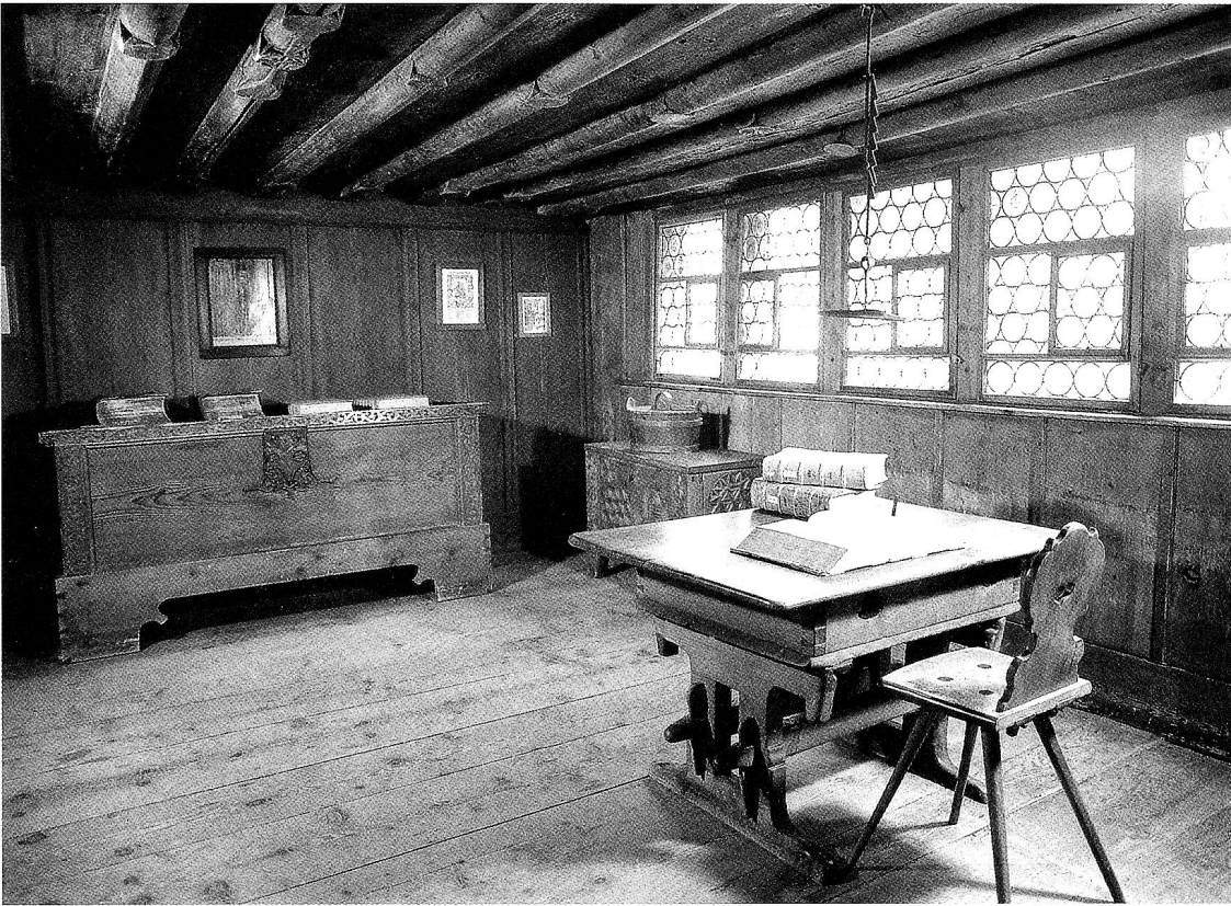
Die Stube des Geburtshauses von Zwingli mit den Folianten von Zwinglis lateinischen Schriften, eine der Kostbarkeiten der Lesegesellschaft.