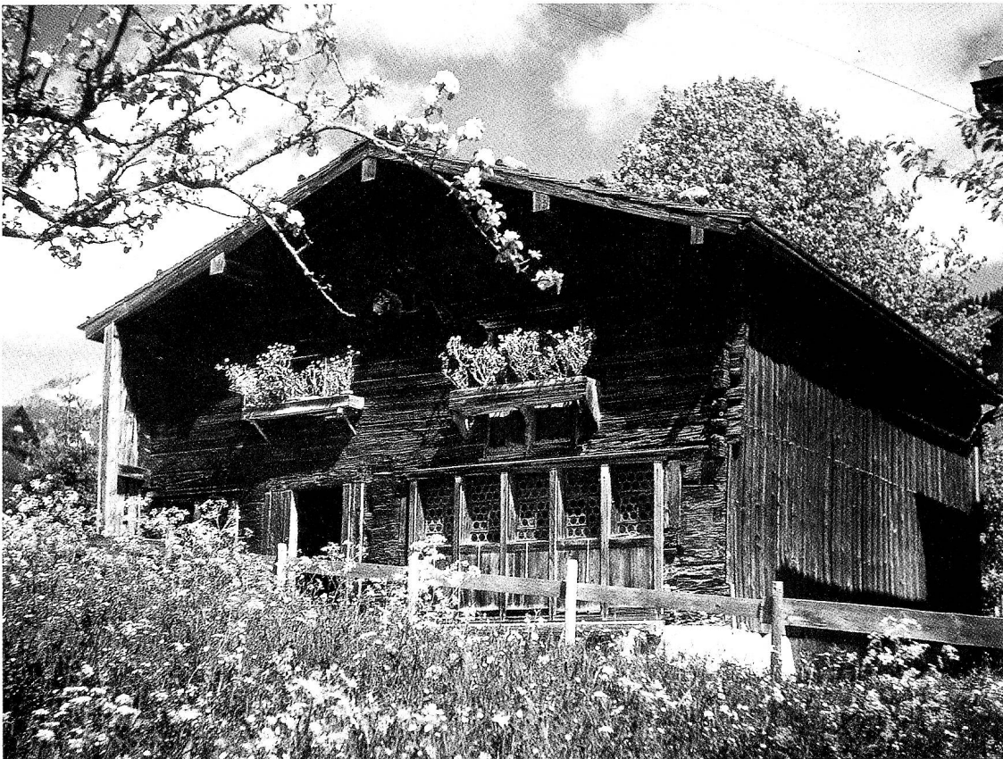
Im Zwingli-Geburtshaus fand am 16. November 1823 die Gründungsversammlung der Lesegesellschaft statt.