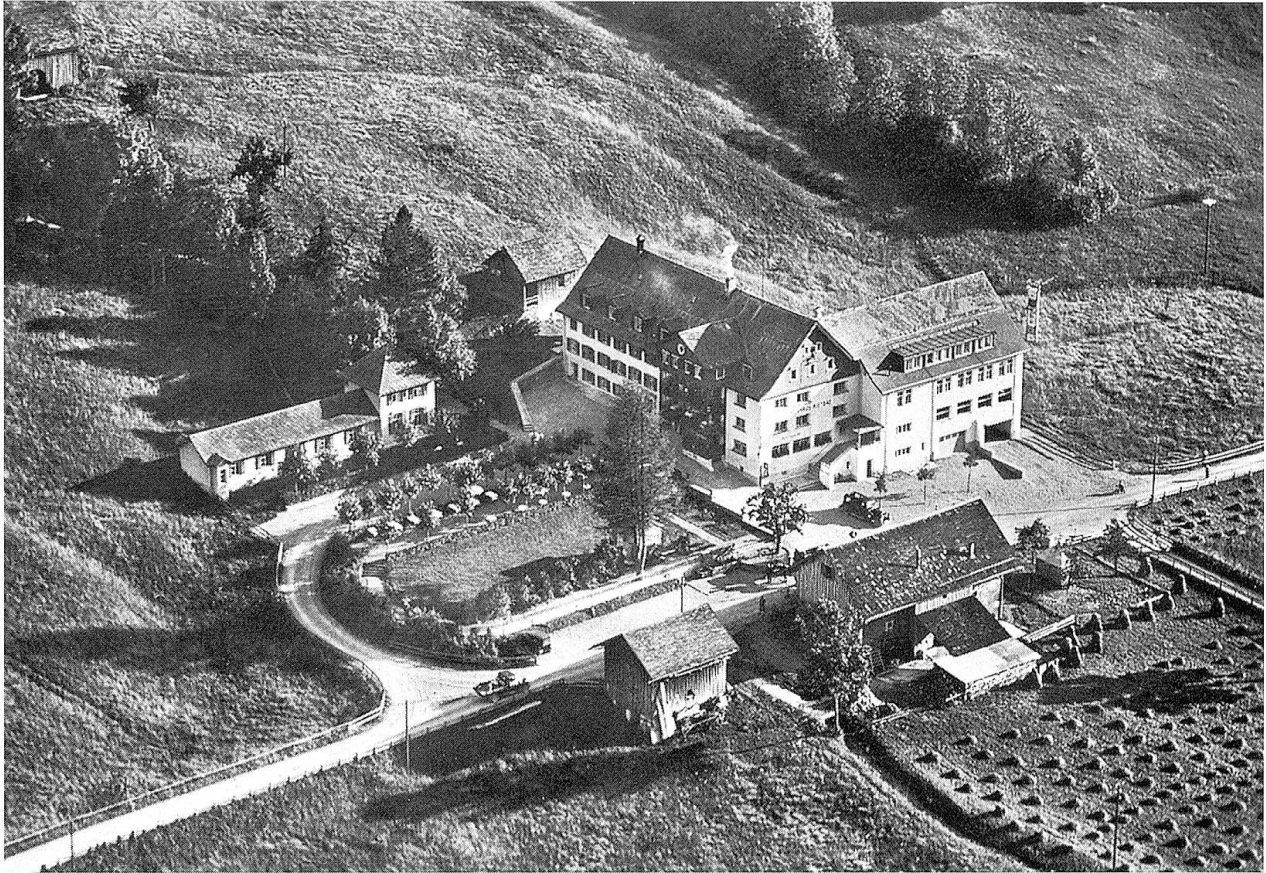
Luftaufnahme des Rietbades, 1935.