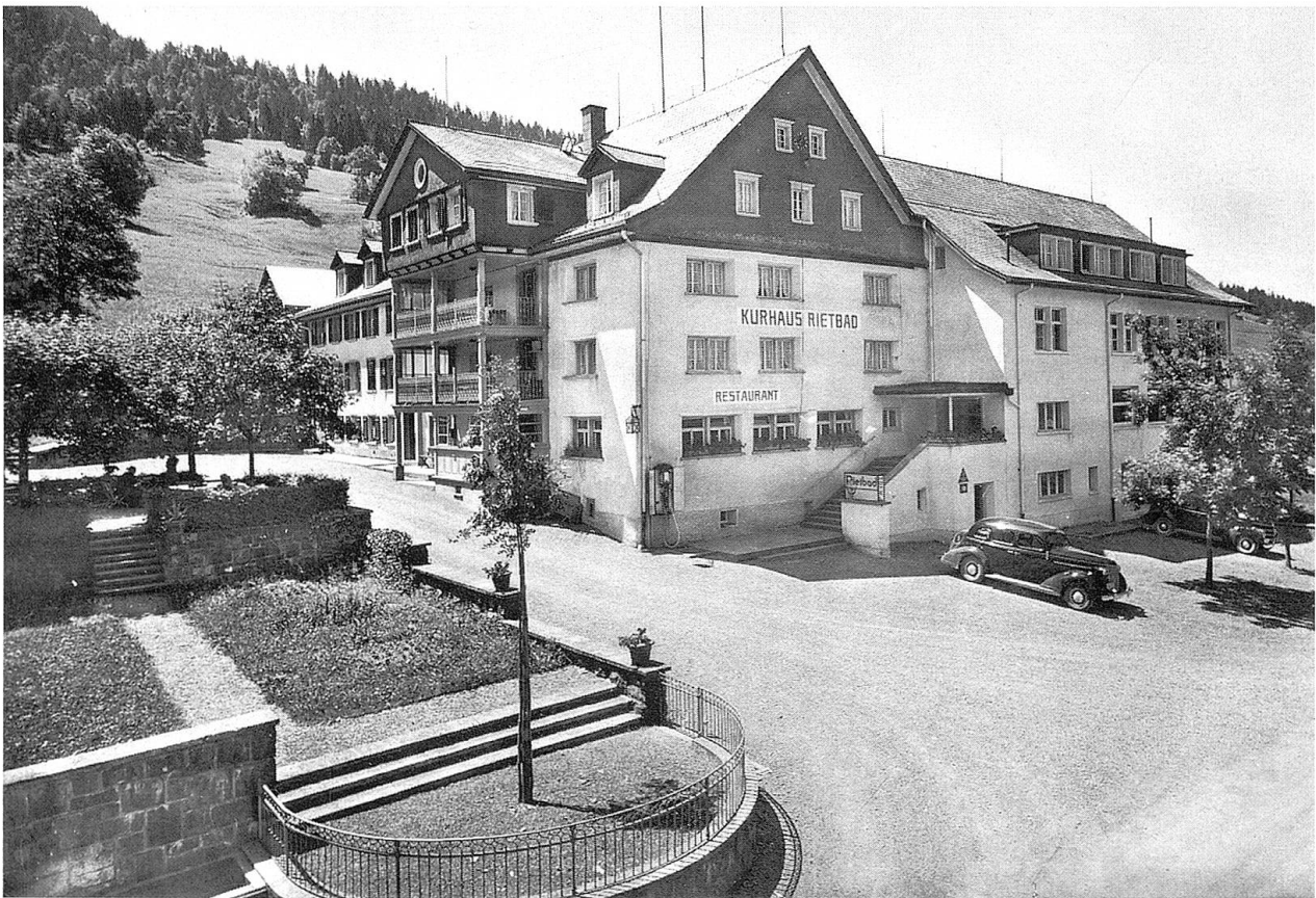
Kurhaus Rietbad, 1948.

Mit der Eröffnung der Strasse nach dem Rietbad (1867) nahm der Betrieb erneut einen Aufschwung, und die Bahn nach Ebnet (1870) und die Verlängerung bis Nesslau (1912) sowie die Eröffnung der Postautolinie nach der Schwägalp taten das Übrige zum Erfolg des Bades am Fusse des Säntis. Unter den Besitzern spielten vom 17. bis ins 19. Jahrhundert die Familien der Thurtaler Scherrer eine grosse Rolle. In einer Wappenscheibe aus dem Jahre 1675 des Fähnrichs Hans Wendelin Scherrer und seiner Frau Anna Ruedlinger sind symbolisch das Badehaus und der Badebetrieb abgebildet: In je vier hölzernen Badewannen sitzen – säuberlich getrennt – Männlein und Weiblein, wie es die Sitte erforderte. 1857 wurde dann der grosse gemeinsame Bade- raum in zwei geschlechtergetrennte Stuben umgebaut. Im glei-