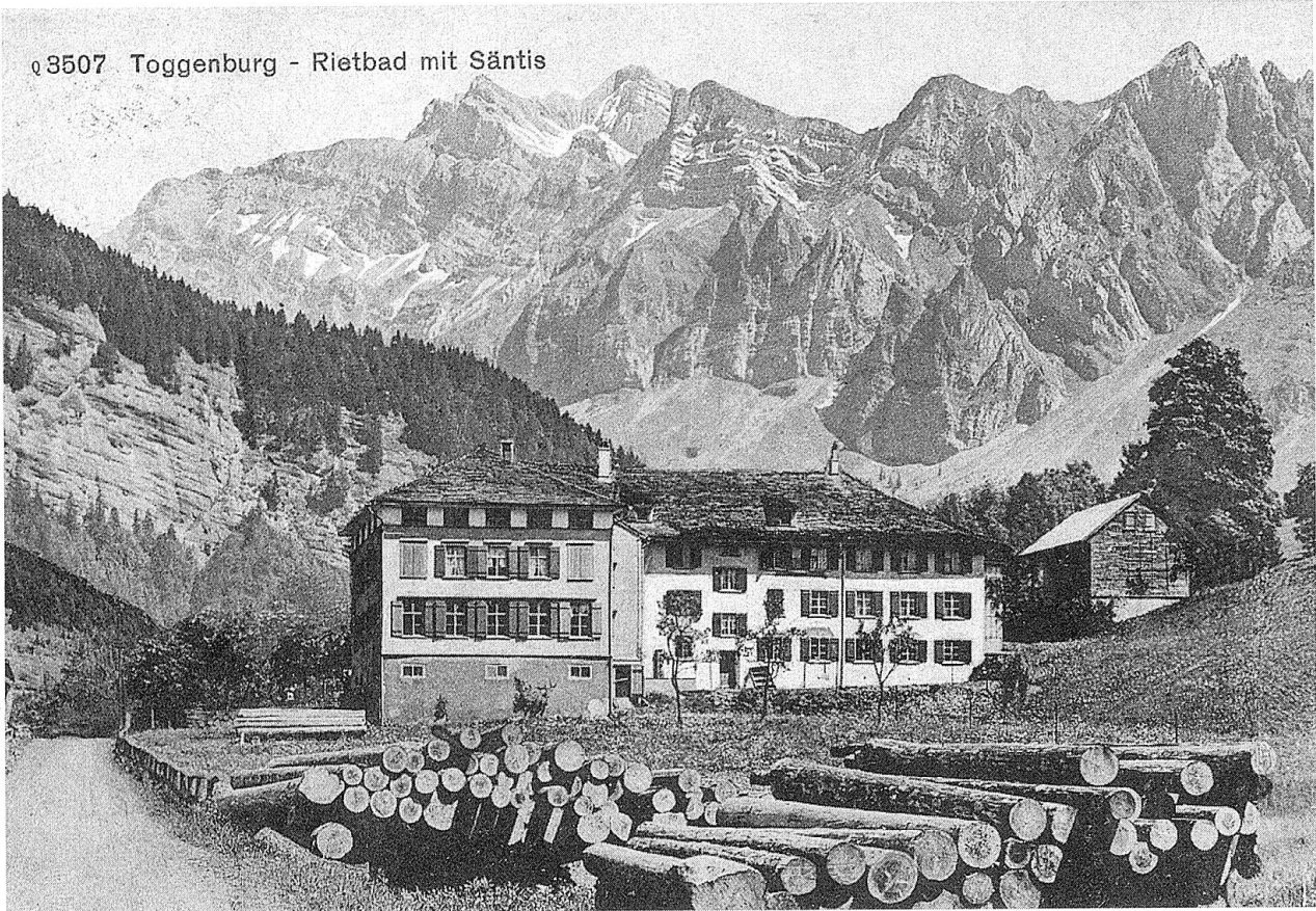
Rietbad mit Säntis, 1916.