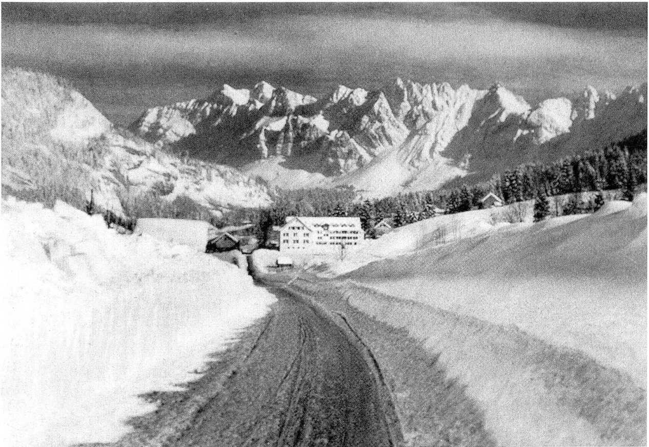
Rietbad mit Säntis, 1956.