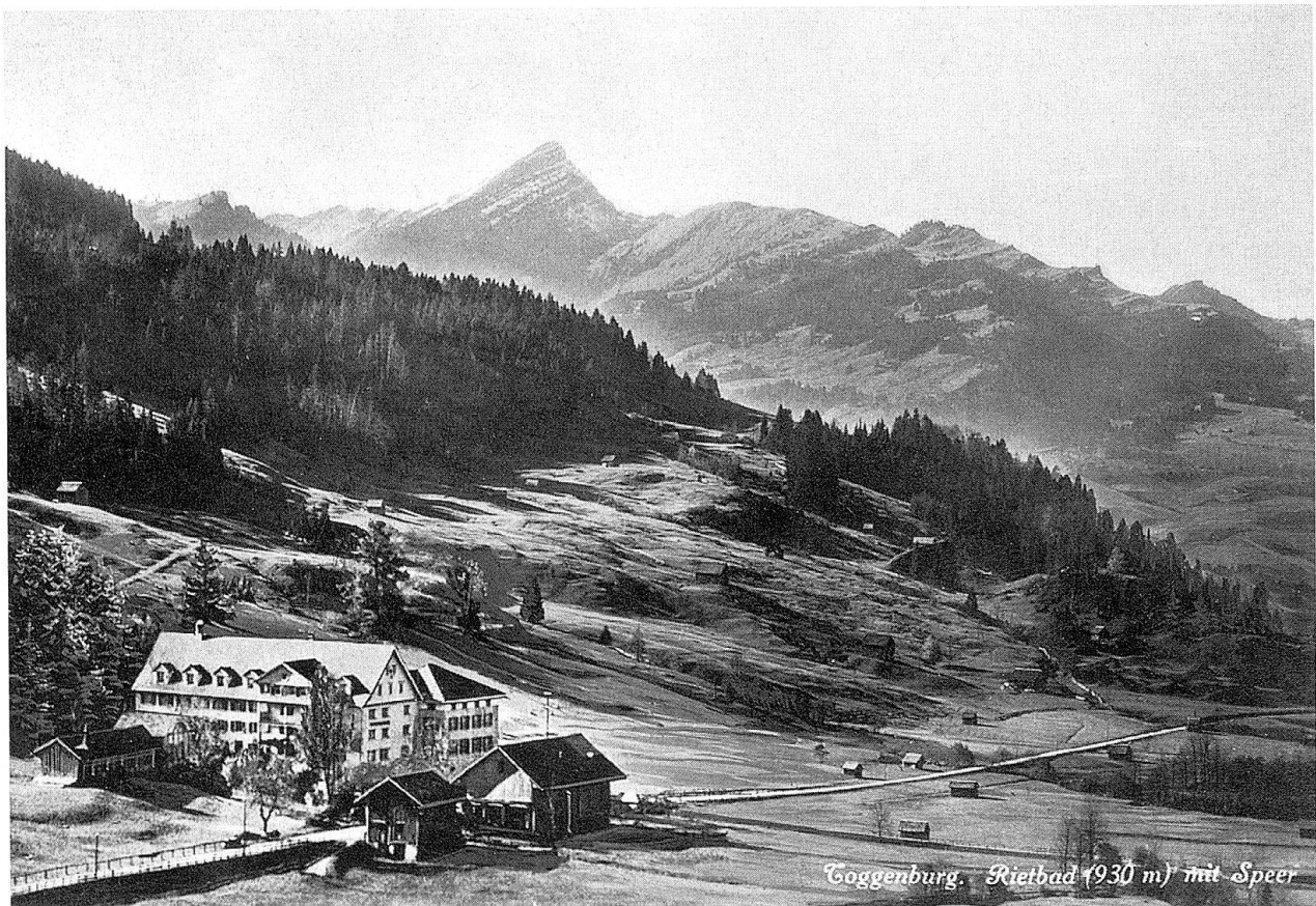
Rietbad mit Speer, 1921.