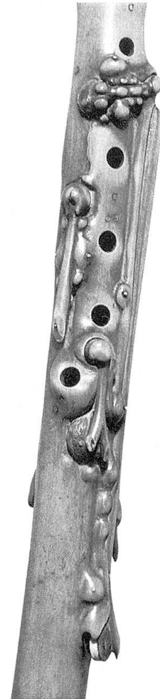
Welches sind Klappen, welches natürliche Knorren im Buchsbaumholz?