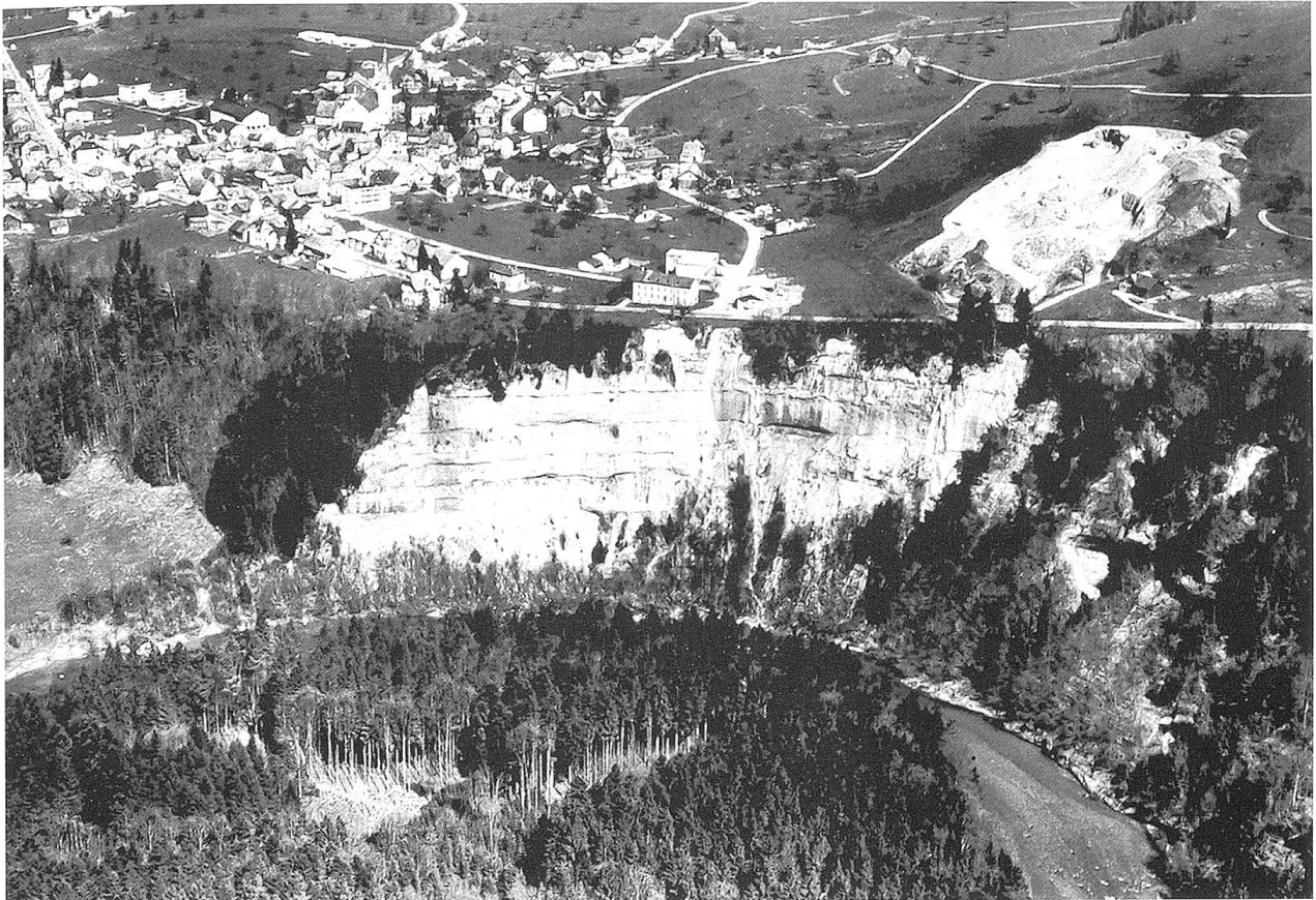
Luftaufnahme des «Chäferfelsens».