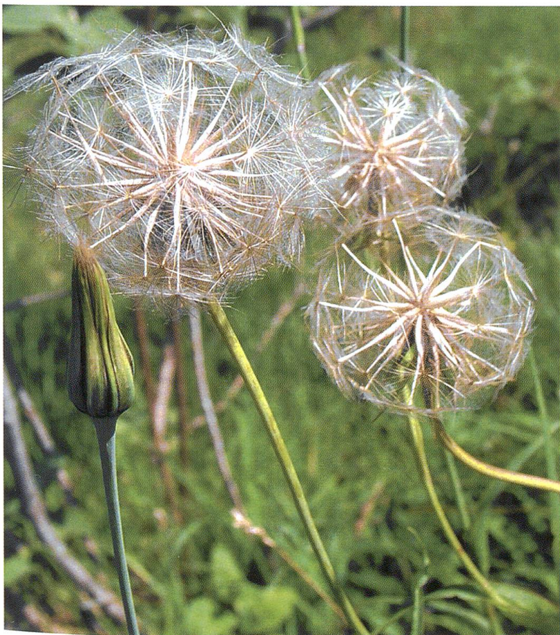
In den Fettwiesen der Täler selten geworden: der Östliche Wiesen-Bocksbart oder Habermark ( Tragopogon pratensis ssp. orientalis ), im Bild fruchtend.

Ist der Burghügel wirklich so einzigartig, wie der Titel behauptet? Dies zu glauben, fällt schwer, lassen sich doch in der Umgebung verschiedene ähnliche Hügel mit rund 1100 Metern Höhe und felsigen, südexponierten Steilhängen ausmachen. Als «Verdachtsflächen» springen das Hörnli westlich der Hulftegg, die St. Iddaburg zwischen Mühlrüti und Gähwil, das Horn nörd-