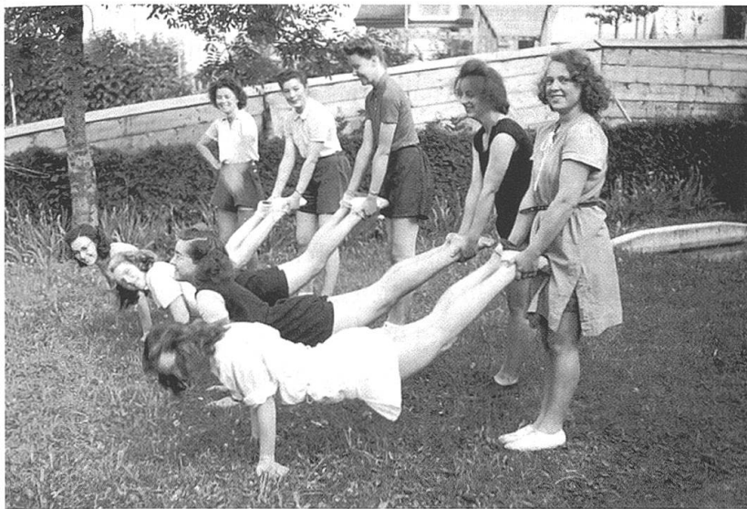
Morgendliches Turnen im Freien.