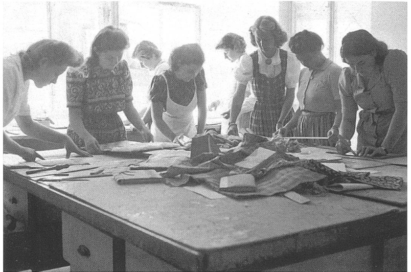
Die Seminaristinnen im Werkunterricht.