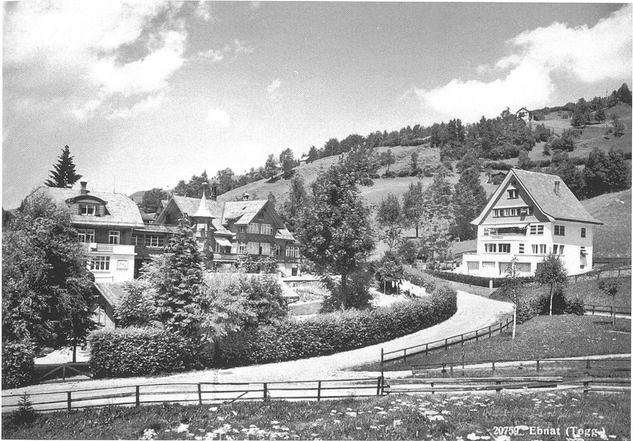
Sonnegg mit Internatsgebäude und Schule um 1940.