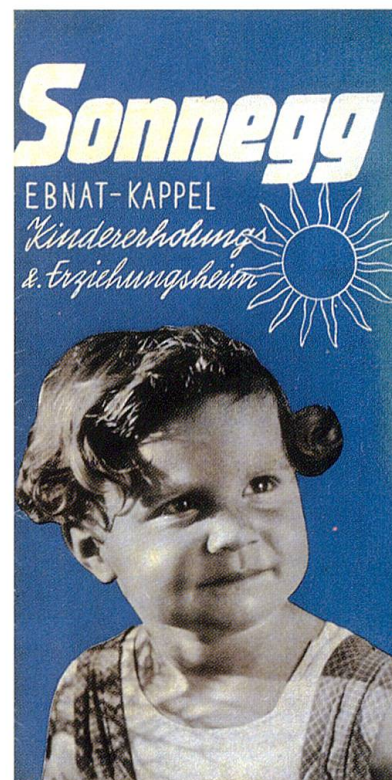
Titelseite des Sonnegg-Prospektes, um 1940.