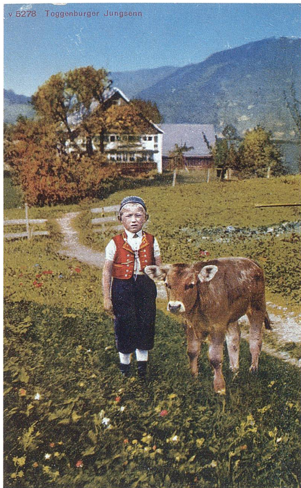
«Toggenburger Jungsenn». Postkarte um 1900. TML.