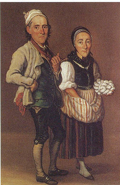
Ulrich Bräker und seine Frau Salome, 1793 in Öl gemalt von Josef Reinhard. Original im Historischen Museum Bern.