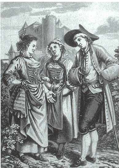
Trachtengruppe vor Schloss Iberg, Wattwil. Aquatinta von Franz Hegi, um 1840. TML.

Und das Neujahrsblatt auf das Jahr 1832 des wissenschaftlichen Vereins in St. Gallen bestätigt in seiner Schrift über die Bezirke Neu- und Obertokenburg: Der Toggenburger war von jeher als klug, sinnig und äusserst betriebsam und gewerbfleißig bekannt. In unserm obern Bezirke hat sich sein Charakter noch weniger abgeschliffen als da, wo Verkehr und Handel blühen. Der Bewohner des St. Johannertales ist noch wahrer Alpensohn und