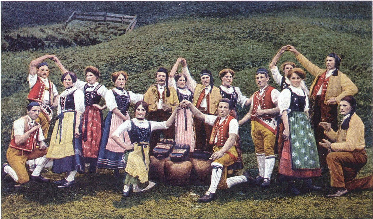
«Äplerreigen im Toggenburg». Postkarte um 1900. TML.

Hagmann windet auch der Toggenburgerin ein Kränzchen und schreibt weiter: