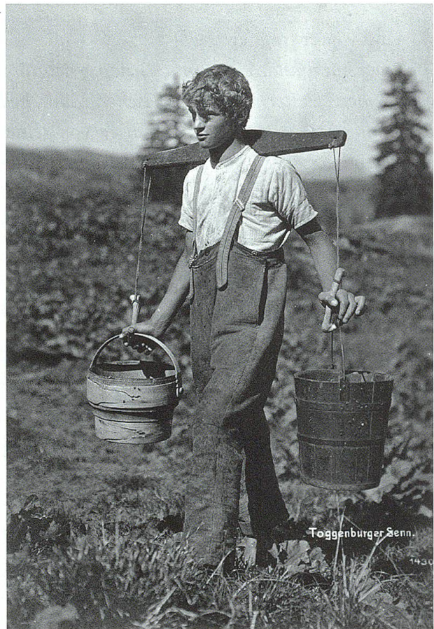
Aus dem bäuerlichen Leben des Toggenburgs. Postkarten zwischen 1900 und 1920.