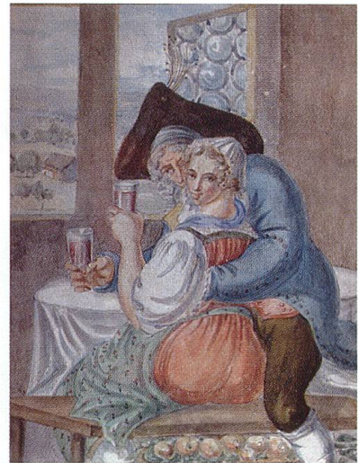
Trinkendes Liebespaar. Aquarell von Josef Reinhard, 1817. Toggenburger Museum Lichtensteig (TML).

Offensichtliche Laster besitze der Toggenburger keine, aber nach allen Regeln der Sittlichkeit sei er als höchst unmoralisch zu verurteilen. Denn unversöhnlichen Haß gegen jemand, der