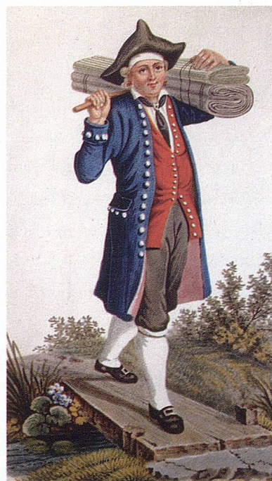
Toggenburgerin. Kolorierte Lithographie von A. Richli, um 1840. TML.