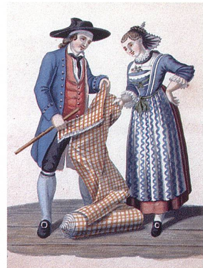
Trachtenpaar mit Toggenburger Baumwolltuch. Kolorierte Lithographie, um 1840.

Der Toggenburger arbeitet von jeher gern, lang und unermüdet. Müssige Rentiers und blosse Zinsenverzehrter gibt es keine oder wenige. Nur durch Arbeit – nicht durch Börsenoperationen – gelangte der Toggenburger zum Kapitalbesitz. Eben darum ist er aber auch in der Regel haushälterisch mit demselben, nicht nur im täglichen, sondern auch im Gewerbeleben, wo er es zur