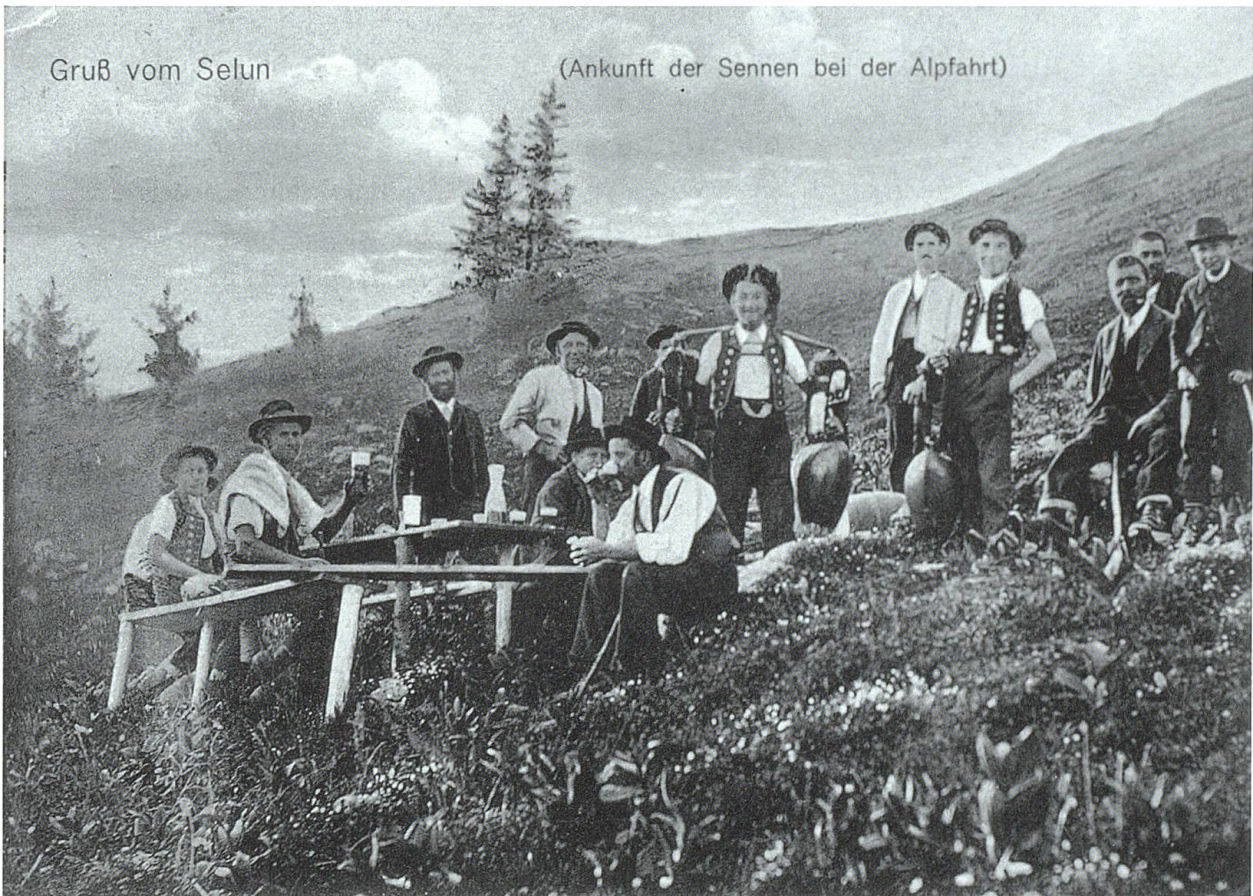
Brautfudertrage. Postkarte um 1910. TML.

Das feucht mit Betten, Thruh'n heran, Mit Tischen, Stühlen, schweren Kästen; Man füllt das Haus — und ist's gethan, Dann giebt's ein wonnesames Raften. J. Stauffacher.