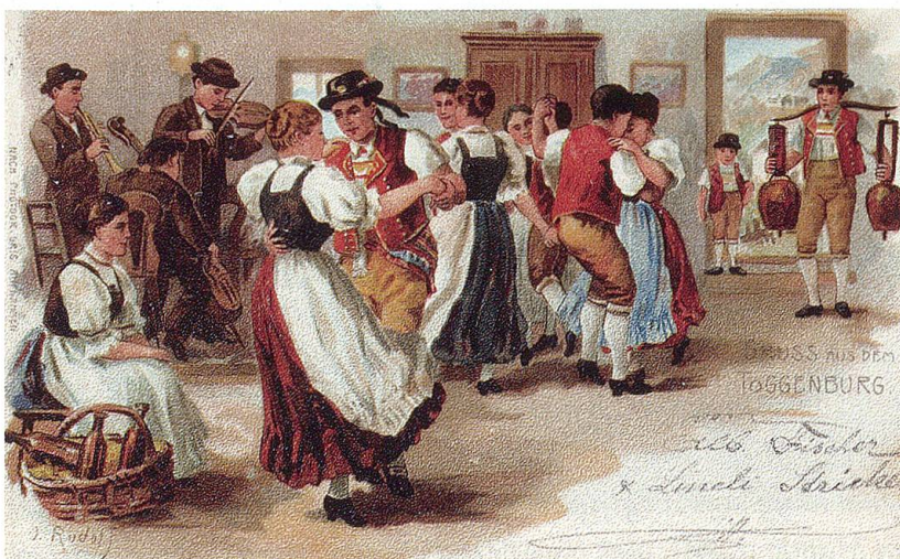
Toggenburger Sennenball. Postkarte um 1896. TML.

E Völchli hemmer denn gottlob Me muess si grad erfreue drob. S'ischt frili nüd so schüli fy --! » Was träget Komplimente y! Nu nüt vo dem; doch das ischt glych, S'ischt doch a menger Tuged rych. Und a me brave Biederma Het's Toggeburg nie Mangel g'ha!