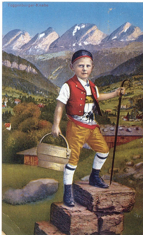
«Toggenburger Knabe». Postkarte um 1900. TML.

gen wurden zu Pensionen umgewandelt. Diese empfahlen sich den vorwiegend inländischen Erholungsbedürftigen als ruhiger und billiger Sommeraufenthalt mit gesundem Klima. Seit 1870 beschleunigte die Toggenburger Bahn auf der Strecke von Wil nach Ebnat den Handel und Personenverkehr. Mit der gezielten Werbung um Touristen ist schliesslich nach 1870 eine eigentliche Massenproduktion von druckgraphischen Ansichten und Postkarten angetrieben worden. Der 1877 vom Lichtensteiger J. J. Hagmann herausgegebene erste Reiseführer des Toggenburgs nennt nebst einer Einführung über Land und Volk auch alle industriellen und kulinarischen Etablissements des Thur- und Neckertals. Erstmals stellt damit ein Toggenburger seine Landsleute und die Landschaft einem interessierten Publikum vor.