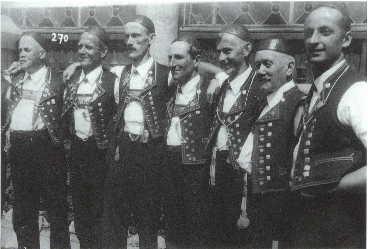
Festtag unter Toggenburgern. Postkarten aus den 1930er Jahren. TML.