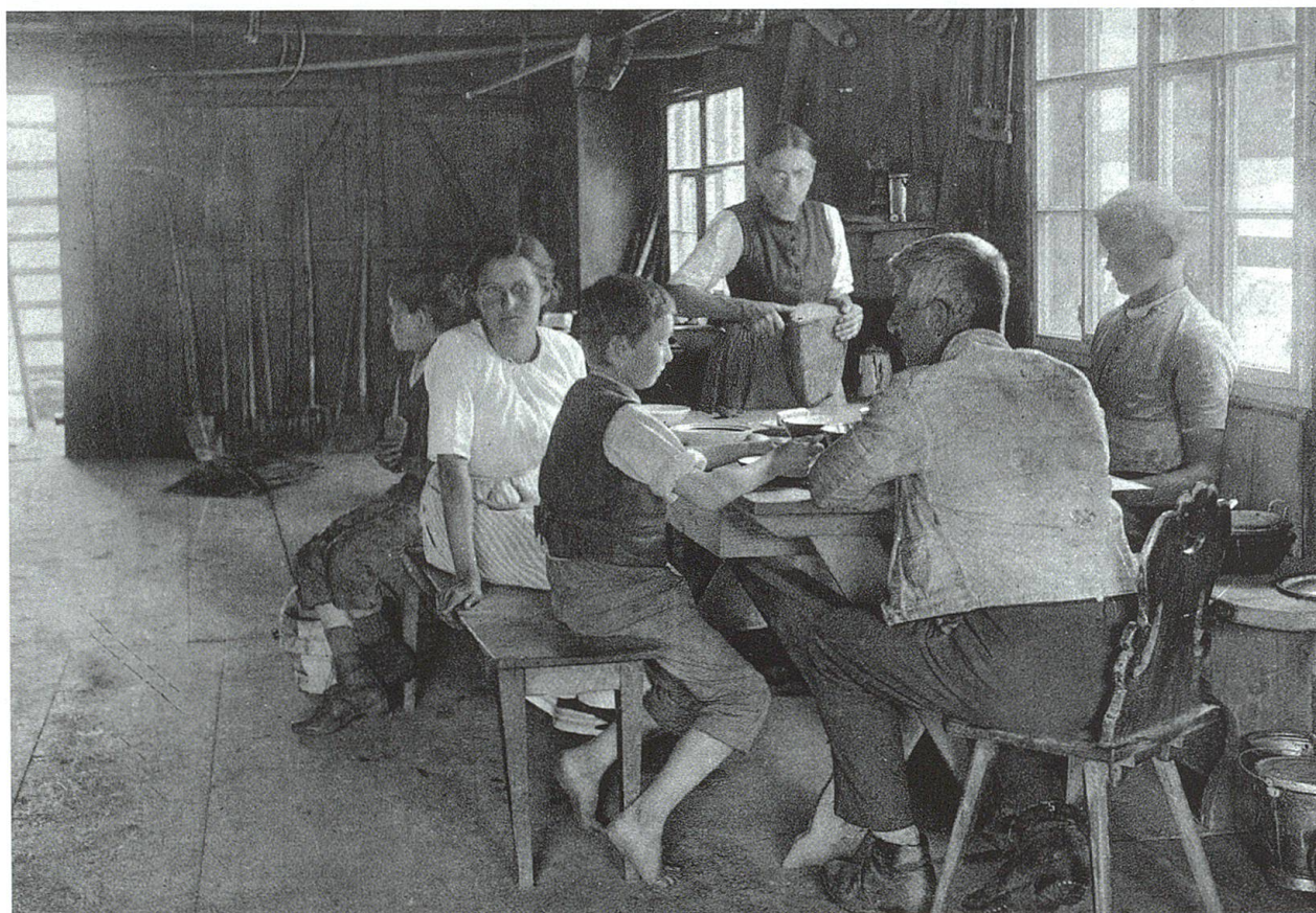
Mittagspause. Postkartenserie Volksleben im Toggenburg des Schweizer Heimatschutzes, um 1920.

«Frühstück auf der Alp». Postkarte um 1920. TML.