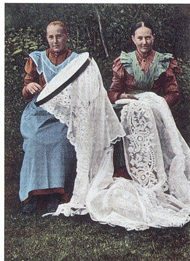
«Toggenburger Stickerinnen». Postkarte um 1900. TML.

Der Toggenburger spricht einen ausgeprägt eigenartigen Dialekt, der sich vor demjenigen anderer Kantonsteile durch helle