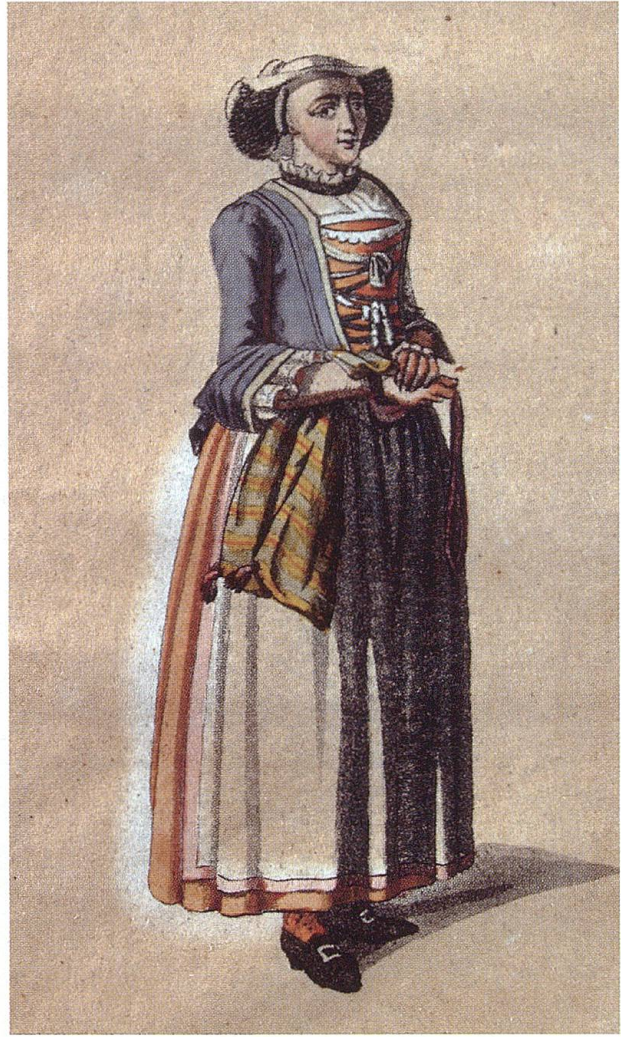
Ein Toggenburger und eine Toggenburgerin. Radierung von Franz Niklaus König, um 1811. TML.

ihn einmal beleidigt, zu unterhalten, im Handel und Wandel zu vervortheilen, von anvertrautem Gut etwas zu unterschlagen, zu betrügen, zu verleumden, in heimlichen Sünder Wollust und Unkeuschheit zu leben, das macht ihm auf seinem krankelager selten eine bittere Minute. Selten befählen Eltern ihren Kindern etwas ausser Fleiss zur Arbeit. Nicht aus moralischen Gründen allerdings, sondern um der allherrschenden Gewinnsucht willen, die tief im Toggenburger Charakter ligt.