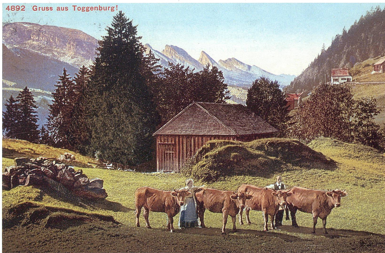
Im Schönenboden bei Wildhaus. Postkarte um 1910. TML.