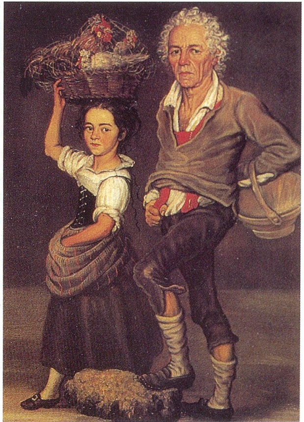
1793 hatte Josef Reinhard im mittleren Toggenburg vier Paare als Volkscharaktertypen in Öl gemalt, die Mädchen und Männer aus Bütschwil im Festkleid, die zwei Paare aus Wattwil in Werktagskleidern. Originale im Historischen Museum Bern.