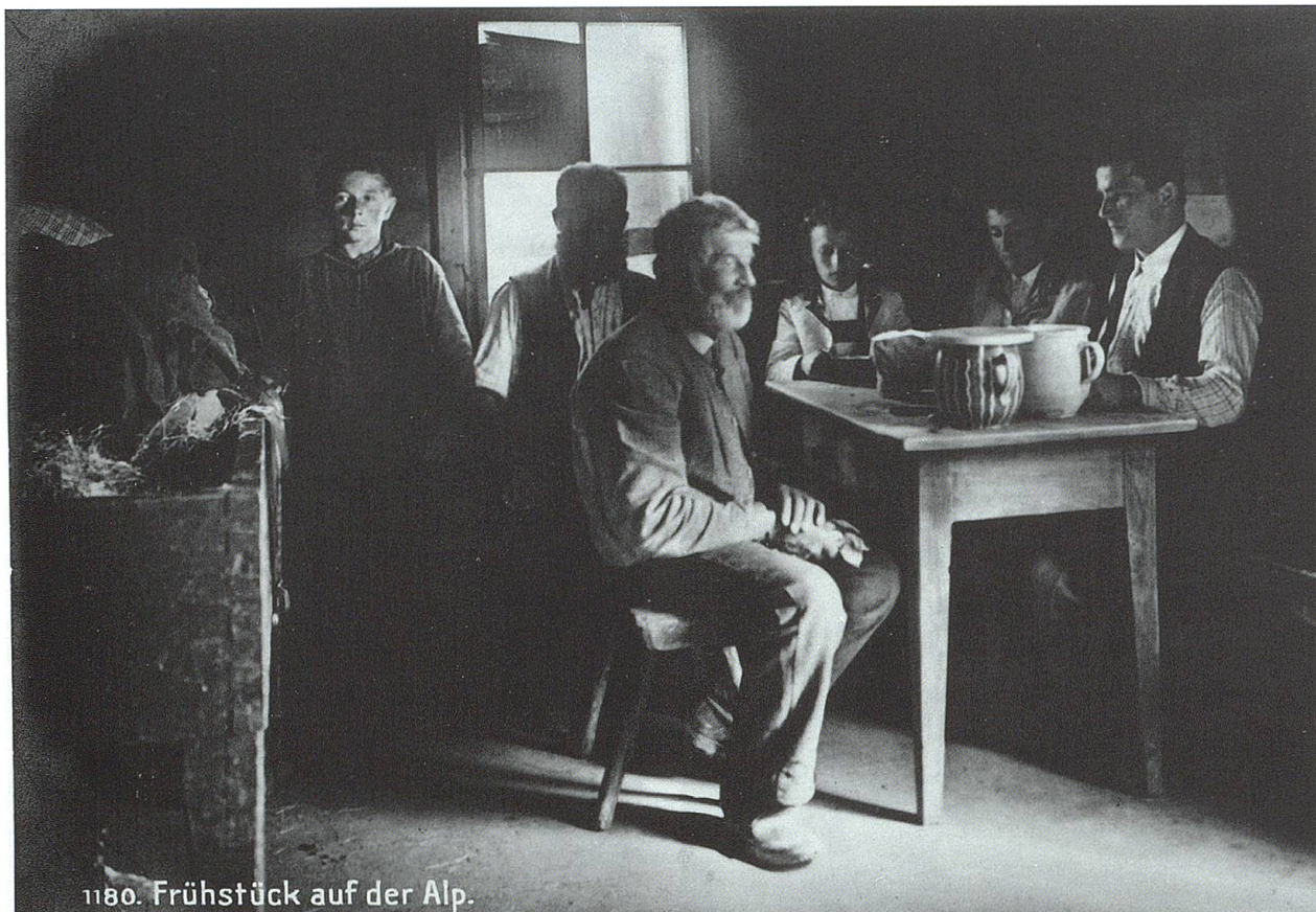
1180. Frühstück auf der Alp.

«Frühstück auf der Alp». Postkarte um 1920. TML.