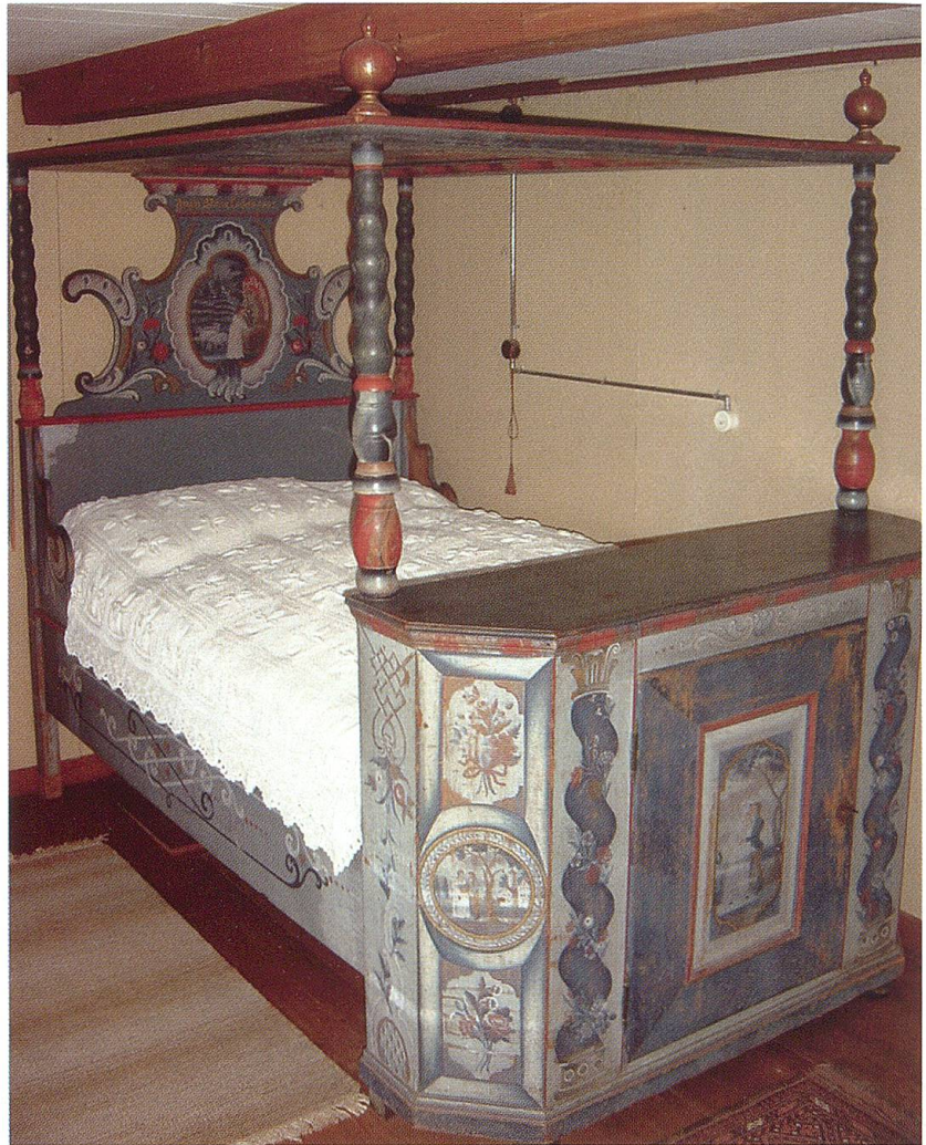
Himmelbett in der Stubenkammer, 1996 vom Ackerhus erstanden.

werden, die interessierten Besuchern das Ackerhus präsentiert. Dies wird nicht mehr mit den ausgedehnten regulären Öffnungszeiten wie bisher möglich sein, sondern vermehrt auf Abruf. Zugleich sind Bestrebungen da, in Zukunft durch Wechselausstellungen neues Publikum zu gewinnen.