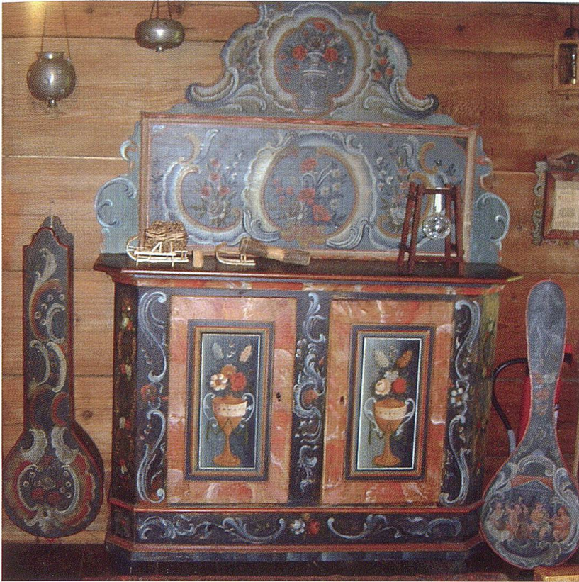
Bettkästli von ca. 1785 im unteren Gang, die Bemalung kam erst beim Ablagen zum Vorschein; links und rechts Halszitherkästen.