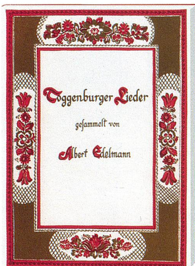
Die Liedersammlung Edelmanns.

werden, die interessierten Besuchern das Ackerhus präsentiert. Dies wird nicht mehr mit den ausgedehnten regulären Öffnungszeiten wie bisher möglich sein, sondern vermehrt auf Abruf. Zugleich sind Bestrebungen da, in Zukunft durch Wechselausstellungen neues Publikum zu gewinnen.