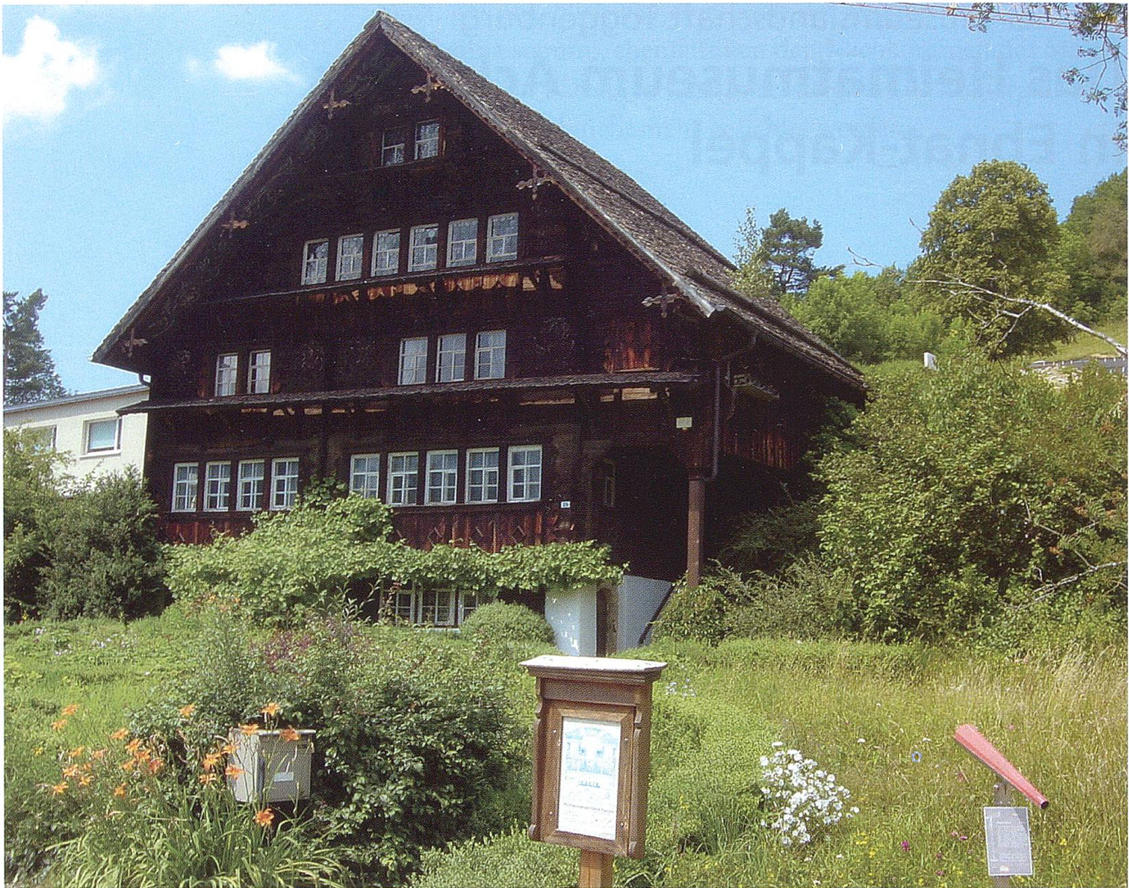
Das Ackerhus mit Bauerngarten, rechts hinter Sträuchern verborgen das Musikzimmer.