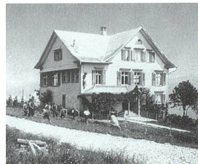
Schulhaus im Dicken.