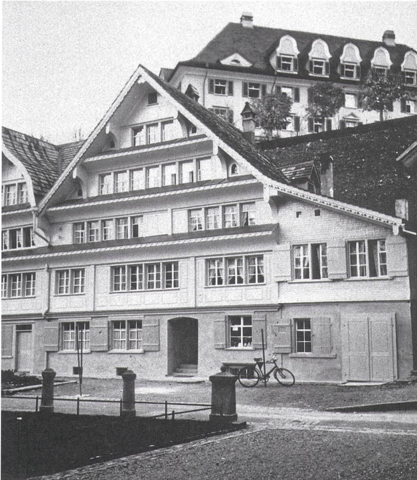
Das von beiden Konfessionen benutzte Waisenhaus Wattwil hinter der Kirche. 1864 wurde der Standort verlegt, das Haus 1973 abgerissen.