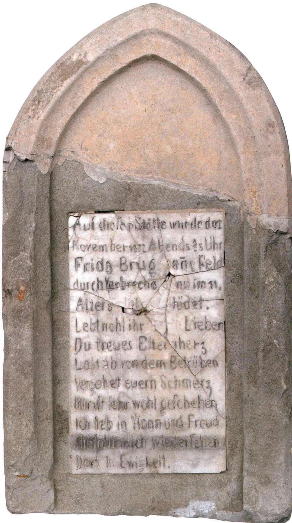
Stein zum Gedenken an das Verbrechen an Frida Bruggmann an der Strasse Lichtensteig–Wigetshof. Toggenburger Museum Lichtensteig.