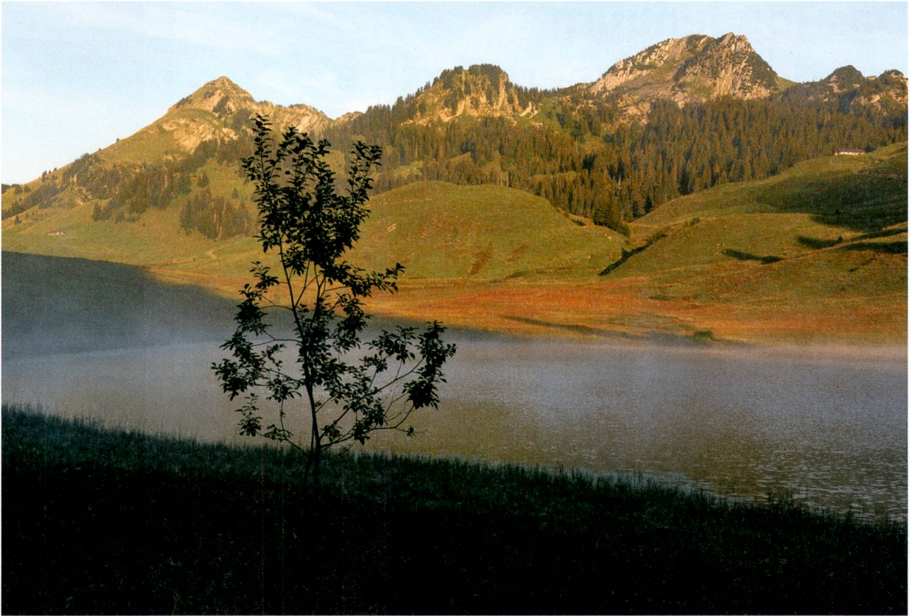
Der Gräppelensee ist eines der höchst gelegenen Laichgewässer der Erdkröte in der Region.

che und Flüsse verbaut, Geschiebesammler erstellt, Waldränder begradigt und Feuchtgebiete trocken gelegt haben, haben wir die natürliche Dynamik in der Landschaft ausser Kraft gesetzt. Amphibien haben sich wie viele andere Arten während Jahrtausenden auf solche ständig sich verändernde Lebensräume spezialisiert und finden sich im gegenwärtigen Zustand kaum mehr zurecht. Es fehlen ihnen die wechselnden Flussläufe der Auen, die bei Hochwasser überfluteten Räume, die Hangrutschungen, die Quellmoore und Rinnsale. Umso erstaunlicher ist, wie sie es gelegentlich trotzdem schaffen, an naturfernen Stellen wie Radsputtümpel oder Schwimmbassins zu überleben.