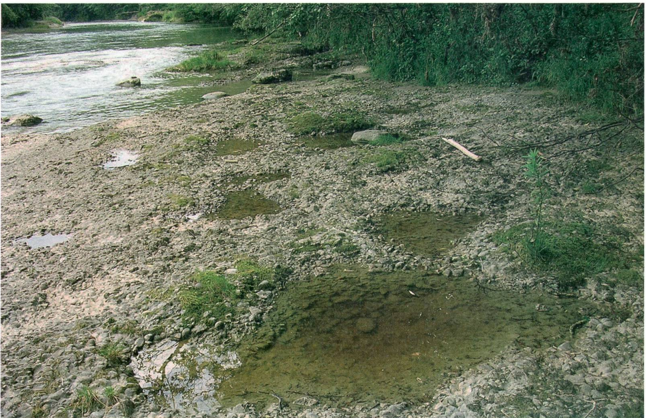
Natürliche geeignete Laichgewässer findet die Gelbbauchunke in Felstümpeln an der Thur.

in kleinen, schlammigen Tümpeln wohl, welche gelegentlich austrocknen oder durchgespült werden. Bevor Flüsse begradigt und die Landschaftsräume trocken gelegt wurden, waren solche Schlammtümpel allgegenwärtig. Selbst in Dörfern und auf Wegen fanden die Unken ihre kleinen Paradiese. Wenn Gelbbauchunken ihre Eier nach Regen in Pfützen ablegen, spekulieren sie, dass in den nächsten Wochen genug Regen fällt, damit ihre Larven sich fertig entwickeln können. Damit die Rechnung am Schluss aufgeht, verteilen Unken ihre Eier auf verschiedene,