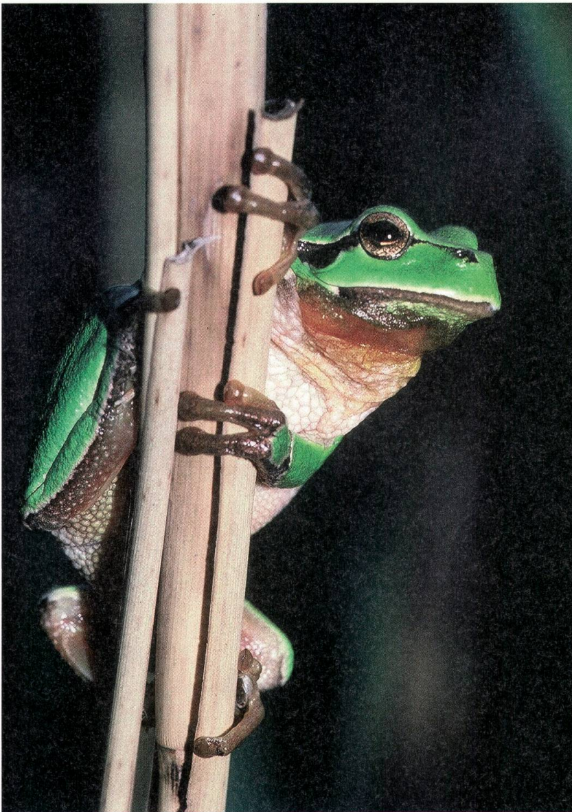
Als Baumfrosch verbringt der Laubfrosch den Sommer gerne in luftiger Höhe.

Die Kreuzkröte sucht das Extreme: Sie mag nur flache Wasseransammlungen. Und Wasser, das mehrere Monate lang stehen bleibt, behagt ihr nicht. Erst recht meidet sie Gewässer mit Wasserpflanzen. Da ihre wärmebedürftigen Kaulquappen nur einen Monat zur Entwicklung brauchen, genügen ihr kurzfristige Ansammlungen von Wasser an sonnigen Stellen. Zur Zeit der unregulierten Thur hat der Kreuzkröte der Fluss genau diese Bedingungen immer wieder neu geschaffen. Heute findet sie unbewachsene, flache und temporäre Wasserflächen nur noch in Kiesgruben. Sobald der Betrieb aber eingestellt wird, gehen auch diese Ersatzlebensräume verloren – die Tage der Kreuzkröte sind gezählt. Genau das geschieht derzeit in Jonschwil. Vielleicht bietet nur die Kiesgrube bei Kirchberg noch für einige Zeit Asyl für die Kreuzkröte.