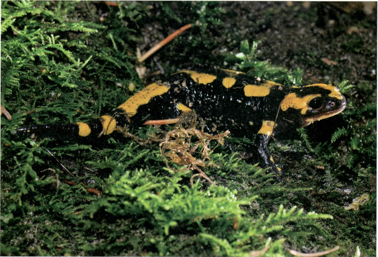
Der Feuersalamander trägt zu Recht eine Warnfärbung: Seine Haut ist mit starken Bakterien- und Pilzgiften überzogen.