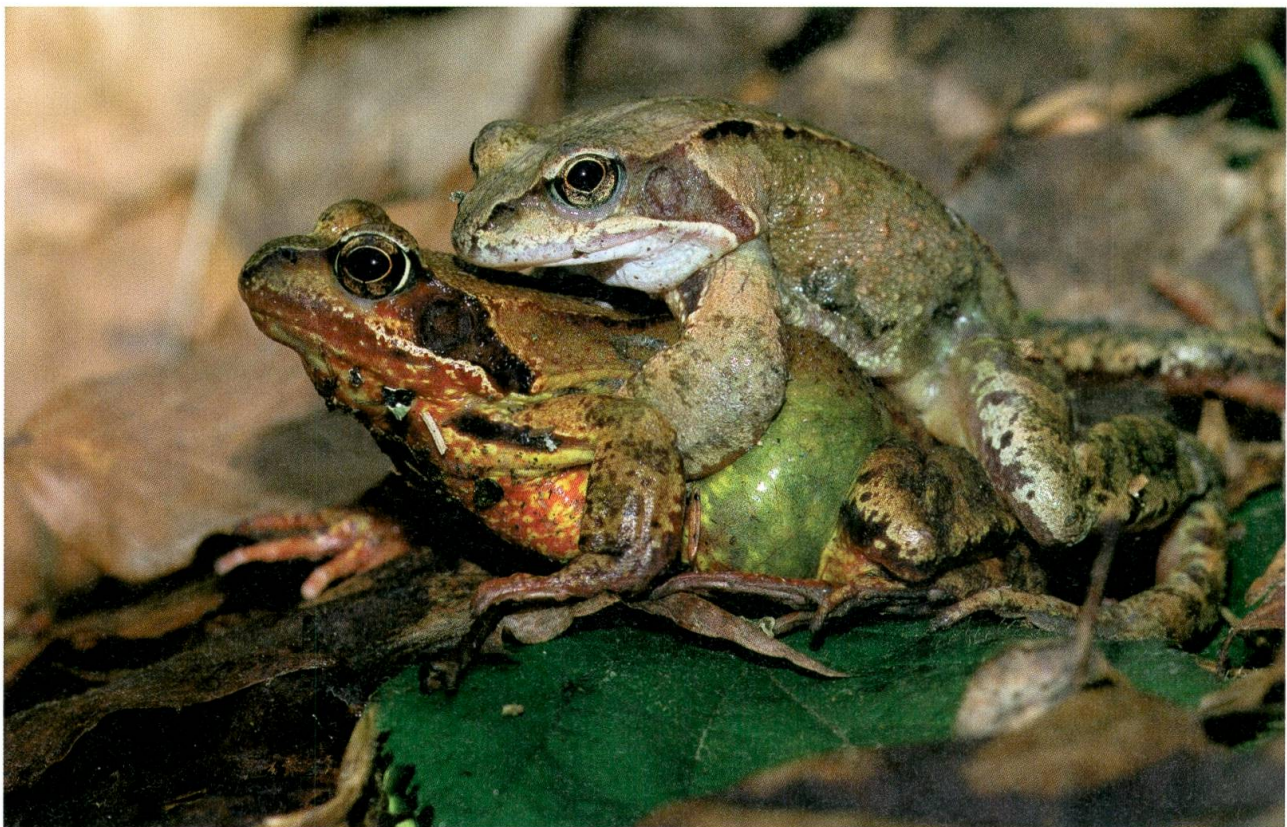
Der Grasfrosch, unser häufigster Froschlurch, tritt in vielen Farbvarianten auf.