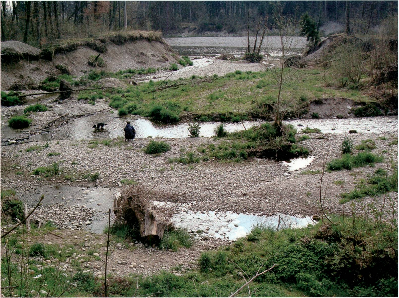
Die Wiederherstellung eines naturnahen Wasserhaushaltes ist die wichtigste Voraussetzung für die Erhaltung der Amphibien.

kommen als auch die Grösse der Vorkommen im Laufe der vergangenen 30 Jahre weiter abgenommen. Es ist also nicht gelungen, den Rückgang zu stoppen. Zwar geschieht es heute selten, dass ein Laichgewässer zugeschüttet und ein Vorkommen auf diese Weise ausgelöscht wird. Verhängnisvoller ist der Rückgang durch unauffällige, schleichende Prozesse: Wenn Weibchen 20 Prozent weniger Eier legen oder wenn ausgewachsene Tiere im Durchschnitt ein Jahr früher sterben, kann das nach wenigen Generationen zum Erlöschen eines Vorkommens führen. Wir beobachten das gegenwärtig besonders dramatisch bei der Geburtshelferkröte und bei der Gelbbauchunke, die beide innerhalb von 15 Jahren unbemerkt selten geworden und heute vielerorts kaum noch zu retten sind.