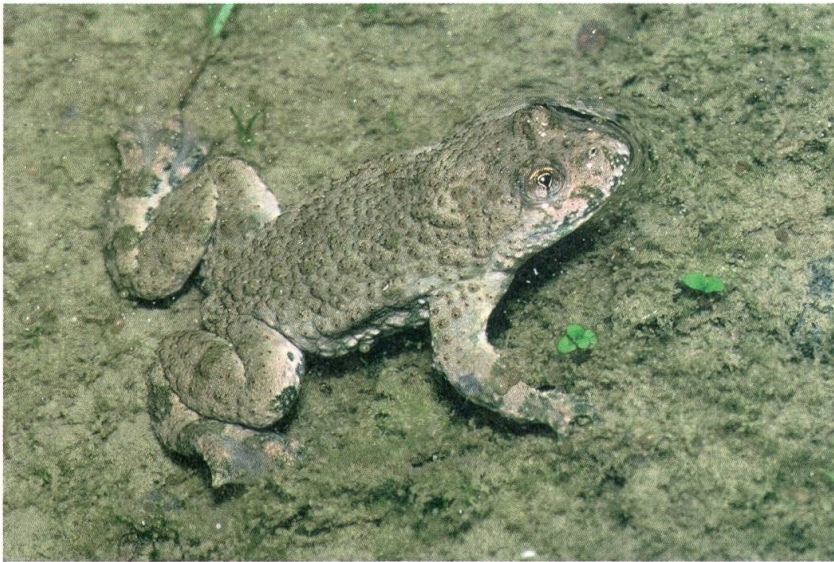
Im Schlammtümpel – einem typischen Laichgewässer – ist die Gelbbauchunke hervorragend getarnt.

in kleinen, schlammigen Tümpeln wohl, welche gelegentlich austrocknen oder durchgespült werden. Bevor Flüsse begradigt und die Landschaftsräume trocken gelegt wurden, waren solche Schlammtümpel allgegenwärtig. Selbst in Dörfern und auf Wegen fanden die Unken ihre kleinen Paradiese. Wenn Gelbbauchunken ihre Eier nach Regen in Pfützen ablegen, spekulieren sie, dass in den nächsten Wochen genug Regen fällt, damit ihre Larven sich fertig entwickeln können. Damit die Rechnung am Schluss aufgeht, verteilen Unken ihre Eier auf verschiedene,