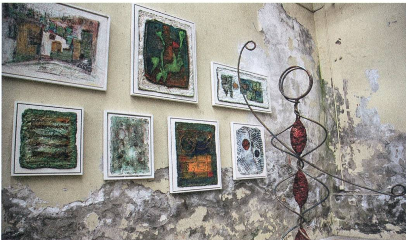
Bilder und Skulptur von Doris Schiess in der Shedhalle, 2006.

Die leer stehende Shedhalle konnte im Jahre 2006 als Experiment für einen Monat benutzt, eine Kunstausstellung mit grossen Namen der Schweizer Kunstszene realisiert werden. Das