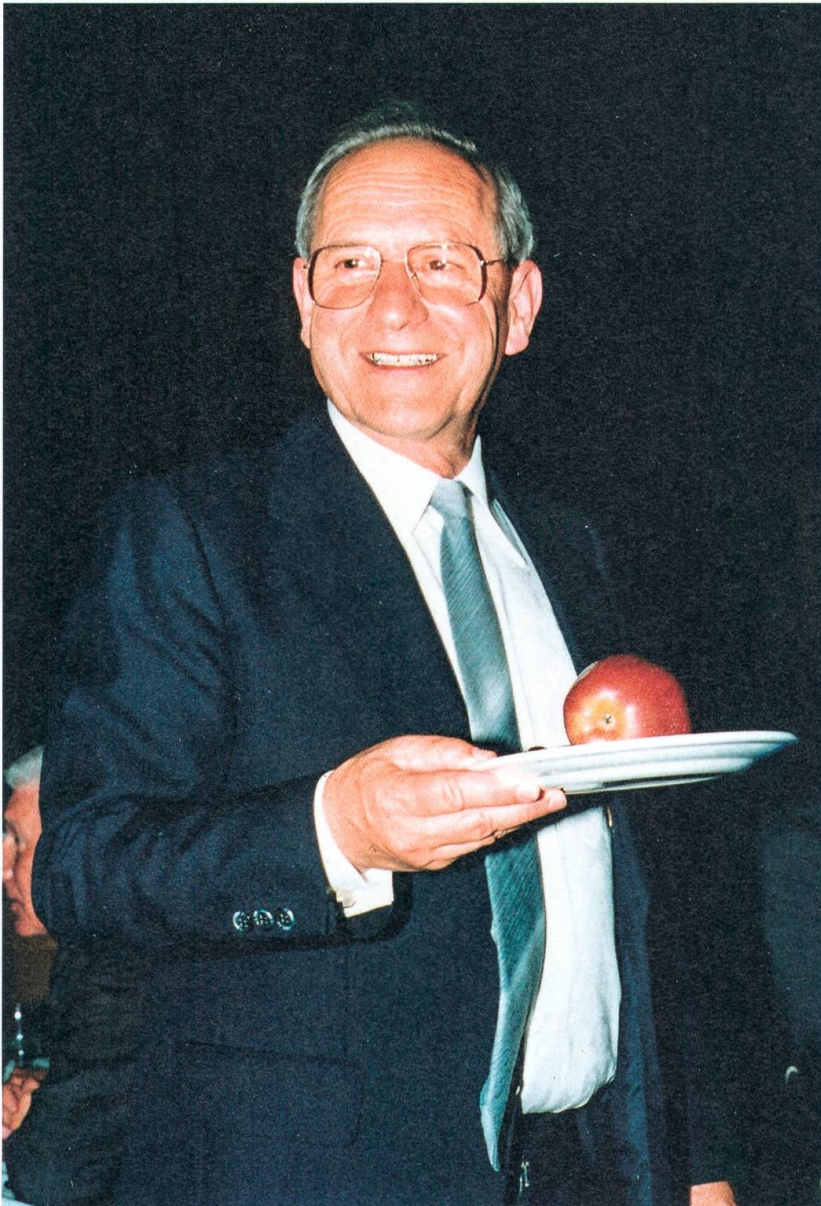
Einweihung der Umfahrung Lichtensteig am 18. Juni 1983.