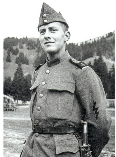
Rekrutenschule in Fribourg 1942.