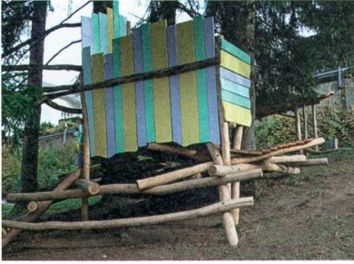
Eigenwillige Spielhütte beim Bürgerschulhaus.