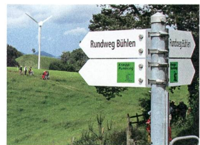
Auf dem Bühlen-Rundweg.

Bei idealem Wanderwetter wird der Bühlen-Rundweg eröffnet. Oberhelfenschwil verfügt nun über drei Rundwege, den Kneippweg, den Ahornweg und neu den Bühlenweg. Gegen sechzig Wanderlustige ziehen vom Dorf über Bühlen, Freudenberg, am Windrädli vorbei zur Feuerstelle beim Kreuz.