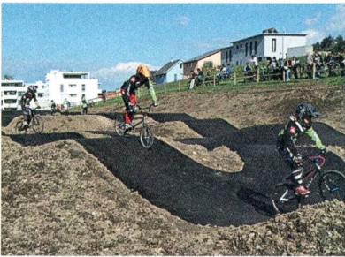
Die Pumptrack-Anlage am Tag der Eröffnung.

Die Genossenschaft Gemeinschaftsantennen-Anlage stellt