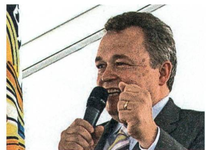
Festansprache in Ennetbühl.

Mehrere tausend Besucherinnen und Besucher geniessen das abwechslungsreiche Programm an den 8. Internationalen