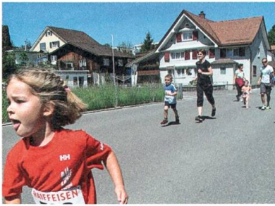
Auch die Allerjüngsten laufen am Kreuzegg-Classic mit.

Ganterschwil verzeichnet ein überdurchschnittliches Wachstum von 2,8 Prozent. 130 Personen ziehen in die Gemeinde.