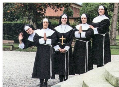
Non(n)sense – a funny nunny Musical.