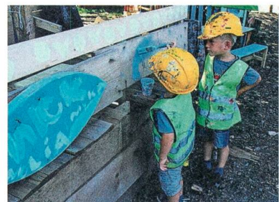
Anstrich für die Wand.