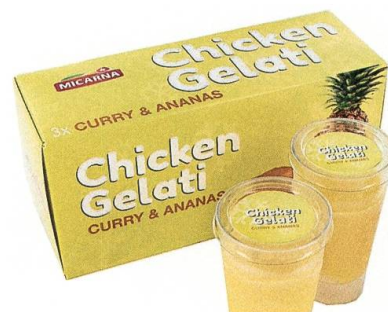
Chicken Gelati – ein Angebot mit Zukunft?

Und wieder sorgt die Micarna in Bazenheid für positive Schlagzeilen. Europäische Medien berichten von «Chicken Gelati», einer Pouletglace, die an der «Anuga», der weltgrössten Ernährungsmesse in Köln mit dem Thema «Wie schmeckt die Welt von morgen?», vorgestellt wird.