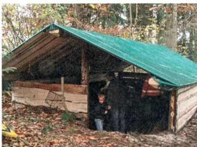
Waldhütte für den Kindergarten.

Die Kindergarten-Waldhütte im Haslerwäldli wird mit Hilfe von 19 Vätern und 2 Müttern saniert. Die Hütte bietet nun den Kindergärtnern Schutz bei jedem Wetter.