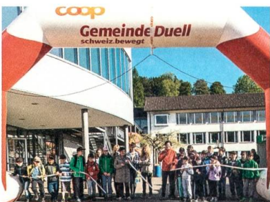
Gemeindeduell «Schweiz bewegt» in Degersheim.

Anlässlich der 150-Jahr-Feier lanciert die St. Galler Kantonalbank einen Projektwettbewerb. Der Verkehrsverein möchte mit dem Projekt «Degersheim – zum Anbeissen» ein «essbares Dorf» schaffen. Die zahlreich bestehenden Grünflächen der öffentlichen Hand werden in einem ersten Schritt mit Bäumen, Sträuchern, Beeren und Gemüse bepflanzt. Statt «Betreten verboten» wird es künftig heissen «Pflücken erlaubt». Das Degersheimer Projekt wird von der Jury als eines der besten prämiert und somit durch die St. Galler Kantonalbank finanziell unterstützt.