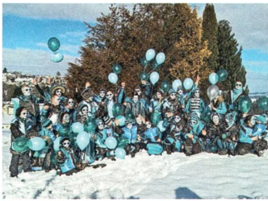
Die Guggenmusik Ruck Zuck Schränzer in ihren neuen Kostümen.

öffentliche Weihnachtsbaum in der Geschichte Degersheims in der Mitte des Dorfplatzes.