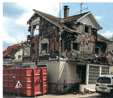
Die ehemalige Spenglerei Wirth wird abgerissen.

Nach dem Abbruch zweier Gebäude findet der erste Spatenstich für das neue Gemeindehaus an der Lindenstrasse statt.