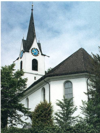
Die reformierte Grubenmannkirche.

Der Nachtrag zur Gemeindeordnung wird an der Bürgerversammlung abgelehnt. Streitpunkt ist der heftig umstrittene