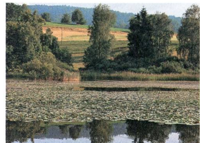
Seerosenteppich auf dem Bettenauer Weiher.