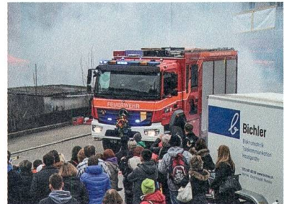
Das neue Tanklöschfahrzeug im Einsatz.