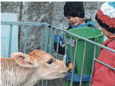
Kinder beim Kälbertränken.

Damit das Dorf selbständig über die Nutzung des öffentlichen Teils des Pfarrhauses (Sonntagsschule, Bibliothek, Gemeinschaftsraum) verfügen kann, übernimmt der Verein Krinau aktiv das Pfrundgut der Kirche: Pfarrhaus und drei kleine Waldparzellen.