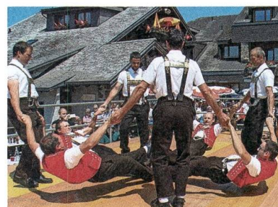
Starke Ausstrahlung des Sennetts.

Das viertägige Klangfestival Naturstimmen hat rund 300 Künstlerinnen und Künstler sowie 6500 Gäste nach Alt St. Jo-