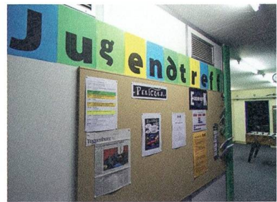
Der neu gestaltete Jugendtreff.