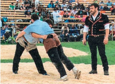
St. Galler Schwingfest in Uzwil.