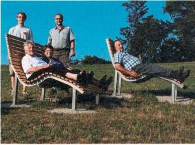
Senioren geniessen das Probe- liegen.