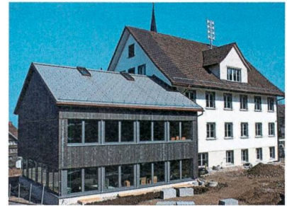
Büros der Gemeindeverwaltung in der ehemaligen Post Mogelsberg.