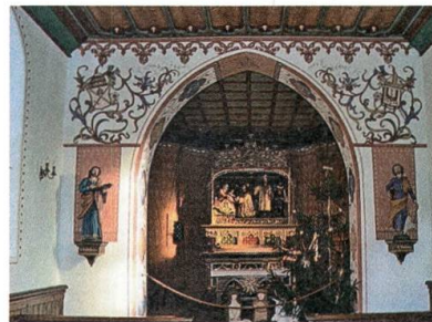
Chorraum der St.-Bartholomäus-Kapelle.

Bei strahlendem Wetter werden in Lütisburg zwei musikalische Grossanlässe, der Kantonale Veteranentag und der Neckertaler Kreismusiktag, unter besten Bedingungen durchgeführt.