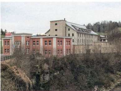
Gewerbepark in der ehemaligen Spinnerei Dietfurt.

Ganterschwil: Nach gut 50 Arbeitsjahren auf den Gemeinde- und Stadtverwaltungen von Wittenbach, St. Gallen, Wil, Niederhelfenschwil, Ganterschwil und Bütschwil-Ganterschwil