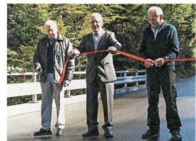
Eröffnung der neuen Brücke über den Zwisler.

Mit einer kleinen Feier wird die neu erstellte Betonbrücke über den Zwisler zwischen Hemberg und Bächli eingeweiht.