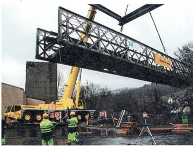
Abtransport der alten Schützengartenbrücke.

Am letzten November-Wochenende feiert der Gewerbeverein Ebnat-Kappel sein 125-jähriges Bestehen. Über 30 Aussteller präsentieren sich an der Jubiläumsausstellung in der Mehrzweckhalle Schafbüchel.