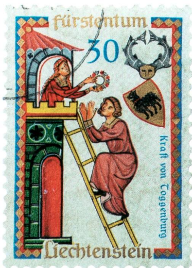
Briefmarke des Fürstentums Liechtenstein mit Minnesänger Graf Kraft II. von Toggenburg.

Nach dem Aussterben der Grafen von Rapperswil diente der Burgkomplex als Amtssitz der habsburgischen Vögte. Der wirtschaftliche Aufschwung machte Rapperswil zur Konkurrenzstadt von Zürich, dies führte zu Spannungen und zum Krieg. In der Folge übernahmen 1354 die Herzöge von Österreich die Burg Rapperswil, die als wichtiger Stützpunkt Österreichs in den Auseinandersetzungen mit den Eidgenossen diente. 1460 kam das Schloss unter die Schirmherrschaft der Orte Uri, Schwyz, Unterwalden und Glarus, es erhielt den Status eines zugewandten Ortes.