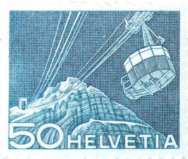
Die erste Säntis-Schwebebahn.

Nach dem Ersten Weltkrieg wurde der Luftpostdienst der Schweiz von der Fliegertruppe der Schweizer Armee durchgeführt. Militärpiloten beförderten Poststücke zwischen Dübendorf, Bern und Lausanne. Mit Postverträgen wurden die schweizerischen Luftlinien ins internationale Luftliniennetz aufgenommen. Der Transport für Poststücke auf dem Luftweg war bedeutend schneller als auf dem herkömmlichen Land- und Seeweg. Die Eilpost mit dem Flugzeug erforderte bald eine erhöhte Taxe, dies wurde möglich mit der Ausgabe von Flugpostmarken.