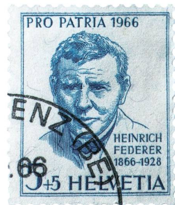
Porträt von Heinrich Federer (6. 10. 1866–29. 4. 1928), Pro-Patria-Marke mit Wertangabe und Wertzuschlag.