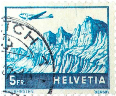
Churfürsten mit Flugzeug (Flugpostmarke).

sind die Namen der sieben Berggipfel zu lesen. Die «toggenburgische» Reihenfolge beginnt mit dem Chäserrugg (am rechten Bildrand), vor Hinterrugg, Schibestoll, Zuestoll, Brisi, Frümssel, und sie endet mit dem Selun.