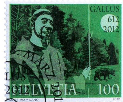
Der heilige Gallus mit einem Bären.