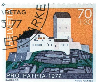
Schloss Sargans, Pro-Patria-Marke mit Wertangabe und einem Wertzuschlag, mit dem die definierten Projekte unterstützt wurden.

Erwähnenswert ist auch die auf der Briefmarke abgebildete Rheinbrücke. Nach dem Einsturz der Steinbrücke 1754 entschied sich der Rat von Schaffhausen für den Bau einer Holzbrücke über den Rhein. Der Vorschlag von Grubenmann sah vor, eine stützenlose Brücke von gegen 120 Meter Spannweite zu bauen. Der Rat sprach sich für einen Stützpfeiler in der Mitte der Brücke aus. Das Holzbauwerk wurde mit dem Ende der Französischen Revolution völlig zerstört, und damit ging ein Meisterwerk der Grubenmann-Familie verloren.