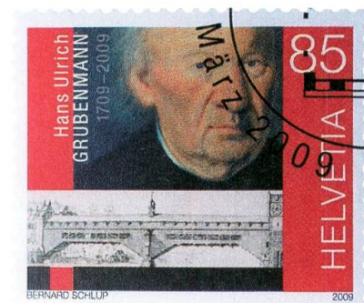
Holzbrücke und Porträt von Johann Ulrich Grubenmann (1709–1783).