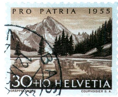
Gräppelensee, Pro-Patria-Marke mit Wertangabe und Wertzuschlag.