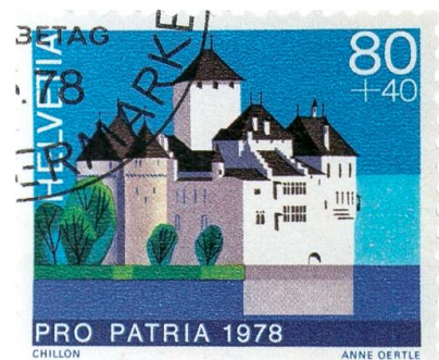
Schloss Rapperswil, Pro-Patria-Marke mit Wertangabe und Wertzuschlag.

Das Städtchen Rapperswil entwickelte sich schnell zu einem wichtigen Marktstädtchen, bereits in der Mitte des 13. Jahrhunderts erhielt es das Stadtrecht. Die Burg von Rapperswil wurde zu einem Mittelpunkt höfischen Lebens und ritterlicher Feste,