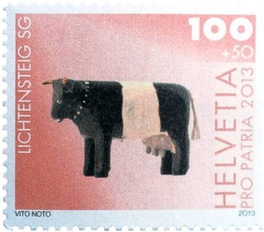
«Gort-Holzchüeli», Toggenburger Museum. Pro-Patria-Marke mit Wertangabe und Zuschlag.