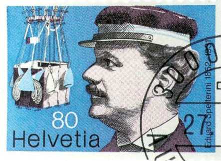
Ballonkorb und Kapitän Eduard Spelterini (1852–1931).

Der schöne, grosse Ballon erregte überall und immer wieder Bewunderung. Zahlungskräftige Abenteurer, Wissenschaftler und Offiziere nahmen Spelterini im Ballonkorb auf seine Expeditionen mit. Beim Ballonaufstieg 1891 in Zürich gab es nicht nur