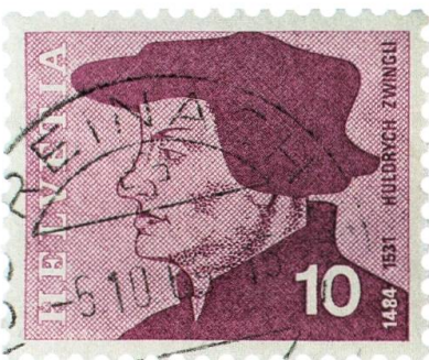
Porträt von Huldrych Zwingli (1. 1. 1484–11. 10. 1531).

Am 35. Geburtstag wurde Zwingli zum Leutpriester in Zürich ernannt. Im September 1519 erkrankte er an der Pest. Bis Ende