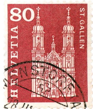
Kathedrale St. Gallen.