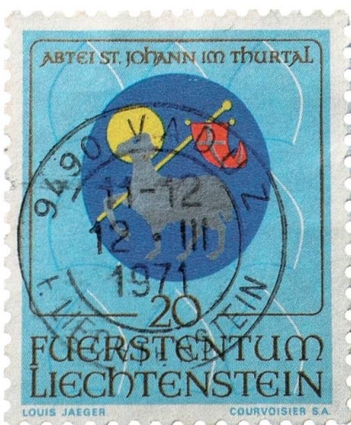
Briefmarke des Fürstentums Liechtenstein mit Wappen des Klosters St. Johann im Thurtal.

Die Gründung des Benediktinerklosters St. Johann im oberen Toggenburg fällt in die Mitte des 12. Jahrhunderts. 1178 werden Besitzungen wie Nesslau und St. Peterzell urkundlich festgehalten. In St. Peterzell bestand damals schon ein Priorat des Klosters St. Johann. Im Jahr 1251 wurde Graf Rudolf I. von Toggenburg zum Abt des Klosters St. Johann im Thurtal geweiht. Seine Blütezeit erlebte es im 14. Jahrhundert. Im späten Mittelalter erschütterten verschiedene Krisen das Kloster. Interne Spannungen und die Reformationszeit unter Huldrych Zwingli über-