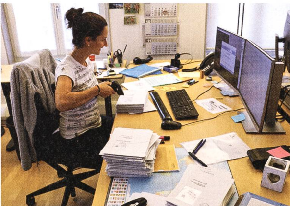
Nach dem Eintreffen der Rückantwortcouverts werden die Stimmrechtsausweise gescannt.

In der Gemeinde Kirchberg ist am Abstimmungssonntag jeweils eine Urne in Bazenheid für die persönliche Stimmabgabe offen. Der Barcode des Stimmrechtsausweises der Stimmberechtigten, welche an der Urne abstimmen, werden ebenfalls mittels Scanner erfasst. Damit wird analog der brieflichen Stimmabgabe kontrolliert, dass diese nicht doppelt erfolgen kann. Nach Schliessung der Wahlurnen erfolgt die Öffnung der Urne und diejenige der brieflichen Stimmabgaben durch die Stimmzählerinnen und Stimmzähler (Stimmbüro). Einzelne