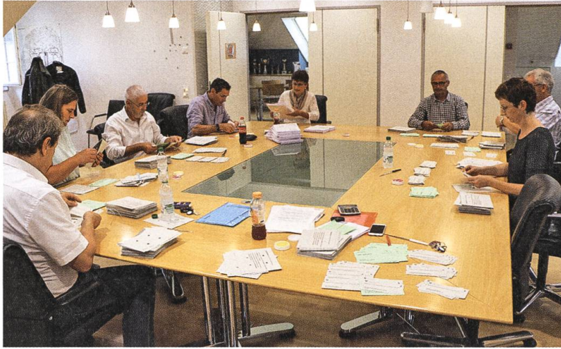
Das Stimmbüro der Gemeinde Kirchberg beim Sortieren der Stimmzettel.

Stimmberechtigte, vor allem Ehepaare, legen ihre Abstimmungszettel und Stimmrechtsausweise in ein Rückantwortcouvert, um der Gemeinde unnötige Portokosten zu ersparen. In solchen Fällen muss der Stimmrechtsausweis, welcher noch nicht gescannt wurde, durch die Stimmenzähler ebenfalls gescannt werden. Nur so kann sichergestellt werden, dass keine doppelten Stimmabgaben erfolgten. Damit sind auch alle Stimmmenden erfasst, welche den Stimmrechtsausweis dem Wahlbüro rechtzeitig abgegeben haben.