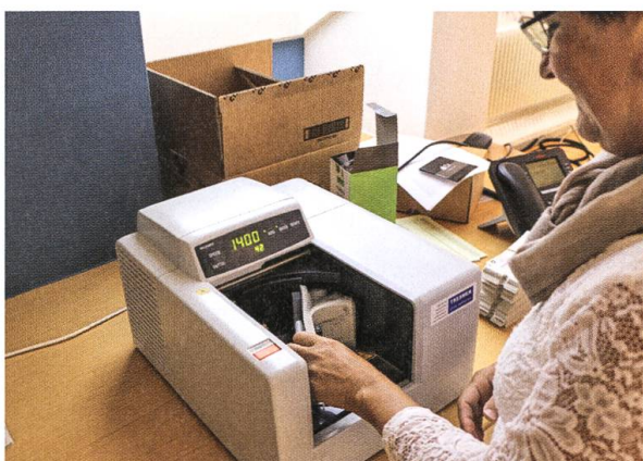
Die Zählung der Stimmzettel wird ebenfalls maschinell vorgenommen.

Das Stimmbüro sortiert die Stimmrechtsausweise und Stimmcouverts mit den Stimmzetteln auf zwei separate Stapel und zählt die Stimmrechtsausweise. Gleichzeitig werden die von den Stimmrechtsausweisen getrennten Stimmcouverts geöffnet, die Stimmzettel aus den Stimmcouverts der brieflich Stimmmenden und den Stimmcouverts aus der Urne entnommen, sortiert und gezählt. Sämtliche Stimmzettel werden nach Ja-, Nein-, leeren oder ungültigen Stimmen sortiert und das Total pro