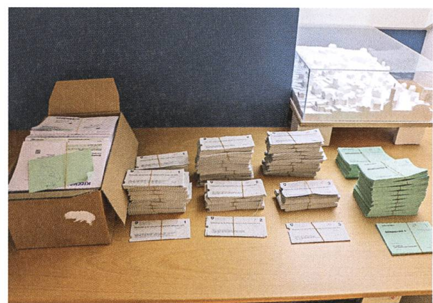
Nach der Zählung werden die Stimmzettel aufbewahrt, bis das rechtsverbindliche Ergebnis der Abstimmung feststeht.