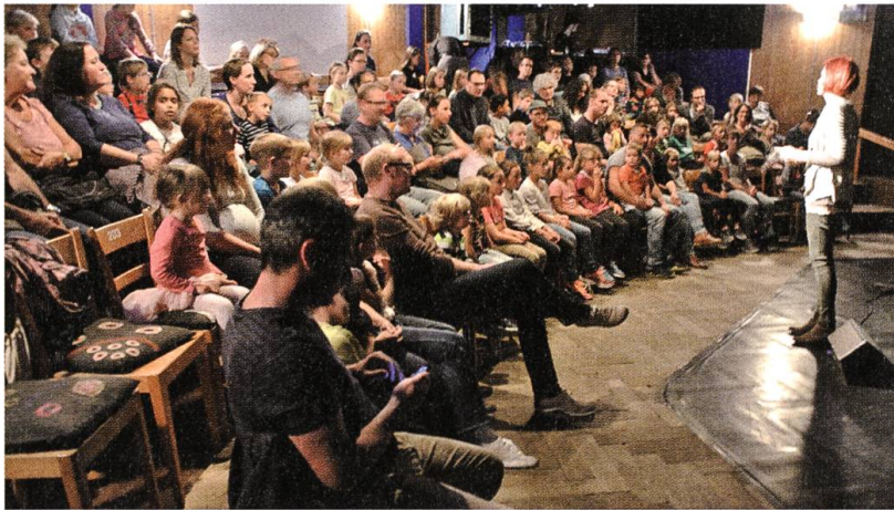
«Gofechössi»: Kindertheater im «Chössi-Theater».