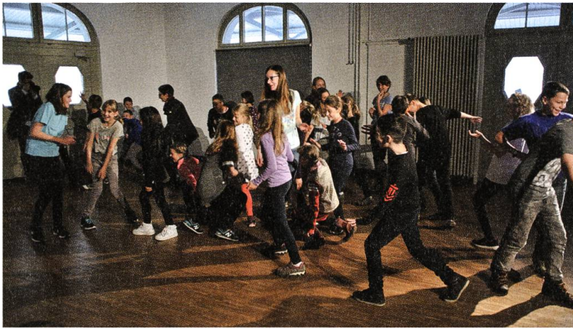
«Gofechössi»: Theaterimpuls für Schulklassen aus dem Toggenburg.