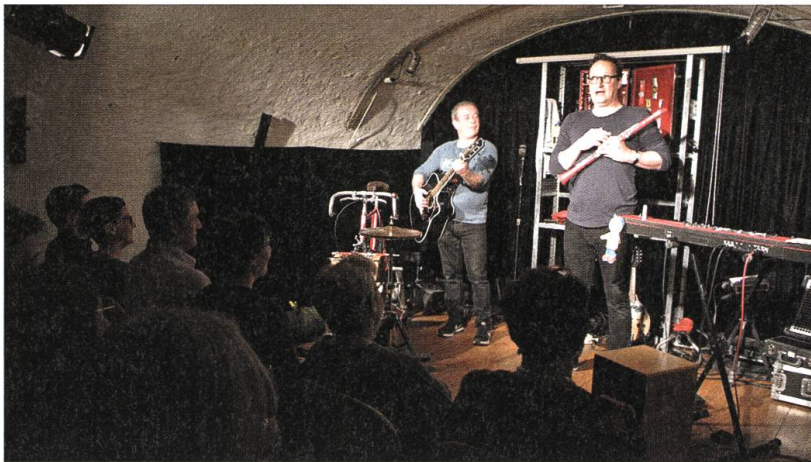
Wald-Schönengrund: Vorstellung im «Assel-Keller».