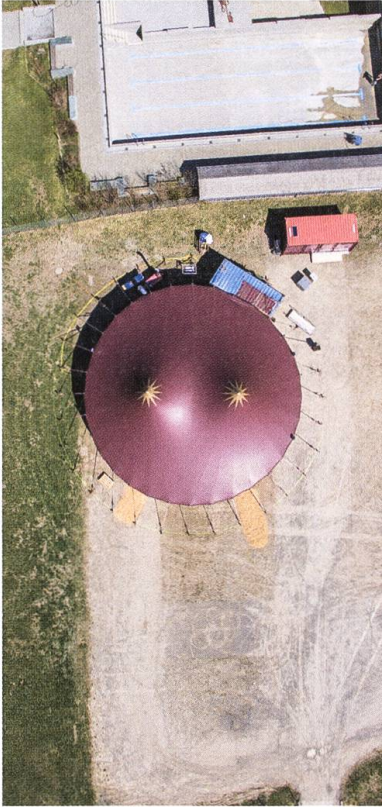
Unterwasser: «Zeltainer» von oben.