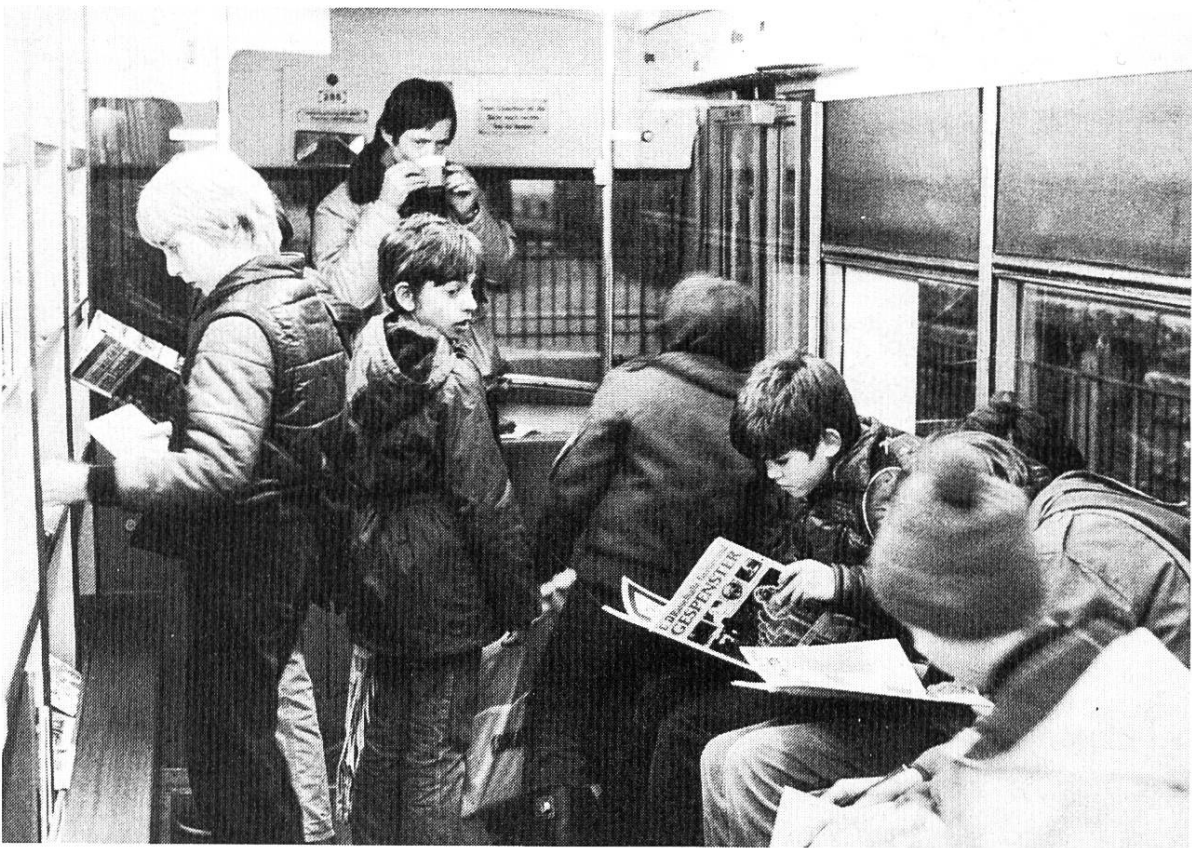
Auf allen Schulhöfen, wo der «Jugi-Bücher-Bus» mit der Jugendbuch-Ausstellung vor Weihnachten Station machte, herrschte ein lebhafter Andrang.