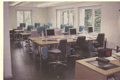
■ Eine Kursgruppe der Intensivweiterbildung an ihrem Planungstag