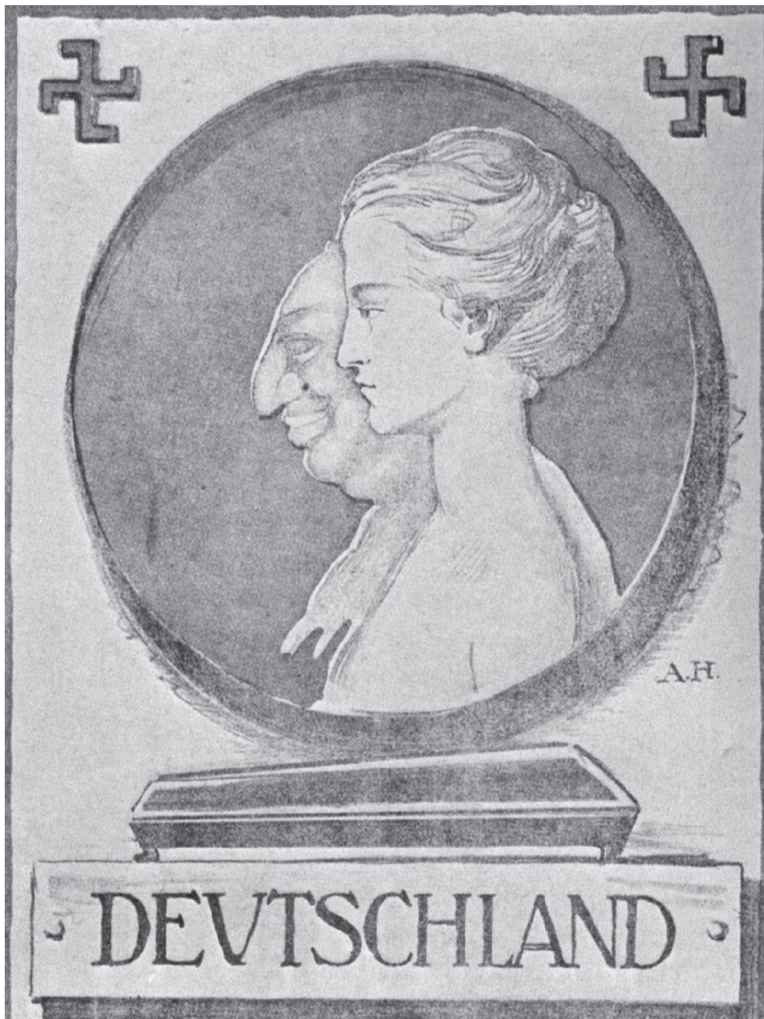
Antisemitismus und Angst vor körperlicher Fragmentierung: Wahlplakat zur Reichstagswahl, Deutschland 1920 ...