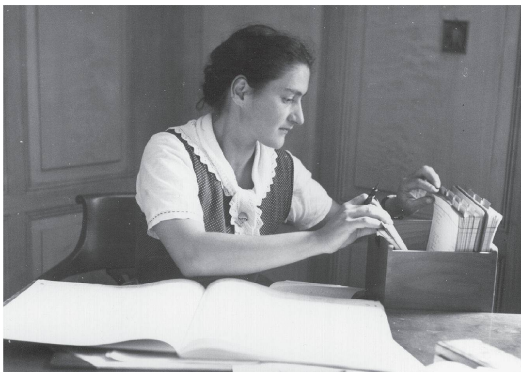
Abb. 1: «Aadorf (Thurgau), Die buchführende Bäuerin» – so untertitelt erschien dieses Foto in der zweiten Auflage von Ernst Laurs voluminöser Monographie Der Schweizer Bauer, seine Heimat und sein Werk , Bern 1947 (S. 737).

schon die häufige Praxis des Zurechtschneidens von Fotos für Publikationen erreicht viel. Solche Quellenkritik ist freilich nicht nur aufwendig, sondern häufig auch wenig erfolgversprechend. Es mag ja richtig sein, dass wir allzu oft nur sehen, was wir wollen; ebenso richtig ist aber auch, dass wir nur sehen, was wir sehen können . Und selten kommt es – wie im folgenden Fall – vor, dass eine Reihe von Zufällen uns aufdeckt, was «eigentlich» auf dem Foto zu sehen ist, wie es entstanden und wie es verwendet worden ist.