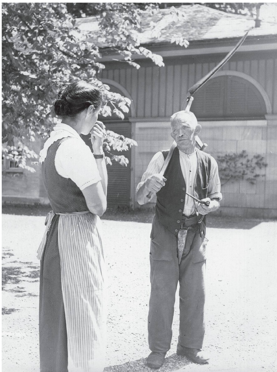
Abb. 4: «Die Betriebsleiterin gibt Anweisungen ...» Foto Theo Frey, Aadorf 1941 (Privatbesitz).

ufgwachse bin, bin ich nötig worde. Ich ha's als mini Pflicht aglueget, döt öppis us der Landwirtschaft z'mache.» Die Verwandten wurden ausbezahlt, der Betrieb – der trotz Fabrikabbruch und Reduktion des Parks ein kleiner Mittel-