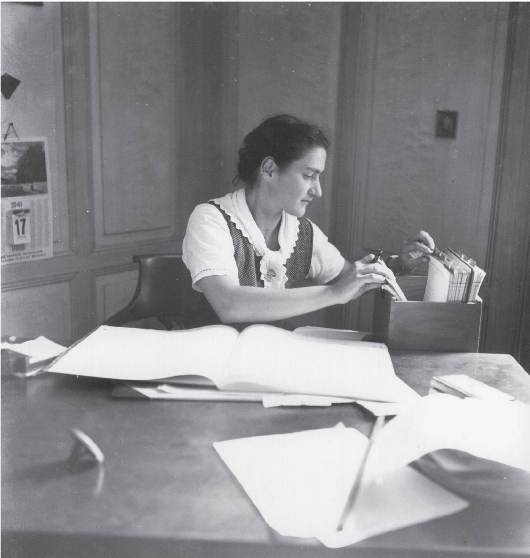
Abb. 2: Das Original. Foto Theo Frey, Aadorf 1941.

thode, rational-ökonomische Effizienz in den Bauernbetrieb zu tragen. Längst nicht mehr Subsistenz-, sondern Betriebswirtschaft zählt, und was vom Hof in die Küche kommt, wird fein säuberlich auf der Karteikarte eingetragen. Nur die Tracht signalisiert, dass eine Bäuerin abgebildet ist; wahrscheinlich ist sie Mitglied in der von Laurs Sohn präsierten schweizerischen Trachtenvereinigung. Dass der Bauernsekretär eine buchführende Frau abbildet, ist kein Zufall. Es war einerseits eine häufige Realität, andererseits wurde es auch von ihm selbst propagiert. «Würdigt besser die Arbeit der Frauen!» appellierte er 1928 in einem Vortrag an die bäuerliche Jugend. 6 Die Frauen sollten von harter Arbeit entlastet werden durch technische Einrichtungen (fliessendes Wasser, Haushaltmaschinen) und indem sie eben zum Beispiel die Buchhaltung ■ 159