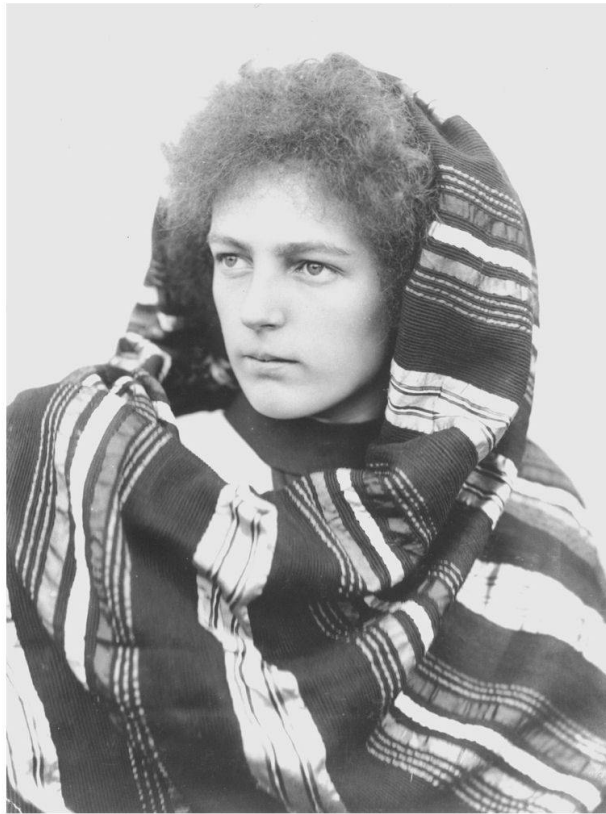
Abb. 2: Gertrud Woker, Biochemikerin (Privatarchiv, Universitätsarchiv Bern).

tisch. In der Tat lässt sich aber nachweisen, dass die Experten in einem ausgesprochenen Milizsystem wie dem schweizerischen ihren Einfluss zwar weitreichend ausüben, aber wegen des Ratifikationsvorbehalts keineswegs bindende Beschlüsse für den Staat treffen konnten. Bereits 1922 hatte nämlich das Eidgenössische Volkswirtschaftsdepartement pointiert auf die weitgehenden Handlungsspielräume der Experten hingewiesen, um gleichzeitig deren Grenzen zu unterstreichen. Der Schweizer Delegation am Internationalen Landwirtschaftlichen Institut wurde mitgeteilt, dass das Departement es nicht für nötig erachte, Instruktionen zu erteilen: «Wir stellen es den Herren anheim, zu den zur Behandlung kommenden Fragen nach freiem Ermessen Stellung zu nehmen, in der Meinung, dass für allfällige Beschlüsse, die den Mitgliedstaaten neue Verpflichtungen auferlegen, die Ratifikation durch die zuständigen Behörden vorbehalten wird.» 24