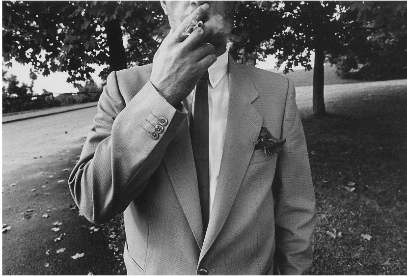
Die Letzte vor der Entlassung.