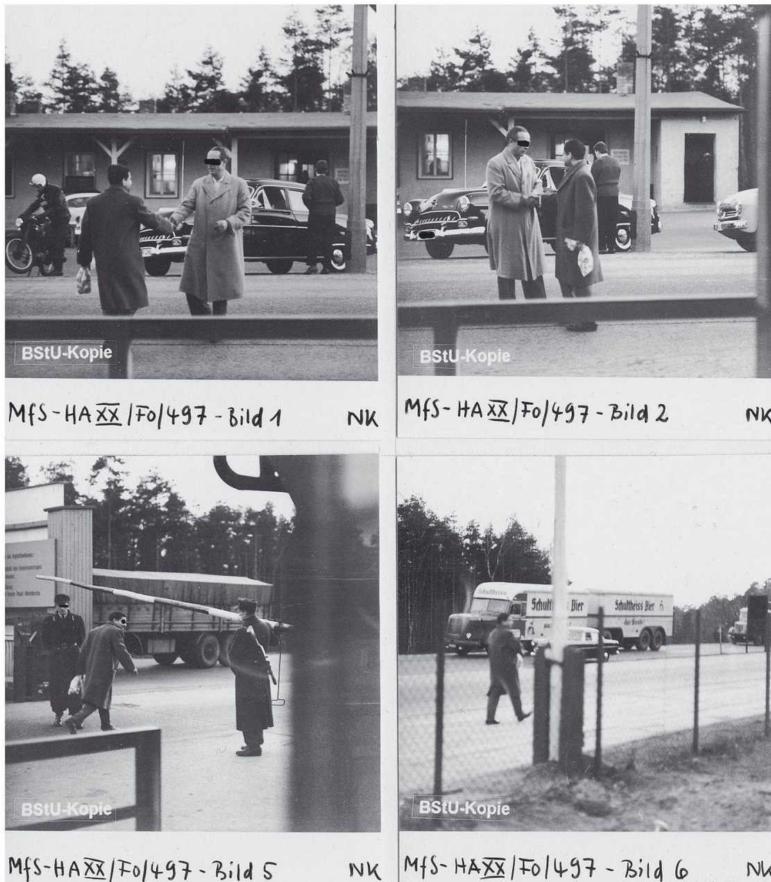
Abb. 2: Eine Fotoserie dokumentiert in acht Einzelbildern eine kurze Begegnung von zwei Männern an einer Grenzübergangsstelle.

Für die Kriminalpolizei war ihr eigener Befund bereits 1951 ein Grund, «in Zukunft weniger in den Raststätten der Autobahn» zu arbeiten, sondern «mehr die anliegenden Orte an der Autobahn» zu beschatten sowie die illegalen Abfahrtswege zu beobachten. Ab sofort sollten die wichtigsten illegalen Ab- und Zufahrten durch «Ziehung eines Grabens» gesperrt werden, um so wenigstens den illegalen Grenzübertritt mit Autos zu erschweren. 21 Überhaupt galt die Aufmerksamkeit künftig immer stärker dem «Hinterland». Das war nicht nur