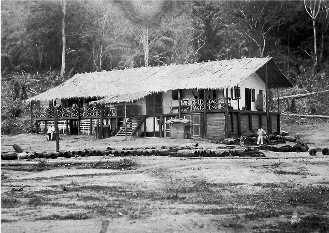
Abb. 4: Faktorei der Hamburger Reederei und Handelsfirma Woerrman am Ogowe in Gabun. Vor dem Gebäude sieht man Bündel von Fassreifen und Fassdauben. Die Fässer zum Transport von Palmöl wurden, um Platz zu sparen, erst bei Gebrauch zusammengebaut.

den Handelshäusern und den lokalen Chiefs und die Versuche, den Markt zu erobern, stärkte letzten Endes die Kräfte, die zur kolonialen Eroberung gegen Ende des 19. Jahrhunderts führten. Die landwirtschaftliche Produktion für den Export durch die Handelshäuser hatte einen tief greifenden sozialen und wirtschaftlichen Wandel zur Folge. Transportiert wurden in diesen Prozessen neben Menschen und Waren auch Vorstellungen und Wissen. Deutlich wird das etwa in der Abbildung von King Akwa, einem der Repräsentanten der Dualas in Kamerun zur Zeit der kolonialen Auseinandersetzungen zwischen Deutschland und England (Abb. 5). Vermutlich liess Akwa das Foto selbst anfertigen. Stuhl, edles Tuch, Stock, Elfenbeinreifen und Zylinder zeugen von der Würde, dem Reichtum und der Macht King Akwas. «Die Symbole der Macht [...]», so kommentiert die Historikerin Stefanie Michels, «wurden jedoch von den europäischen Beobachtern konsequent negiert beziehungsweise konterkariert. Die wirkungsvollste Strategie dazu bestand in der Erzeugung einer Groteske, über die Europäer lachen konnten. Die groteske Wirkung beruhte vor allem darauf, dass die Symbole bourgeoiser deutscher Männlichkeit schlechthin, der schwarze