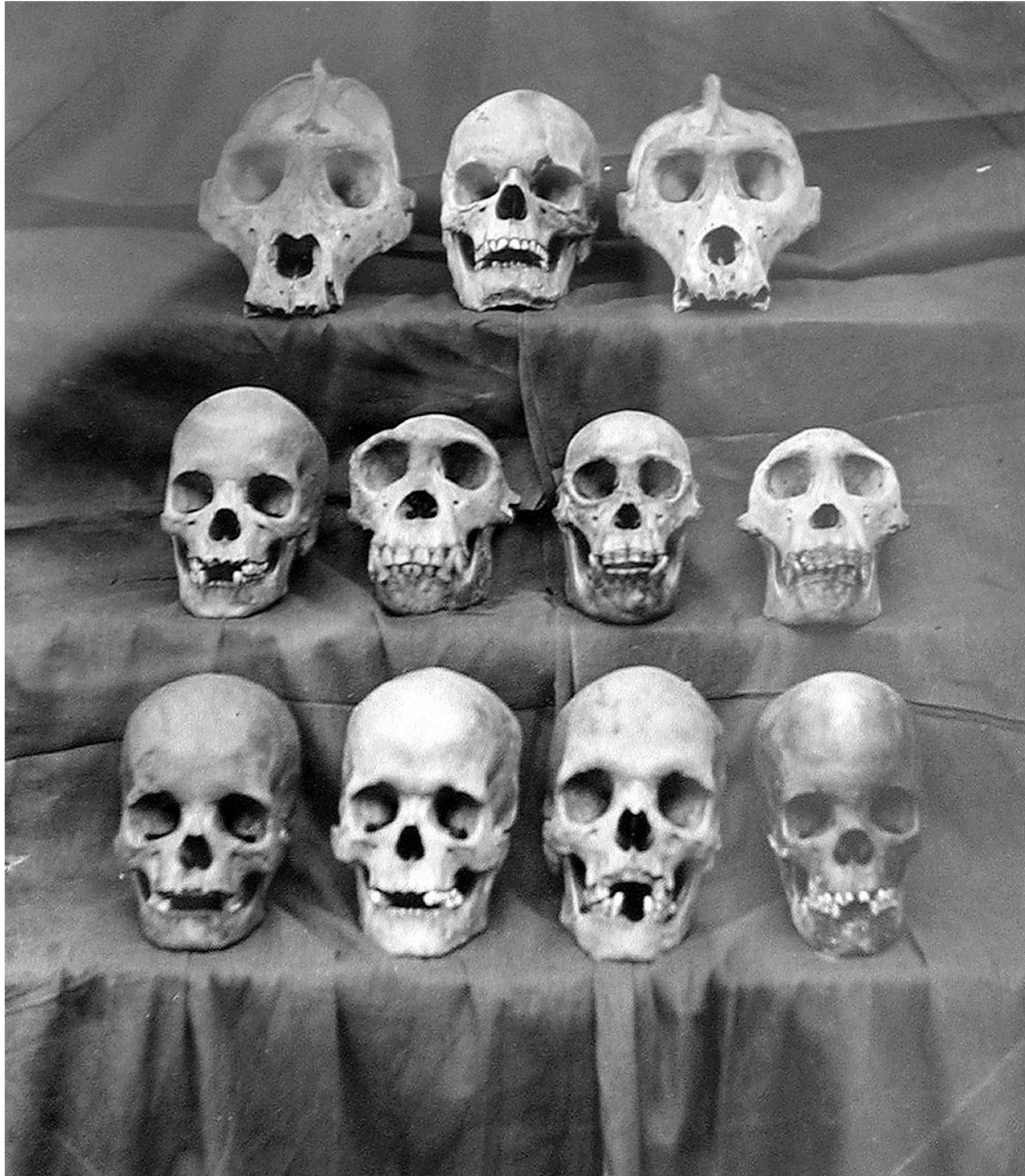
Abb. 7: Im Passavant-Album heisst es dazu: «Neger-Schädel zur Doctor-Dissertation von Karl Passavant.» In Wirklichkeit sind hier neben Menschenschädeln auch einige Affenschädel zu sehen.

der Anatomie und physischen Anthropologie – entschied sich Passavant für das Thema seiner Dissertation mit dem Titel Craniologische Untersuchungen der Neger und der Negervölker . 3 Im ersten Satz des Vorworts heisst es: «Bei einer Umschau über die auffallenden Abarten des Menschengeschlechtes, welche der afrikanische Continent beherbergt, scheint es mir geboten, dass der Craniologe seine Stellung zu der Rassenfrage darlege.» Passavant, dem Credo der Zeit folgend,