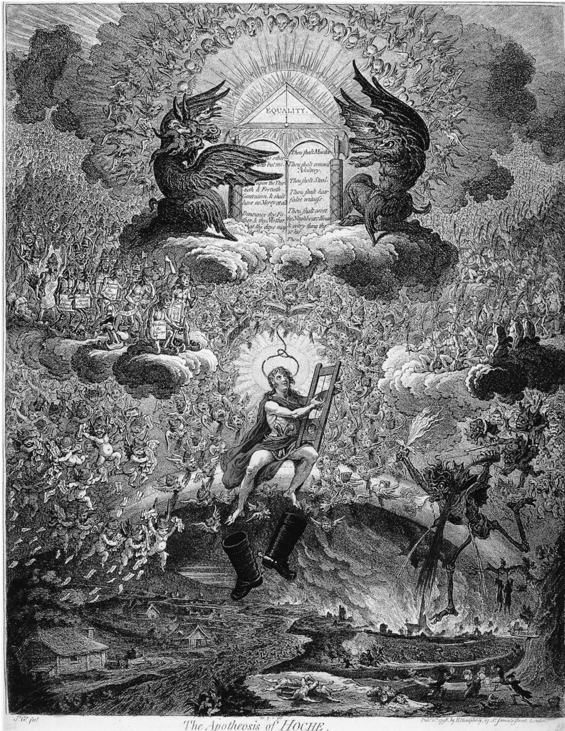
Abb. 3: James Gillray, «The Apotheosis of Hoche» (11. Januar 1798). BM 8979, London (Ausstellungskatalog) Gillray 2001, Abb. 85, S. 116.

der Betrachter eigentlich den Darstellungstypus der Apotheose, doch Gillray zielte auf Abschreckung des Betrachters durch die Metaphorik der Endzeit und der Entstehung einer neuen, bedrohlichen Weltordnung. So wird man nun mit einer Parodie des Jüngsten Gerichts konfrontiert. Der Heilige, der seine Apo-