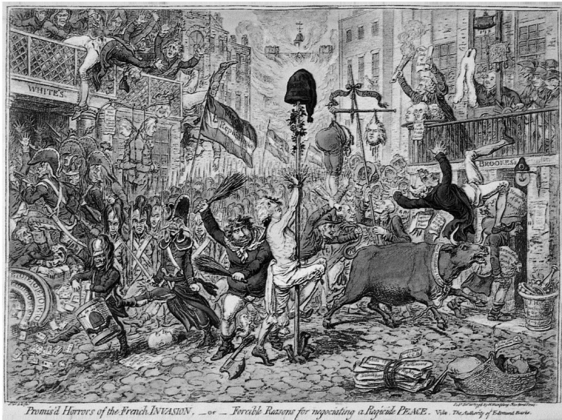
Abb. 6: «Promis'd Horrors of the French Invasion, – or – Forcible Reasons for negotiating a Regicide Peace. Vide, The Authority of Edmund Burke» (20. Oktober 1796). BM 8826, Robinson 1996, Abb. 193, S. 183.

sensation als Herausforderung betrachten würde. Die Bildsatire konnte gerade deshalb auch zum Medium eines solch überschüssenden Gewaltpotenzials werden, weil sie nicht an die Dekorumsregeln der Historienmalerei gebunden war. Sie durfte Bilder und Themen zeigen, die in der hohen Kunst keinen Platz hatten. Durch ihre Bestimmung als Gattung der Kritik und als niedere Kunst war sie an die ihr gegenwärtige Zeit gebunden, und beim Versuch, ihre Ziele zu erreichen, wurden ihr gelegentlich nur die politischen Gesetze zum Verhängnis – wie beispielsweise im Falle von Verleumdungsklagen –, nicht aber die Regeln der hohen Kunst. Ansonsten durfte die Karikatur alles darstellen, was sie wollte. Auch extreme Gewalt.