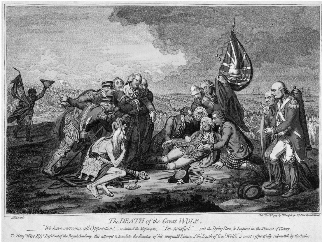
Abb. 5: James Gillray, «The Death of the Great Wolf» (17. Dezember 1795). BM 8704, Nicholas Robinson, Edmund Burke, New Haven und London 1996, Abb. 188, S. 176.

Halbkreisen um den beleuchteten Tabernakel über Hoche zu erkennen sind. Dadurch soll auf die Dummheit und Triebhaftigkeit der Menschen verwiesen werden. Aber der wirkliche Horror der Revolution wird durch die verstümmelten Leichen der gewaltsam Hingerichteten dargestellt: Hoche selbst ist umgeben von geflügelten Köpfen enthaupteter Jakobiner. Aus den Stümpfen ihrer Hälse strömt noch Blut.