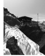
Der Berg La montagne Montagna

2008.2 Kunst + Architektur in der Schweiz Art + Architecture en Suisse Arte + Architettura in Svizzera