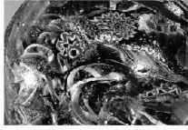
Walter Gropius L'art de vivre L'arte de vivere

2007 Kunst + Architektur in der Schweiz Art + Architecture en Suisse Arte + Architettura in Svizzera