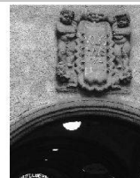
Volkshäuser – eine neue Bauaufgabe im 20. Jahrhundert Les Maisons du peuple – une nouvelle tâche architeturale a u XX e siècle Le Case del popolo – un nuovo tema progettuale del XX secolo

2009 Kunst + Architektur in der Schweiz Art + Architecture en Suisse Arte + Architettura in Svizzera