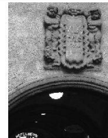
Volkshäuser – eine neue Bauaufgabe im 20. Jahrhundert Les Maisons du peuple – une nouvelle tâche architeturale a u XX e siècle Le Case del popolo – un nuovo tema progettuale del XX secolo

2009 Kunst + Architektur in der Schweiz Art + Architecture en Suisse Arte + Architettura in Svizzera