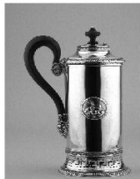
Wissenschaft und Praxis Recherche et pratique Ricerca e pratica

2008 Kunst + Architektur in der Schweiz Art + Architecture en Suisse Arte + Architettura in Svizzera