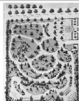
Animal Farm Architektur für Tiere L'architecture pour les animaux L'architettura per gli animali

2008 Kunst + Architektur in der Schweiz Art + Architecture en Suisse Arte + Architettura in Svizzera