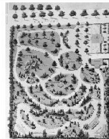
Animal Farm Architektur für Tiere L'architecture pour les animaux L'architettura per gli animali

2008 Kunst + Architektur in der Schweiz Art + Architecture en Suisse Arte + Architettura in Svizzera