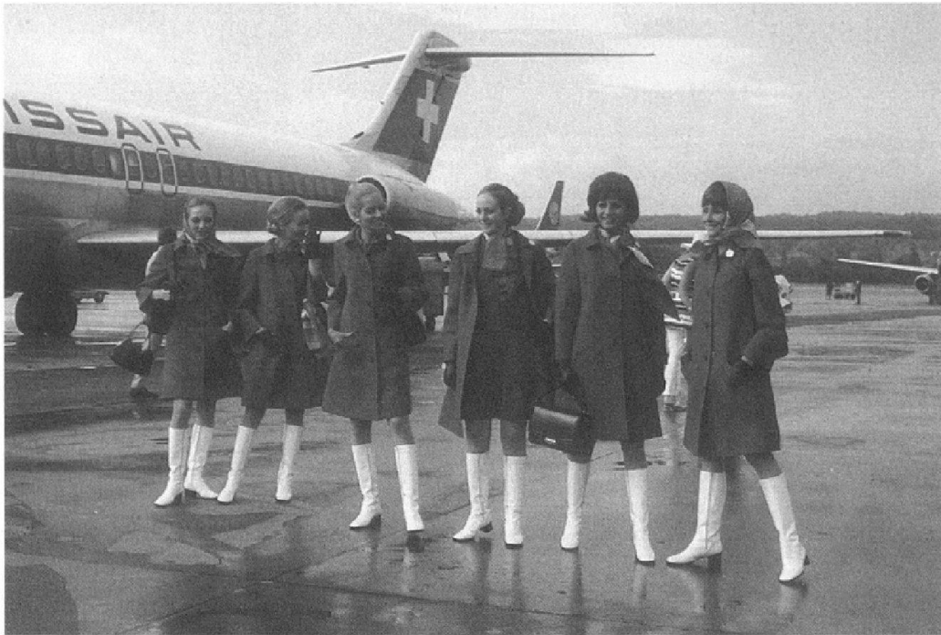
Abb. 4: Für den Ringier Bilderdienst fotografierte Reto Hügin am 30. Juni 1970 die neuen Swissair-Uniformen. Dazu liess er sechs Flugbegleiterinnen an unterschiedlichen Lokalitäten im Flughafen Zürich posieren.