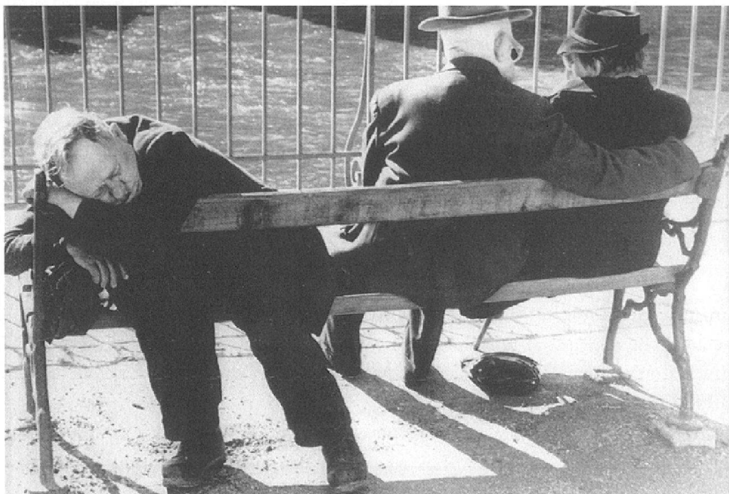
Abb. 1: Im Teilbestand «Allgemeine Themen» des Bestandes «Allgemeines Archiv», das Aufnahmen von 1940–1980 enthält, sind die sogenannten Symbolbilder oder Stockfotografien abgelegt: Zwischen den Albinos und dem Antisemitismus finden sich 17 Dossier zum Thema «Alte Menschen». Die Unterteilung unterscheidet Männer und Frauen alleine und in Gesellschaft, bei Tätigkeiten wie Arbeit oder Reisen. Die Abbildung stammt aus dem Dossier «Männer allein» trägt aber auf der Rückseite zudem den Vermerk «Alte Menschen allgemein M + F». Das Bild weist wie die meisten Symbolbilder keine Angaben zum Entstehungsort und -datum auf. Es findet sich hingegen der Hinweis, dass diese Fotografie in «Ringiers Unterhaltungsblättern», Nummer 7, Seite 34, abgebildet wurde, wobei die Jahresangabe fehlt.

Für die Agentur- und Pressefotografie sind nicht nur Aufnahmen von politischen, wirtschaftlichen und kulturellen Ereignissen und Repräsentanten relevant, sondern ebenso und insbesondere Sportfotos sowie Aufnahmen vom Alltagsleben und gesellschaftlichen Phänomenen. Zudem gehört zu jeder Bildagentur ab den 1970er-Jahren ein Teil an Stockfotografie oder Symbolbilder, die scheinbar «zeitlos» abstrakte oder allgemeine Themen wie Jahreszeiten, Natur, Geld, Hochzeit, Homosexualität, verschiedene Typen Menschen wie alte Menschen, Mütter, Kinder und so weiter darstellen und daher multipel einsetzbar sind. 3