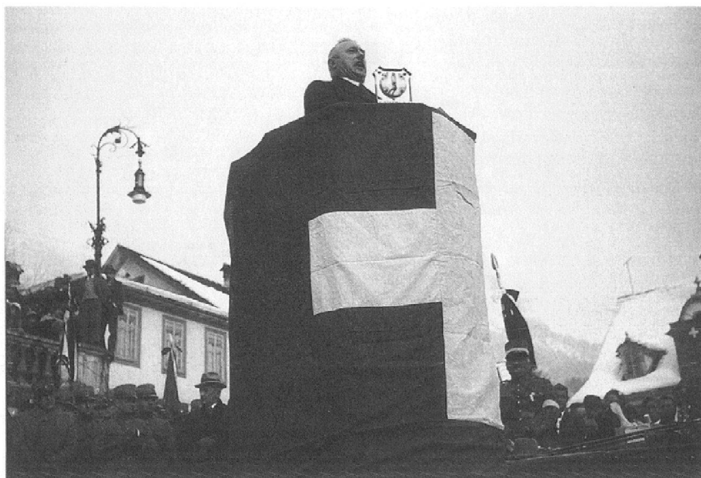
Abb. 3: Der Fotograf Heinrich Weiss des ATP-Bilderdienstes fotografierte bei seiner Reportage zum Patrouillenlauf der 5. Division in Schwyz 1935 nicht nur laufende Soldaten und ranghohe Militärs, sondern auch Bundespräsident Rudolf Minger (BDP), der die Ansprache hielt. Von den 34 Aufnahmen zeigen zehn die Ansprache, wobei vier Bilder die Gesamtszene abbilden und sechs den Bundesrat wie hier gezeigt in Szene setzen.

die Ringier AG integriert. Der Bilderdienst diente in erster Linie der Belieferung der eigenen Medien mit Fotos und erst in zweiter dem Bildverkauf an Dritte, weshalb der interne Bildgebrauch sich prägend für das Archiv auswirkte. 1980 legte Ringier die Bildarchive aus den verschiedenen Redaktionen zusammen und führte fortan die Ringier Dokumentation Bild (RDB) als Teil des Ringier Dokumentationszentrums (RDZ). 1983 wurde die RDB mit dem Bestand der Berner Fotoagentur Omnia und einzelnen Fotografennachlässen ergänzt. Als Redaktionsarchive können heute nur noch die Bildbestände der Wirtschaftszeitung Cash und des Blicks gelten. So entstand eine Mischung aus Bildagenturen und Redaktionsarchiven. Die Bewirtschaftung der RDB richtete sich vor allem an pragmatischen und praxisbezogenen Anforderungen aus und dokumentiert so die Entwicklung der Bildbewirtschaftungstechniken – von alphabetisch nach Schlagwörtern abgelegten Beständen, über Karteikartenerfassung hin zur Metadatenbank und schliesslich zur Bilddatenbank. Mit diesen Merkmalen dokumentiert das RBA nicht nur eine lange Zeitspanne der Schweizer Pressefotografie, es gibt auch Aufschluss über die Arbeitsweise mehrerer Fotoagenturen und der 10 von ihnen beschäftigten Fotografen.