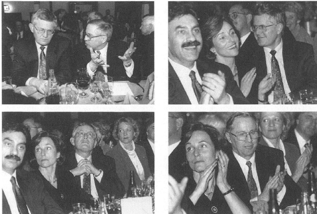
Abb. 5: Die «Blick»-Fotografin Sabine Wunderlin fotografierte 1995 die Albigüetli-Tagung der SVP, an der Bundesrat Kaspar Villiger teilnahm. Von der Reportage wurden vier Aufnahmen vergrössert und im Dossier «Politische Bewegungen» abgelegt: eine Aufnahme zeigt Christoph Blocher im Gespräch mit Bundesrat Villiger, auf zwei Bildern ist Bundesrat Villiger während Blochers Rede abgebildet und auf einer weiteren Blocher während Villigers Rede. Die Fotografin hat die beiden bewusst nicht nur als Redner, sondern ebenso als Zuhörer fotografiert: der Beifall klatschende Christoph Blocher und der nach oben oder zur Seite schauende Bundesrat Villiger.

mit spezialisierten Institutionen und Universitäten sowie mit andern öffentlichen und privaten Eigentümern von schweizerischen Fotoarchiven.