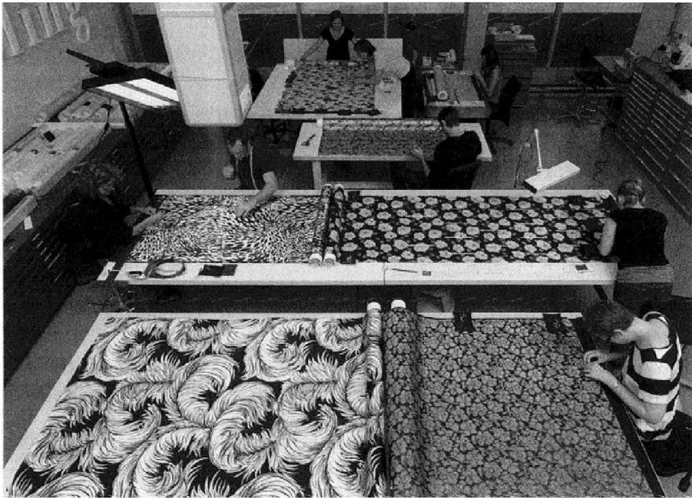
Abb. 5: Konservatoren-Restauratoren bereiten die Seidenstoffe für die Ausstellung «Soie Pirate. Textilarchiv Abraham Zürich» vor und machen sie montagefertig.

zu beschädigen. Anschliessend werden die Objekte für den Transport bereitgestellt. Die Objektlogistik erstellt Transportgebände, damit die Objekte sicher transportiert werden können. In den Ausstellungsräumen sind wiederum die Konservatoren-Restauratoren verantwortlich für die sichere und gleichzeitig möglichst unsichtbare Objektmontage. Kleider, wie der Mantel der kürzlich verstorbenen Emilie Lieberherr, werden auf Büsten montiert um sie angemessen zeigen zu können, ganz nach dem Motto presentation is everything . Im Museum kommt vor und nach der Präsentation aber immer wieder die Aufbewahrung. Damit auch künftige Generationen ihre Geschichte in Ausstellungen präsentieren können.