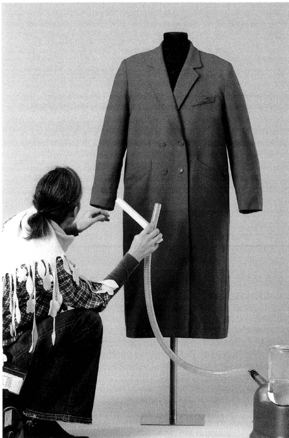
Abb. 6: Der Mantel der kürzlich verstorbenen Emilie Lieberherr wird im Fotostudio auf eine Büste montiert und gereinigt.