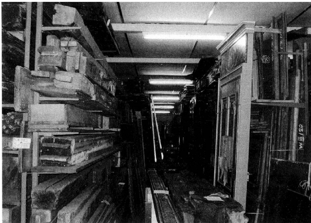
Abb. 2: In den ehemaligen Objektdepots waren die Platzverhältnisse so eng, dass der Zugang zu den Objekten nicht immer gewährleistet war.

rung der Situation notwendig. 5 Ziel war es, die Sammlungsbestände an einem Ort unter guten konservatorischen Bedingungen zu konzentrieren. Ausserdem sollten die Arbeitsplätze der Konservierung, der Konservierungsforschung, der Logistik und der Registrierung möglichst in der Nähe sein.