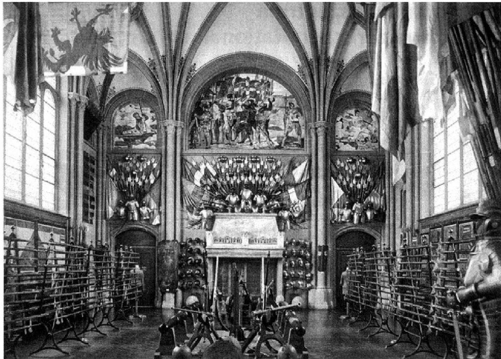
Abb. 1: Mit der gewaltigen Waffeninszenierung der Waffenhalle um 1900 wird auch die Grösse der Sammlung gezeigt.