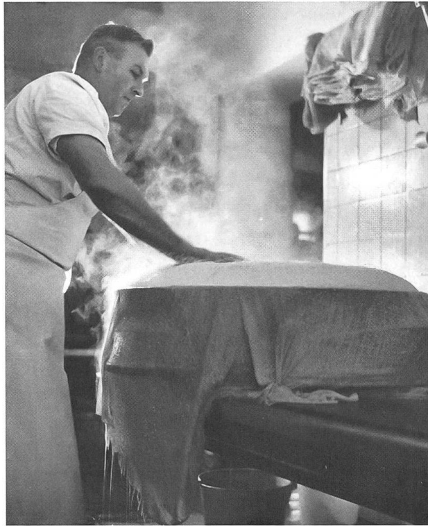
Abb. 5: Formen der Käsemasse im Järb.

In einer hölzernen Form, dem Järb, wurde die Käsemasse mithilfe eines Schraubstocks gepresst und dabei mehrmals gewendet. Dadurch wurde der Wassergehalt der Käsemasse korrigiert, indem die Restflüssigkeit, die Sirte, ablaufen konnte. Je kleiner die Bruchstücke – das heisst, je besser die Arbeit des Käser – desto weniger Flüssigkeit blieb zurück. Das Resultat war ein fester Laib. Auch hier fokussiert die Darstellung auf der Präzision, dem Einsatz, der Handarbeit: Der Käser verteilt die noch heisse Käsemasse sorgfältig, mit konzentriertem Gesichtsausdruck, im Järb. Hingegen wird in Kauf genommen, den Eindruck von Sterilität zu verlieren. Die auslaufende Sirte fliesst ungezügelt ab, scheint nur ungenügend aufgefangen zu werden.