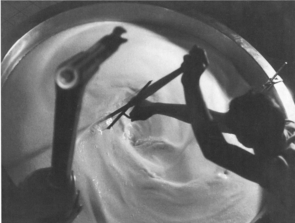
Abb. 3: Blick auf das Käsekessi.

fassenden Gefäss – erwärmt. Durch Beigabe von Labkulturen gerann die Milch und trennte sich in die feste Käsemasse und die flüssige Molke. Die Fotografie fängt den Moment ein, als der Käser beginnt, die Masse in gleichmässige Teilchen aufzubrechen. Er verwendete dazu eine Käseharfe, ein Utensil mit vertikal gespannten Drähten. Das Bild inszeniert die Präzision und Konzentration, welche die Käsefabrikation verlangte. War die Rohmilch als einwandfrei befunden worden, hing der weitere Erfolg nun vom Können des Käasers ab: Er züchtete die Labkulturen selbst und war für die Auswahl der richtigen Kultur verantwortlich. 8 Er hatte die Temperatur und den Zustand der Milch konstant zu überwachen und gleichzeitig die nötigen Arbeiten auszuführen. Der Blick von oben auf das Kessi demonstriert, was auf dem Spiel stand: Unterlief ein Fehler, waren Hunderte Liter Milch verloren.