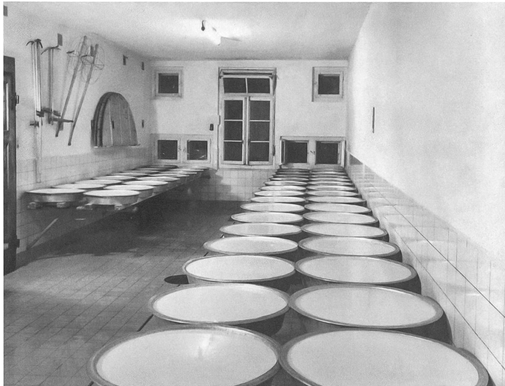
Abb. 2: Reifen der Milch in Gebesen.

war die Milch, wenn sie einen optimalen Fett- und Eiweißgehalt aufwies, möglichst frei von Schmutz, Keimen und Medikamenten war und von Kühen ohne Silofütterung stammte. Diese Anforderungen wurden in dem von Bund und Verbänden herausgegebenen Milchlieferungsregulativ definiert. 6