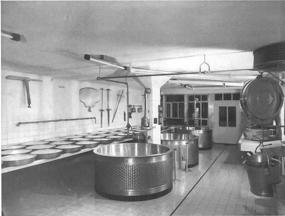
Abb. 1: Fabrikationsraum einer Käseerei. (Diese und alle folgenden Fotografien sind undatiert. Aufgrund eines Vergleichs mit datierten Bildern ähnlicher Sujets, sowie aufgrund der dargestellten Gerätschaften, Techniken und Personen ist ein Aufnahmedatum in den 1950er- oder 60er-Jahren anzunehmen)

frühen 1960er-Jahre waren eine Phase der intensiven Käsereimodernisierung. 5 Sie dokumentieren daher auch Verfahren und Gerätschaften, welche kurz darauf neuen Technologien Platz machten.