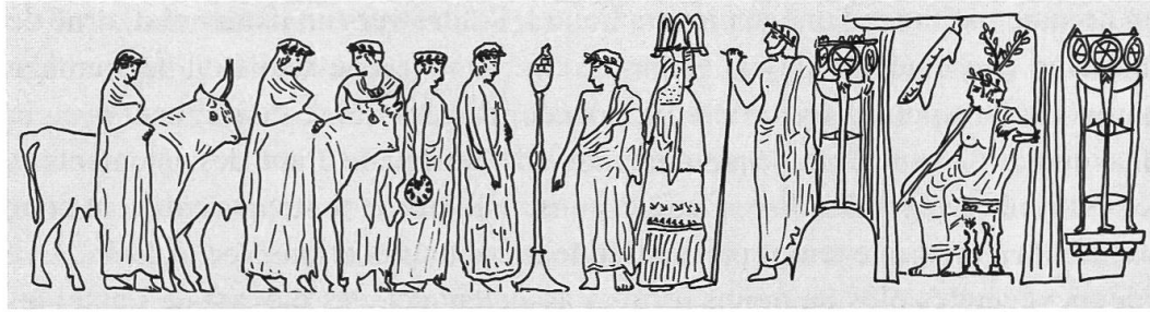
Fig. 1: Cratère attique à figures rouges du peintre de Kléophon, vers 440–425 (ARV 2 1143/1). (Musée de Ferrare, T 57 c VP. Dessin: Véronique Mehl)