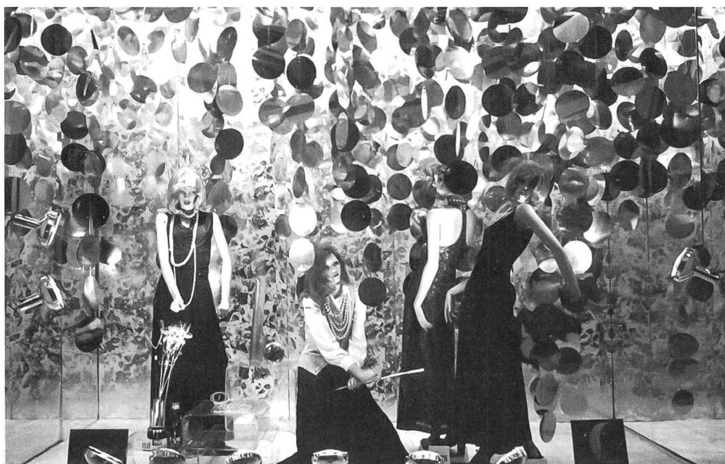
Fig. 3: Galleries Lafayette, Paris, vitrine «Noël», 1972.

portés par les mannequins, le Printemps plonge régulièrement ses vitrines dans des bains de couleurs éblouissantes qui éclaboussent les trottoirs du boulevard Haussmann (Printemps, L'Ultra court , mars 1966). Aux Galleries Lafayette, l'équipe de Jean Adnet utilise fréquemment de grands tirages photographiques aux lignes contrastées et aux nuances parfois inversées, pour mieux camper un décor très présent qui bouscule le passant nonchalant (GL, Ici galleries... à vous New York , juillet 1956). Le verre, le grillage métallique, la cellophane, la tôle perforée, l'aluminium introduisent des effets étincelants aux accents futuristes comme par exemple dans le décor imaginé en 1958 par Georges Douking pour mettre en valeur les flacons de parfum Weil, une composition qui servira de modèle à toute une génération d'étalagistes. 44