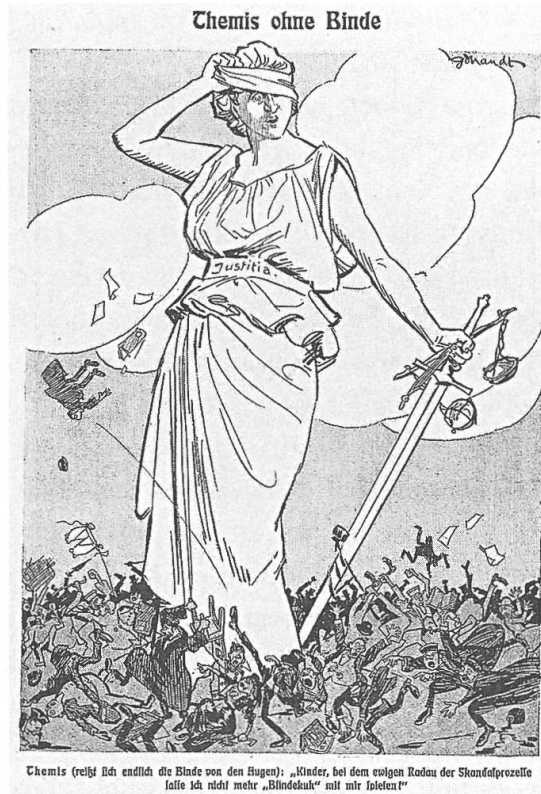
Abb. 4. Der Eulenburg-Skandal zerreißt die deutsche Gesellschaft, aber auch die europäischen Nationen in sich bekämpfende Deutungsgemeinschaften.