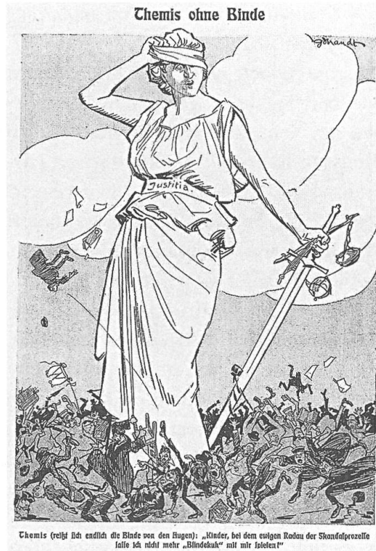
Abb. 4. Der Eulenburg-Skandal zerreißt die deutsche Gesellschaft, aber auch die europäischen Nationen in sich bekämpfende Deutungsgemeinschaften.