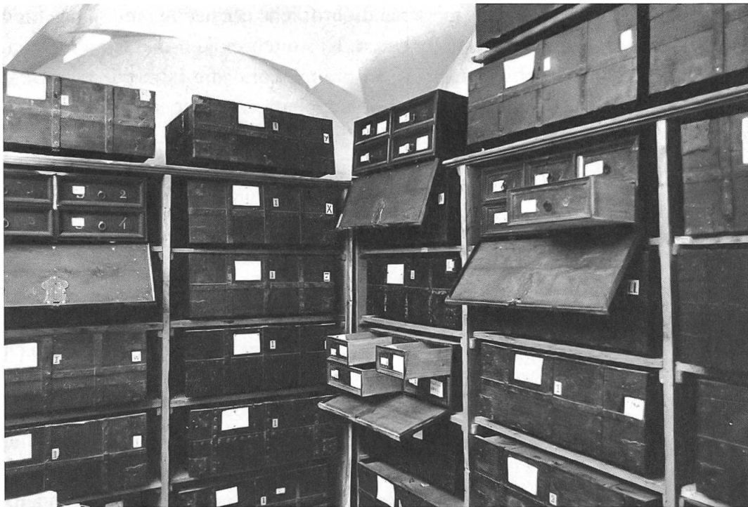
Abb. 1: Die Fluchtkisten von 1730 dienten bis 1978 zur Aufbewahrung der Urkunden.