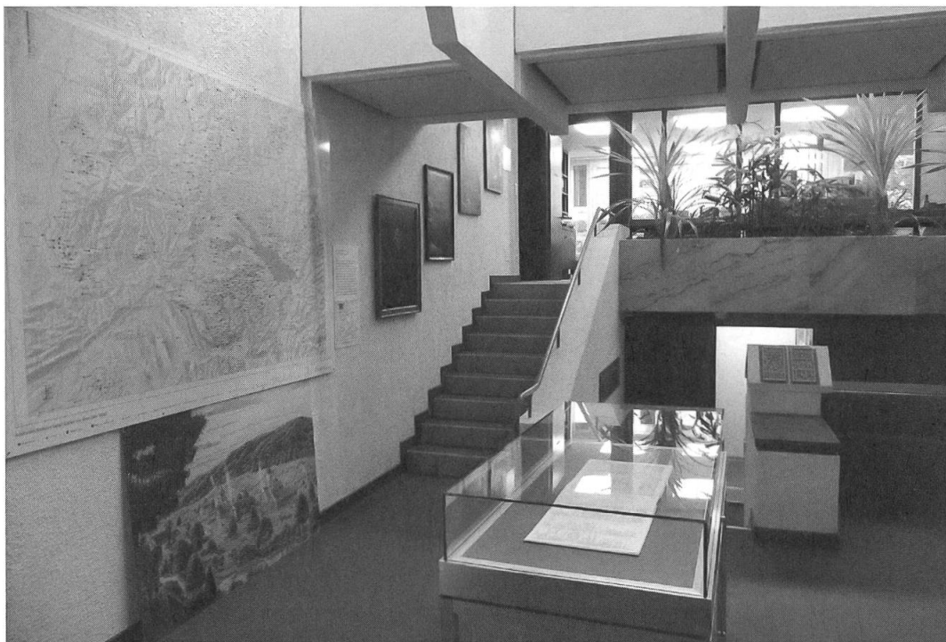
Abb. 4: Das Stiftsarchiv St. Gallen im Nordflügel des St. Galler Regierungsgebäudes, wo das wertvolle Erbe seit 1978 untergebracht ist.