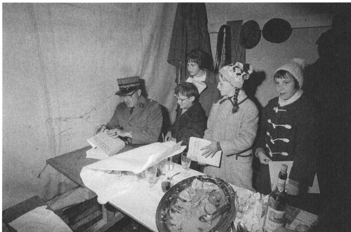
Abb. 9: Preisverleihung an der Schlachtjahrzeit am 15. November 1965.

gedeutet werden. Wehrhaftigkeit wurde angesichts nuklearer Bedrohung mit Hellebarden in Kinderhand beschworen, nationale Gemeinschaftsgefühle mit dem Sternmarsch zum historischen Ort anschaulich gemacht. Der Bedarf nach positiver Darstellung der Armee war angesichts der Affäre um die Beschaffung der Mirage-Kampfflugzeuge vorhanden. 25