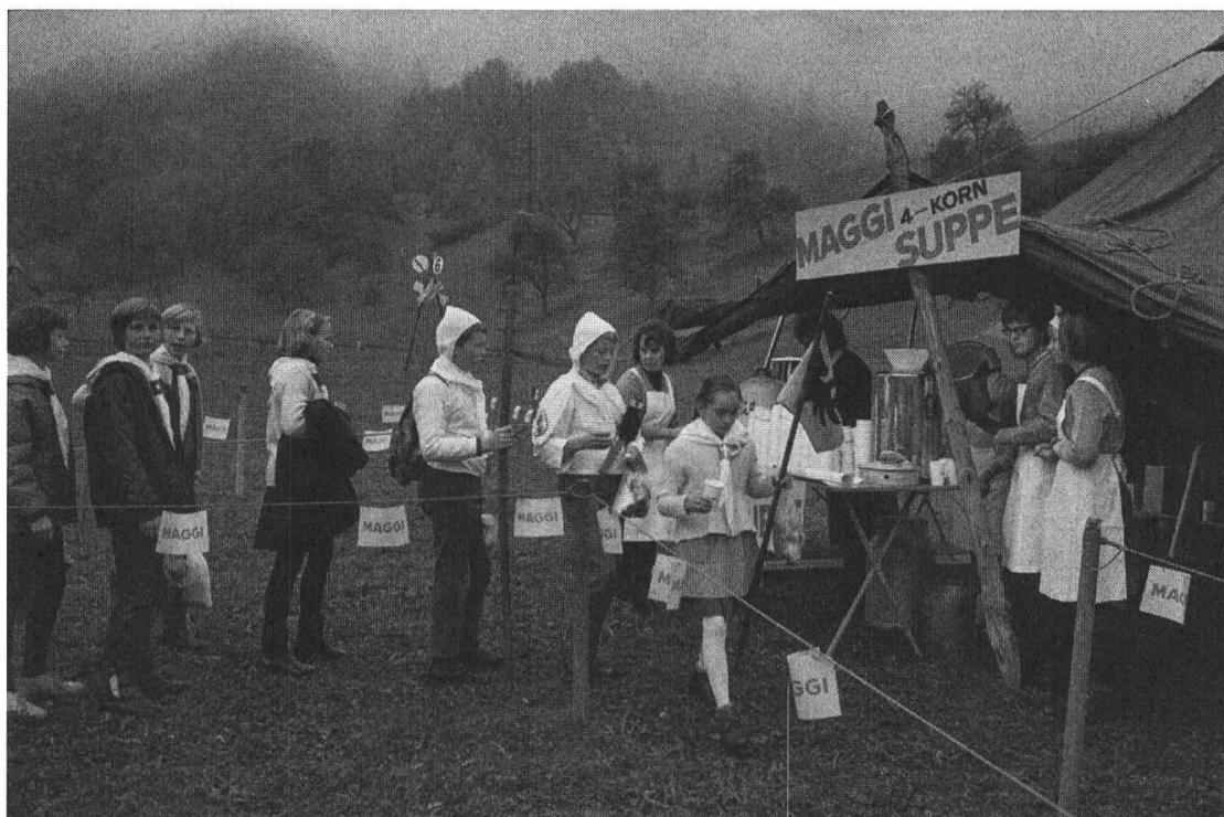
Abb. 3: Suppenausschank, 20./21. Oktober 1965.

Am Strassenrand sind Privatwagen sowie zwei Militärfahrzeuge mit uniformierten Fahrern parkiert. In diesen Tagen baute die Armee eine Waffenschau in der Schornen auf, auf der sie zeitgenössische und nachgebaute mittelalterliche Waffen ausstellte. Die Verpflegungsstellen für die Schuljugend auf dem Sternmarsch würden «in unmittelbarer Nähe der vorgesehenen Waffenschau» 12 gebaut, betonte die Firma Maggi vor dem Anlass. Am Sternmarsch von 1965 ist die Schuljugend sowohl Adressat einer Geschichtsinszenierung, die an Wehrhaftigkeit appelliert, als auch ein inhaltliches Motiv, um die eigene ruhmvolle Vergangenheit vor Ort zu feiern – und wirkmächtige Bilder dieser Feier zu produzieren.