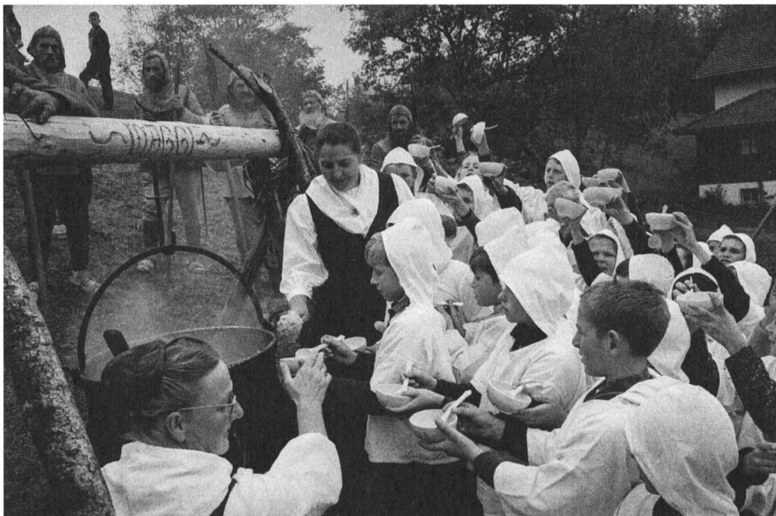
Abb. 1: Maggi-Brei für die Schuljugend, vermutlich 20. Oktober 1965.

genutztes Mittel zur sogenannten «Rettung» dieser Orte. Auf den Erwerb folgten Neugestaltung und Inszenierung. So geschehen erstmals 1859 für das Rütli, 1879 für die Tellskapelle oder 1934 für die Hohle Gasse. Die Bedrohungen, vor denen diese historischen Orte geschützt werden sollten, waren im Verständnis der Zeitgenossen Spekulation, Verschandelung und paradoxerweise – schliesslich handelte es um Ausflugsziele – Tourismus. Ein Engagement der Schuljugend versprach Legitimität für das «Rettungsvorhaben» und erlaubte es, mit einer Kinderschar an historischen Orten die Schweiz als Nation mit Vergangenheit und Zukunft zu feiern. 4