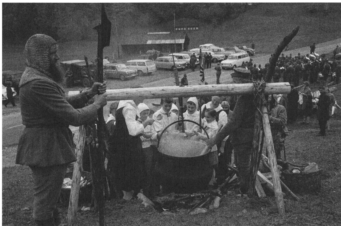
Abb. 2: Feuerstelle mit Hellebardenträger, vermutlich 20. Oktober 1965.