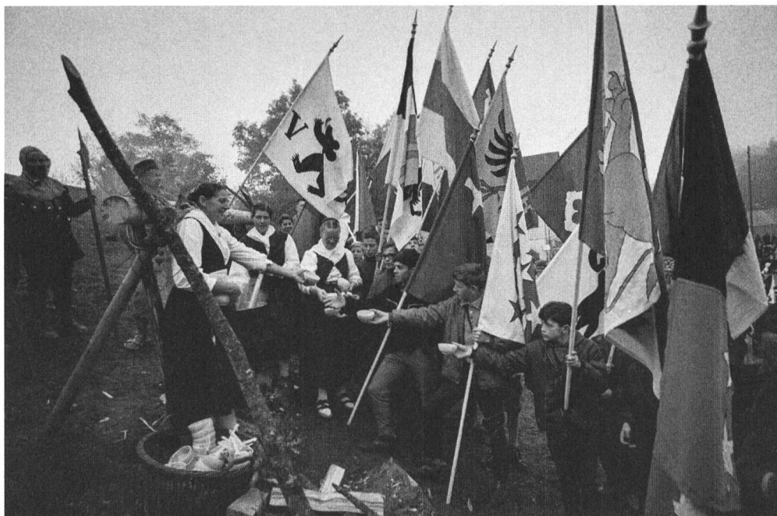
Abb. 7: Bannerträger, 21. Oktober 1965.

garten «Maggigarten» genannt. 14 Wurden Kommerzialisierung und nationales Erinnern tatsächlich als Gegensätze empfunden? Oder bauschte «Die Woche» das Thema Reklame unverhältnismässig auf? Mit der Inszenierung als Nahrungslieferant der Hirtenkrieger und ihrer Nachfahren schrieb sich die Firma Maggi in die Befreiungsgeschichte ein. 15