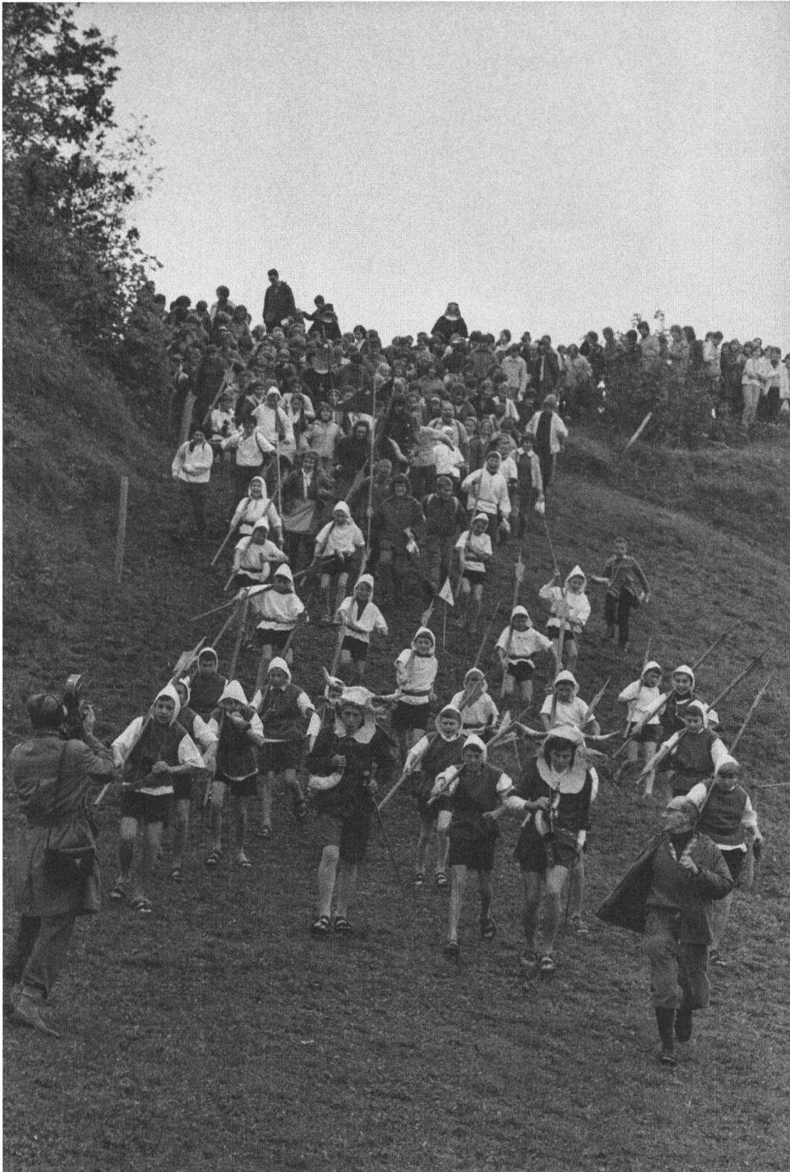
Abb. 4: Jugendlandsgemeinde, 21. Oktober 1965.