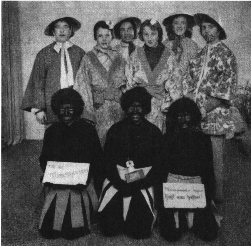
Abb. 2: Gruppenfoto verkleideter Kinder in Das kleine Bethlehem. Kindermonatsschrift der Missionsgesellschaft Bethlehem 2, Immensee 1962, 24.

katholischen Fastnachtskultur die Verbreitung rassistisch-kolonialer Vorstellungen und schuf dementsprechend eher Distanz als Nähe. In den 1950er- und 1960er-Jahren, also in der Hochphase der Dekolonisationsbewegung, lassen sich dabei Spannungsverhältnisse im missionarischen Kulturtransfer in die Schweiz nachvollziehen: Die notwendigen Anpassungen an veränderte geopolitische Verhältnisse geriet mit der funktionalen Dimension der missionarischen Öffentlichkeitsarbeit in Konflikt. Während beispielsweise die rassistische Bezeichnung für die afrikanische Figur gegen Ende der 1960er-Jahre vereinzelt durch den Begriff «Afrikanerli» ersetzt wurde, blieben die Darstellungsweisen inhaltlich persistent. Die «Propagandakommission» der Missionsgesellschaft Bethlehem diskutierte zwar 1966, ob es «eigentlich anstössig sei», dass sich die Kinder derart verkleideten, kam aber zum Schluss, «solange es noch Kolonialwaren gibt», könne auch die missionarische Sammlung weiter durchgeführt werden. 18 Die Kontinuität der Stereotypisierungen lag also vornehmlich in der intendierten Wirkung missionarischer Fastnachtskampagnen begründet: Um die Spendenbereitschaft der Katholikinnen und Katholiken zu aktivieren, die Faszination für