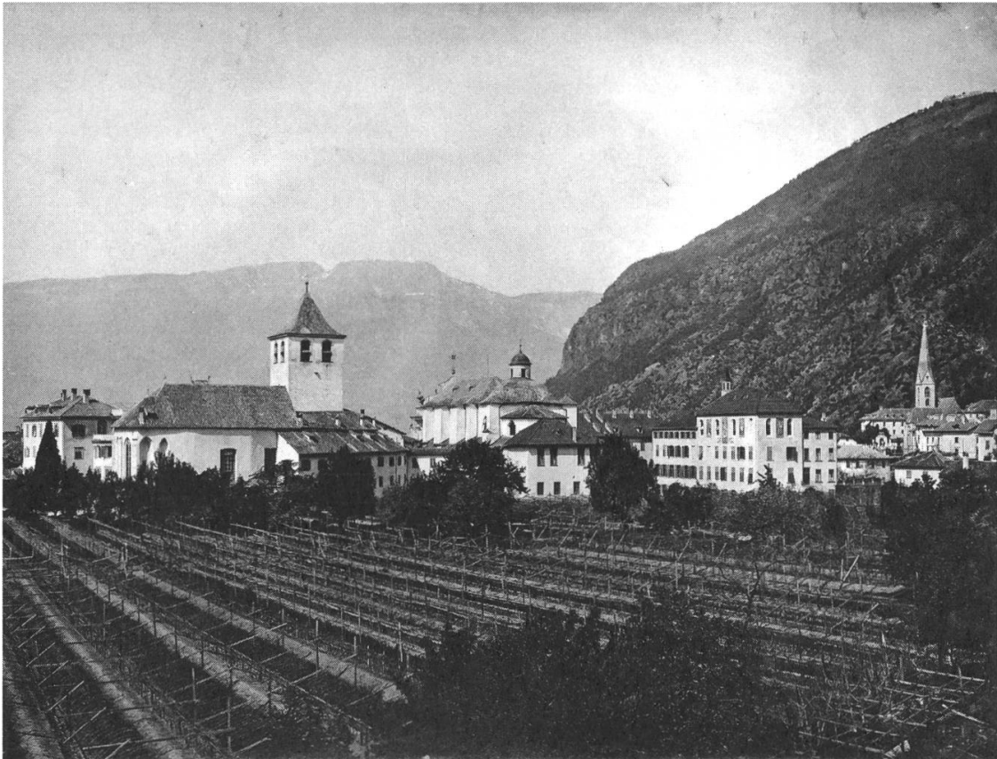
Abb. 4: Kloster Gries mit Weingarten, Stiftskirche, Pensionat und alter Pfarrkirche (von links nach rechts).

mehr Schüler aufgenommen werden. Insofern entwickelte sich im Laufe des 19. Jahrhunderts wieder eine prosperierende Klosterwirtschaft. 46