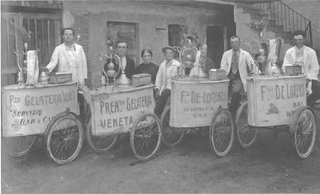
Abb. 7: Lastendreiräder für den Direktverkauf: Eismobile in Norditalien, frühes 20. Jahrhundert. (Dietmar Osses: Eismacher – Harte Arbeit für süsse Momente, in: LWL-Industriemuseum [Hg.], Wanderarbeit. Mensch – Mobilität – Migration. Historische und moderne Arbeitswelten, Essen 2013, 70–82, hier 75)