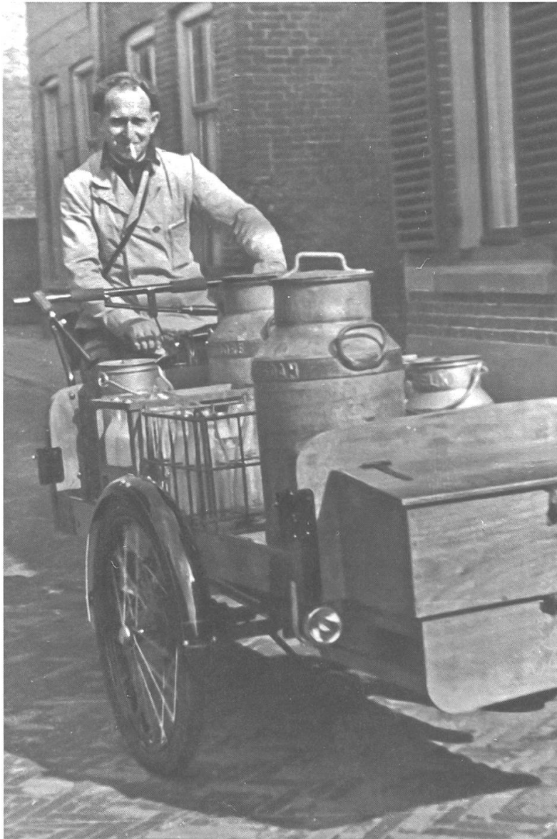
Abb. 9: Zustellung von Molkereiprodukten per Lastenrad, Ameide, Niederlande, 1950er-Jahre. (Nieuwsblad van de Historische Vereniging Ameide en Tienhoven, 2015-3, 34)

sind bislang nur schwer einzuschätzen. Dies gilt auch für die täglich im gewerblichen Gebrauch zurückgelegten Distanzen. Werbeanzeigen begründen erhöhte Zuladungsmöglichkeiten damit, dass auf diese Weise auf einer Tour zusätzliche Kunden bedient werden könnten. Ihre Gesamtlänge dürfte je nach Bedarf erheblich variiert haben. 34 Bei dem flottenmässigen Einsatz von Lastenrädern, insbesondere für die Post- und Milchbelieferung, ist von festen Tagestouren auszugehen. Für sehr schwere Lasten, beispielsweise den Transport von Bauteilen für Kachelöfen, gab es zuweilen Zuschläge. 35 In den Städten boten für das Kleingewerbe ebenso wie für eine pferdebasierte Infrastruktur genutzte Hinterhoflandschaften mit Schuppen und Remisen ausreichend Möglichkeiten des ebenerdigen Abstellens der Lastenräder, die unbeladen oft 20 bis 30 Kilogramm oder