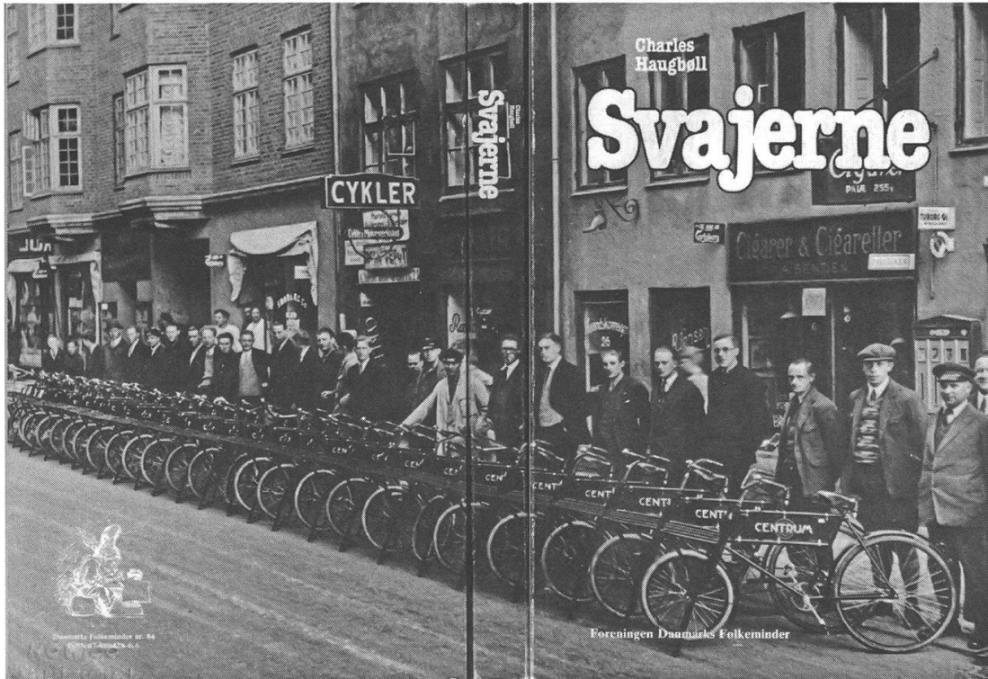
Abb. 13: Svajerne (Fahrradboten) – die 1979 publizierte Sammlung von Interviews mit Kopenhagener Lastenradfahrern im Kleingewerbe und im Post- und Telegrafendienst gibt einen detaillierten Einblick in den Alltag der Fahrer von den 1910er- bis in die 1960er-Jahre.

Neben Haugbølls mehrfach zitierte Interviewsammlung mit Kopenhagener Lastenradfahrern erinnert auch das eine oder andere Denkmal im öffentlichen Raum an die Hochkonjunktur des Lastentransports per Fahrrad: In der Hamburger Hohe-Luftchaussee steht vor dem dortigen Postamt seit den 1980er-Jahren eine «Post-liesl» neben ihrem mit Gepäcktaschen beladenen Standardrad, im niederländischen Megen befindet sich seit 2003 eine kleine, nach einem Diebstahl zwischenzeitlich erneuerte Skulptur eines Fahrradboten auf einem Lastenrad mit Korb. 46