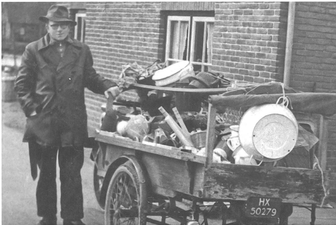
Abb. 8: Lastendreirad für den Direktverkauf: Verkauf gebrauchter Haushaltswaren, Ameide, Niederlande, vermutlich um 1950. (Nieuwsblad van de Historische Vereniging Ameide en Tienhoven, 2015-3, 34)