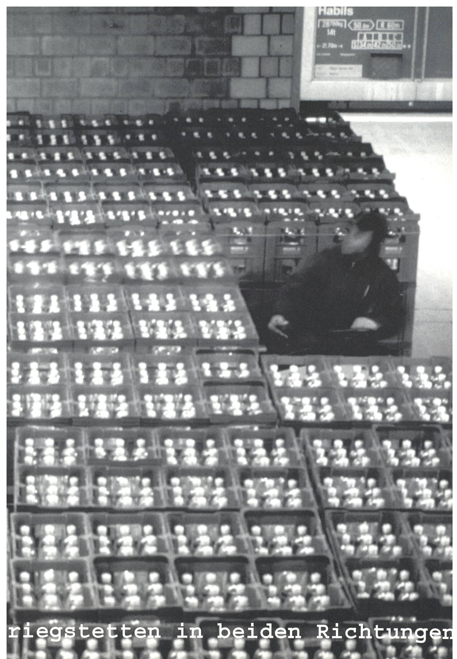
riegstetten in beiden Richtungen