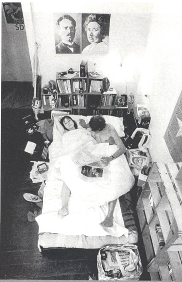
Michael Ruetz: Studentenehe, Berlin- Charlottenburg, 12. September 1968