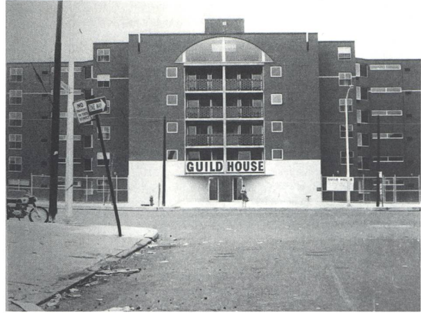
Robert Venturi: Altersheim „Guild House“, 1960-63

Intellektueller. Jetzt baue ich, kalkuliere, mache auch die Bauleitung selber. Ausserdem bin ich seit zehn Jahren wieder mit beiden Füßen in den beiden Heimaten. Das böhmische ist bodenständiger. Es steht auf einer tieferen Stufe der Modernisierung. Ich bin wirklich bodenständiger geworden. Das Baumeisterliche heisst auch, billig zu bauen. Es muss abgewogen werden mit dem Portemonnaie. Sonst werden wir so wie das städtische Tiefbauamt, das aus jedem Dolendeckel eine Aufgabe für 3000 Franken macht.