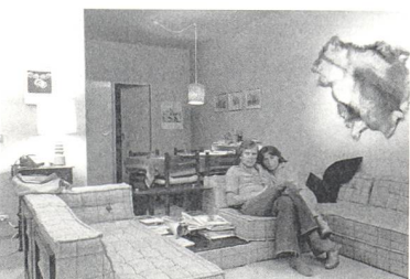
Wilmar Koenig: Architekturstudentinnen, 1977