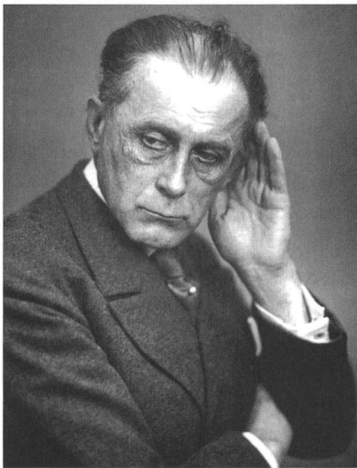
Adolf Loos, 1930